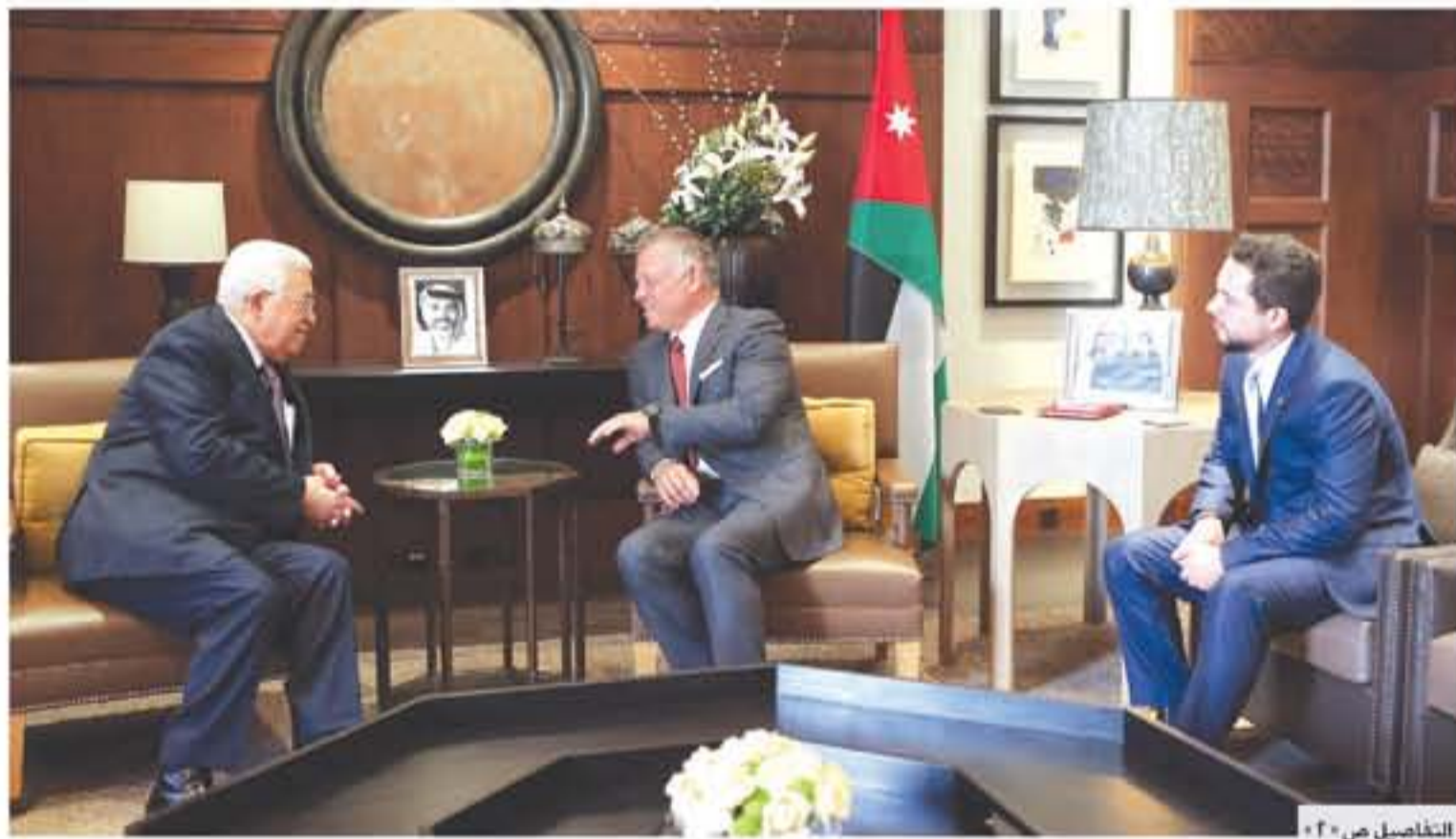
التفاصيل من ٢٠