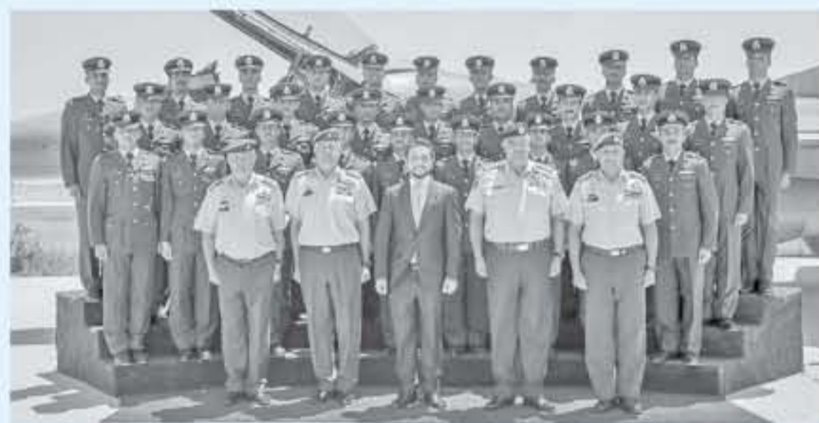
الأنباط - المرق

مندوباً عن الملك عبدالله الثاني، القائد الأعلى للقوات المسلحة، رعى الأمير الحسين بن عبدالله الثاني، وفي العهد أمس، حفل تخريج دورة مرشحي الطيارين السابعة والأربعين، في كلية الملك الحسين الجوية. وكان في استقبال سموه لدى وصوله موقع الاحتفال، رئيس هيئة الأركان المشتركة الفريق الركن محمود عبدالحليم فريجات، وقائد سلاح الجو الملكي، وأمر كلية الملك الحسين الجوية. وبدأ الاحتفال الذي حضره سمو الأمير فيصل بن الحسين، بالتسليم الملكي، ثم قام سمو ولي العهد بالتفتيش على طالبو الخريجين الذي استعرض من أمام النصة بنظامي السير البطيء والمعادي. وقال مفتي القوات المسلحة الأردنية العميد الدكتور ماجد سالم الدرواش، في كلمة له خلال الحفل، إن احتفال الوطن بتخريج هذه الكوكبة المؤهلة من سفور سلاح الجو الملكي وحماد أجياله المباركة هي مصدر فخر واعتزاز لجميع الأردنيين. وأضاف "سبيل الأردن عربين الهانسيين، مخصصة في شوق الأصدقاء التبرصين، وحننا متبعم من حصون العرب والمسلمين، وشوكة في خاضرة كل طامع