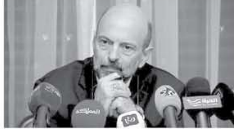
عن اية تفاصيل تتعلق بمتابعة المنحة الخليجية (قصة مكة) فيما تابعت الحكومة ودولة قطر تفاصيل المنحة التي...