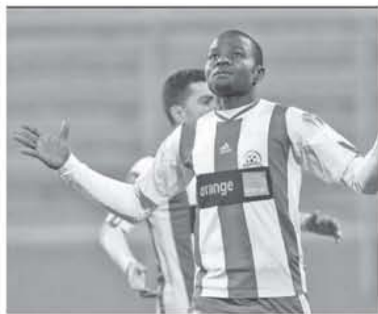
المباراة يفوز شبابي بهدفين دون رد - الجزيرة الأهلي فاز الجزيرة على الأهلي بنتيجة 2-0 ضمن مباريات الجولة الأولى من دوري المناسير حيث حصل على الثلاث