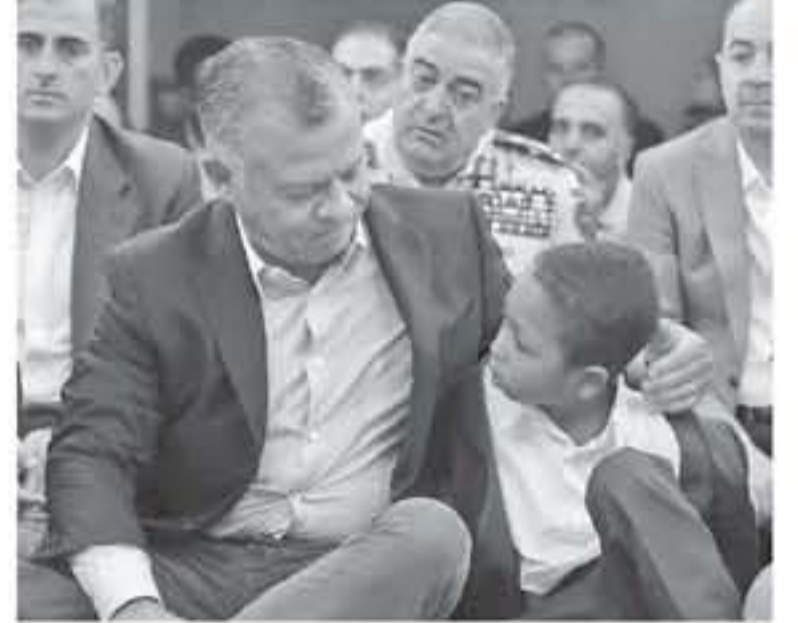
الأنباط - العقبة

أدى جلالة الملك عبدالله الثاني، وسمو الأمير الحسين بن عبدالله الثاني، ولي العهد، الثلاثاء، صلاة عيد الأضحي المبارك في مسجد الحرس الملكي بمحافظة العقبة. واستمع جلالتهم وأصغرهم ومن بينهم أسر الشهداء الذين ارتقوا أثناء تأدية الواجب الوطني في الفحيص والسلط، إلى خطبة العيد التي ألقاها إمام الحضرة الهاشمية الشيخ غالب الربيعية. وعبد الصلاة أمضى جلالة الملك وسمو ولي العهد صبيحة عيد الأضحي المبارك مع أسر شهداء الواجب، الذين استشهدوا في الأحداث الأخيرة في الفحيص والسلط. وأقر جلالة الملك أن تكون أسر الشهداء أول من يلتقي معهم صبيحة العيد، تقديرًا وإجلالًا لتضحيات الشهداء من منتسبي القوات المسلحة الأردنية - الجيش العربي والأجهزة الأمنية، والتي هي محط اعتزاز وتقدير الجميع.