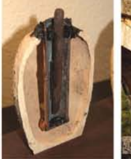
أبدعوا في ذلك ويحرق بسيطة جداً.

بطاوية بغداد اكتشفت هذه البقايا عام 1936 في قرية خوجوت رابيه، قرب بغداد، عاصمة العراق، وهي عبارة عن بطاوية تشبه في عملها حلماً جلفانياً، وربما استخدمت في عملية الطلاء الكهربائي لتحويل المواد الذهبية إلى فضية، وهذا التفسير مبني على إمكانية الافتراضية، وإن كانت النظرية صحيحة، فإنها تنمحي التاريخ المعروف لاكتشاف البطارية الحالية على يد العالم «سالندرو فولتا» عام 1800م، وهي خلية ذهبية-كروميائية، وتعود بالحدوث إلى أكثر من ألف سنة. قد تبدو تلك الأدوات بدائية بالنسبة لينا اليوم، لأنها صُنمت للفوقا بوظائفها دون عرض الأشياء على الشاشة، أو استخدام الكهرباء، لكنها كانت تؤدي الغرض منها في وقتها، بل كانت نوعاً من التكنولوجيا المتطور، وربما يأتي يوم تسخر فيه الأجيال اللاحقة مما نمتلكه من التقنيات الحديثة حالياً.