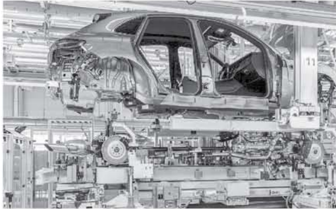
لازيغ - وكالات

التحلي عنها. أما سيارتي Macan و Macan S GT5 فمن المتوقع أن تعتمدان على محرك V6 سعة 3 لترت مع تيربو تشارج، وأخيراً سيارة بورش ماكان تيربو 2019 فمن المرجح أن تعتمد على محرك V6 سعة 2.9 لتر. ولا تتوفر لدينا تفاصيل رسمية حول سعر Porsche Macan 2019.