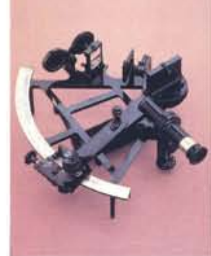
اللاحة المناسبة بسرعة.

بطاوية بغداد اكتشفت هذه البقايا عام 1936 في قرية خوجوت رابيه، قرب بغداد، عاصمة العراق، وهي عبارة عن بطاوية تشبه في عملها حلماً جلفانياً، وربما استخدمت في عملية الطلاء الكهربائي لتحويل المواد الذهبية إلى فضية، وهذا التفسير مبني على إمكانية الافتراضية، وإن كانت النظرية صحيحة، فإنها تنمحي التاريخ المعروف لاكتشاف البطارية الحالية على يد العالم «سالندرو فولتا» عام 1800م، وهي خلية ذهبية-كروميائية، وتعود بالحدوث إلى أكثر من ألف سنة. قد تبدو تلك الأدوات بدائية بالنسبة لينا اليوم، لأنها صُنمت للفوقا بوظائفها دون عرض الأشياء على الشاشة، أو استخدام الكهرباء، لكنها كانت تؤدي الغرض منها في وقتها، بل كانت نوعاً من التكنولوجيا المتطور، وربما يأتي يوم تسخر فيه الأجيال اللاحقة مما نمتلكه من التقنيات الحديثة حالياً.