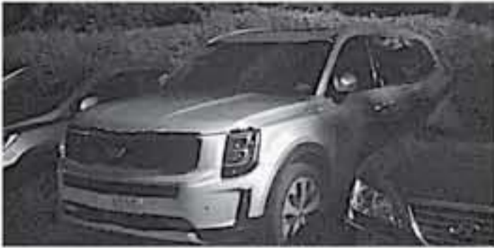
سيؤول - وكالات

الاختيارية في تصميم المصابيح الأمامية والتصاميم الأمامية، ومن الخلف يبدو واضحا لنا حدوث تغييرات على تصميم محرك العادم وحدثت تغييرات على حجم الزجاج الخلف الذي أصبح أصغر على ما يبدو في نسخة الإنتاج التجاري. وسيق وأخبارناكم متابعتنا أن سيارة Kia Telluride 2020 ستعقد ضمن فئة أعلى من شيفلتا Kia سورينكو، ويتوقع أن تعتمد هذه سيارة SUV القادمة على شاصي مستعار من هونداي ستايل 2019، ونرجح أن يكون قلبها النابض محرك 6 سلندر سعة 3.3 لتر مع شاحن توربيني مزوج بولت قوة 315 حصان (370 حصان أوروبي PS) و 810 نيوتن متر من عزم الدوران، يتصلب بـ 48 أونومالينك من 8 سرعات، وستعمل السيارة القادمة بدون أي شك بنظام دفع رباعي للمجالات. كما هناك إشاعات ترجح لوفر سيارة Kia Telluride القياسية بـ محرك 4 سلندر سعة لترين مع توربو بولت قوة 225 حصان (238 حصان أوروبي PS) و 372 نيوتن متر من عزم الدوران، يرجح فريقنا في عرب جي تي أن تظهر سيارة Kia Telluride 2020 قبل إنتهاء العام الجاري، وقد يتم بيعها في الأسواق خلال الربع الثاني من عام 2019 القادم إن شاء الله.