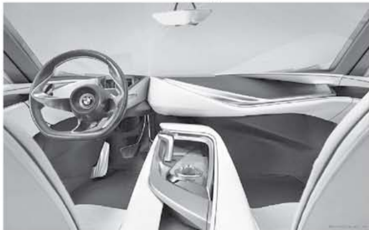
ميونخ - وكالات

تجاري ستنافس كلاً من مرسيدس EQC، و اودي E Tron، و جاكوار Pace I، و تسلا موديل X، ولكن هذا عن سيارة بي ام دبليو التي اكس 3 - bmw ixr للنسخة الكهربائية بالكامل القادمة من طراز BMW Xr. نتوقع أن سيارة بي ام دبليو فيجن iNEXT تمهد الطريق نحو سيارة بي ام دبليو ال 4 - BMW i4 الإنتاجية القادمة في المستقبل القريب إن شاء الله.