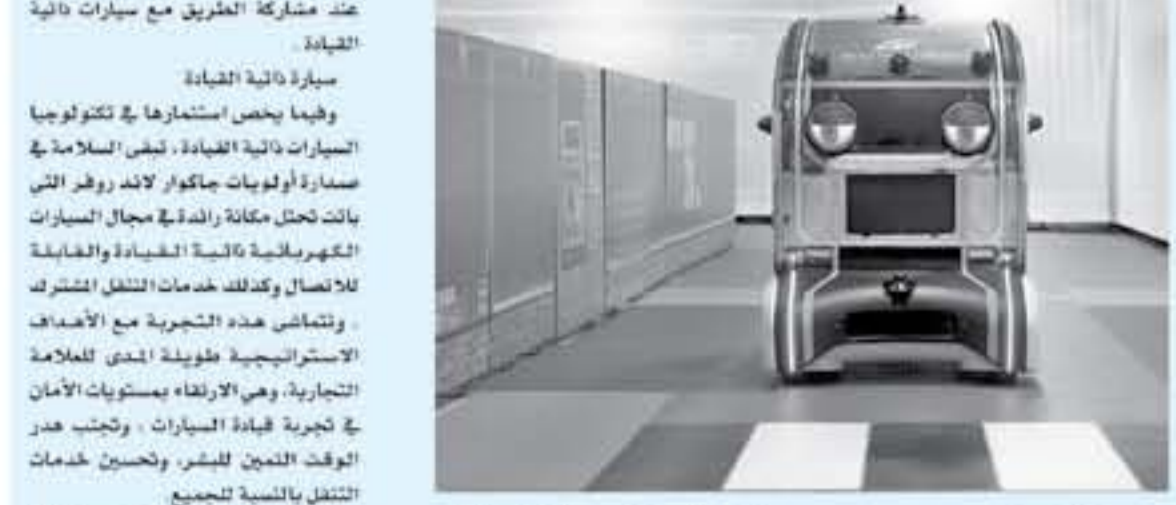
الأنباط - دبي

عند مشاركة الطريق مع سيارات ذاتية القيادة. وفيما يخص استعارها في تكنولوجيا السيارات ذاتية القيادة، ليس السلام في صناعة أولويات جاكوار لاند روفر التي باتت تحتل مكانة رائدة في مجال السيارات الكهربائية ذاتية القيادة والخيارية للاتصال وكذلك خدمات النقل المشترك. وتتمشى هذه التجربة مع الأهداف الاستراتيجية طويلة المدى للعلامة التجارية، وهي الإلفاء بمستويات الأمان في تجربة قيادة السيارات، وتحتج هدر الوقت الممن للشر، وتحسين خدمات النقل بالنسبة للجميع. ولتشرح هذه التجربة ضمن إطار دراسة أوسع لتتكشف كيفية تمكن المركبات القابلة للاتصال وذاتية القيادة مستقبلاً من محاكاة سلوك وريود أفعال البشر عند القيادة، وكجزء من الدراسة، تمت مراقبة ريود أفعال أكثر من 800 شخص أثناء تفاعلهم مع وحدات النقل الذكية ذاتية القيادة التي صممتها شركة "أورغو" شريك مشروع المملكة المتحدة للقيادة الذاتية.