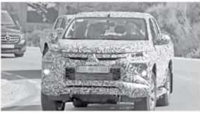
طوكيو - وكالات

زيادة ارتفاع المركبة الواضح يجعلنا نوقع تغييرات خلفية واضحة على التصميم إن شاء الله. يجدر الإشارة إلى أن شركة نيسان استحوذت على نسبة 74٪ من شركة ميتسوبيشي في عام 2016 مقابل دفع ثروة تبلغ 2.18 مليار دولار أمريكي أي ما يعادل 8.14 ريال سعودي عن قبل Nissan لتحصل على هذه النسبة الكبيرة من الأسهم في شركة ميتسوبيشي لتجعل الأخيرة تنضم إلى تحالف دايو نيسان. كما سبق وكشف ميتسوبيشي خلال العام الجاري عن نظام مساعد تثبيت المحطوة بيك، اب ميتسوبيشي L200 ورفرت أيضاً نظام الترفيه والمعلومات Smartphone Link Display Audio الذي يدعم الهواتف الذكية لا تتوفر لدينا معلومات ميكانيكية متفاهة حول خيارات المحركات التي ستوفر على بيك اب ميتسوبيشي L200. 2020 لتنافس Mitsubishi L200 من نوبوتا هايلوكس، وفورد رينجر، و فولكس فاجن أمبولك. لم يحصل فريقنا على أي معلومات ترجيح موعد إطلاق مركبة بيك اب الاختيارية ميتسوبيشي ال 200 - Mitsubishi L200 موديل 2020.