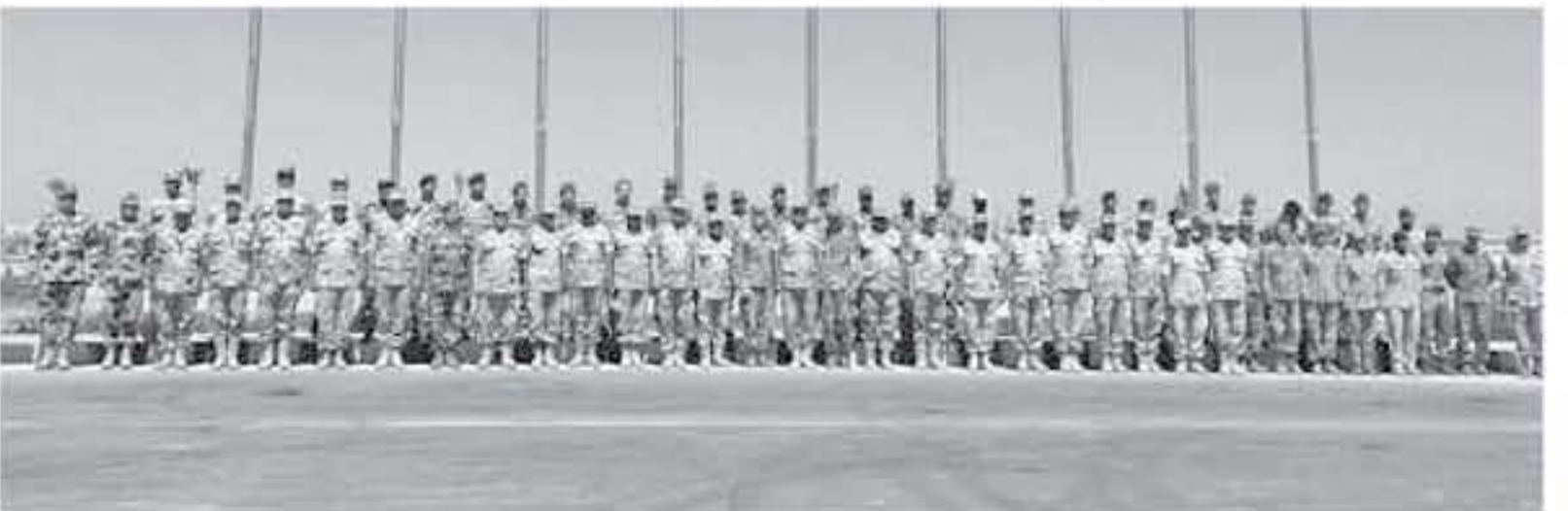
الأنباط - القاهرة

انطلقت أمس، في قاعدة محمد نجيب العسكرية في جمهورية مصر العربية مناورات النجم الساطع ٢٠١٨ التي تستمر (١٦) يوماً، بمشاركة قوات من البلد المضيف والأردن والولايات المتحدة الامريكية واليونان وبريطانيا والسعودية والإمارات وبنغاليا وفرنسا الى جانب ١٦ دولة بصفة مراقب.