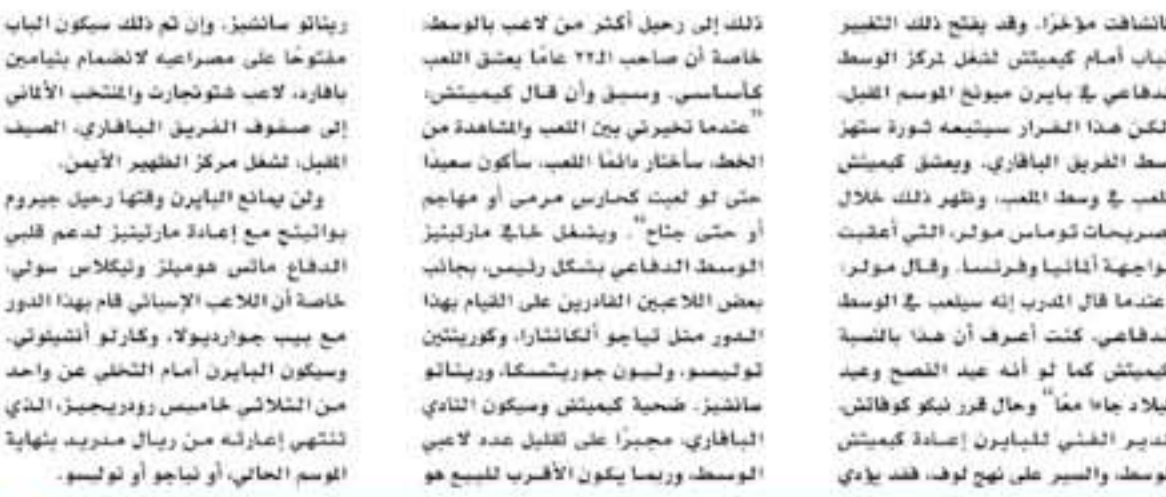
برلين - وكالات

ذلك إلى رحيل أكثر من لاعب بالوسط خاصة أن صاحب ٢٢2 عاماً يقطن في ألمانيا، وسبق وأن قال كيميشتش، "عندما تخبرني بين اللعب والمشاهدة من الخط، سأستأجر دائماً اللعب، سأكون سعيداً حتى لو لعبت كمحارس مرمرى أو مهاجم أو حتى جناح". ويشغل حاجي ماركيتيز الواسع الدفاعي بشكل رئيس، بجانب بعض اللاعبين القادرين على القيام بهذا الدور من مثل تياجو ألكانتارا، وكوريتين توكوسو، ولسون جوريتسكا، وريئاتو سالشيز. ضحية كيميشتش وسبكون النادي البافاري، مجبراً على تقليل عدد لاعبي الوسط، وربما يكون الأقر للبيع هو