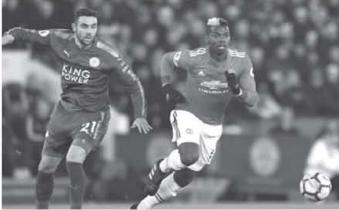
عواصم - وكالات

محكمة التحكيم الرياضية قبلت الدعوى، الذي قدمه النادي الإيطالي، وقالت المحكمة الرياضية إن موقف النادي يتفق بالفقير نقيصم وضع أي ناد، ينقل أكثر من ١٠٠ مليون يورو في سوق الانتقالات، وقال تشيفرين "تستحم اللوائح الجديدة بشكل أكبر، للاتحاد الأوروبي لكرة القدم، بالتحرك بسرعة أكبر والتعامل مع المشاكل، قبل أن تتفاقم.. الاتحاد الأوروبي سيتعامل على الفور، ويقدم قدرة الأندية على الالتزام باللوائح في المستقبل، أزمة ميلان واستيعد ميلان من الدوري الأوروبي هذا الموسم، بسبب انتهاك لوائح اللعب الثاني للتطيق، لكن