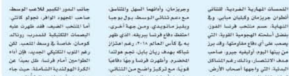
باريس - وكالات

وجريزمان، وأدائها السهل والثنائى، مع دعم ثنائي الوسط، بول بوجيا وويليز سانيويدي، ومن جهة أخرى، احتفظ دفاع فرنسا ببريقه، الذي ظهر به في كأس العالم ٢٠١٨، رغم احتجاز شبكه بهدف ريان بايل، نجم هولندا المخضرم، وأظهرت فرنسا وجهاً دفاعياً قوياً، مع تركيز واضح من الثنائي صامويل أومتيتي وزافييل فاران، إلى