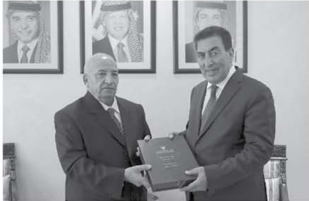
تسلم رئيس مجلس النواب المهندس عاطف الطراوة نسخة من التقرير السنوي الرابع عشر لحالة حقوق الإنسان في المملكة لعام 2017.