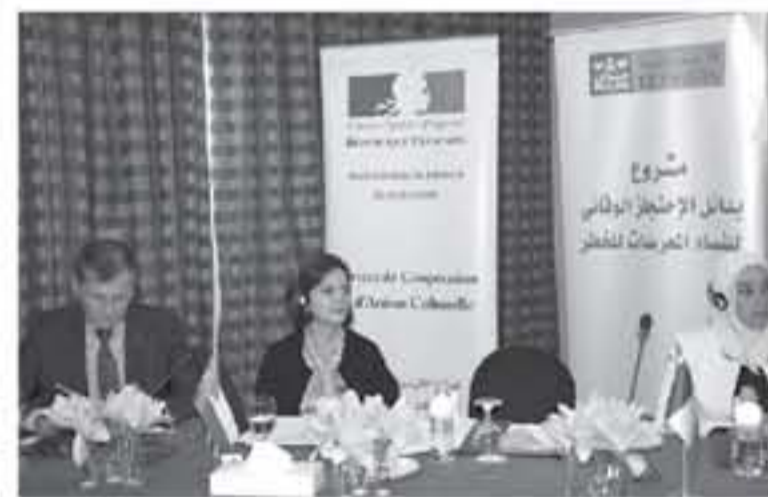
في الحياطة، من خلال التطبيق على أفضل الممارسات الاجراءات المتخذة لحماية، والتدريب والتطبيق مفهوم إدارة الحالة ومن جانبه أكد السفير الفرنسي في الأردن دانييل بيروثولي أن لنجح دار أمة يعتمد على جهد العاملين به، ومن هذا المنطلق تبرز أهمية أهليل كافة العاملين ممن هم على تواصل مباشر مع ضحايا العنف.

وتعددت التشريعات المتعلقة بالنازحين والنازحات في قانون العقوبات الاردني الخاص بحماية المرأة، وصندوق نظام دار ابواء المعرضات للخطر رقم ١٧١ لسنة ٢٠١٦. وأضافت أن الوزارة تسعى إلى تمكين هذه الفئة اجتماعياً ونفسياً واقتصادياً للاندماج