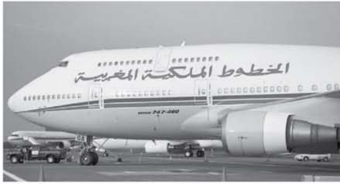
من عدة دول منها الامارات، لبنان، تركيا ومصر //