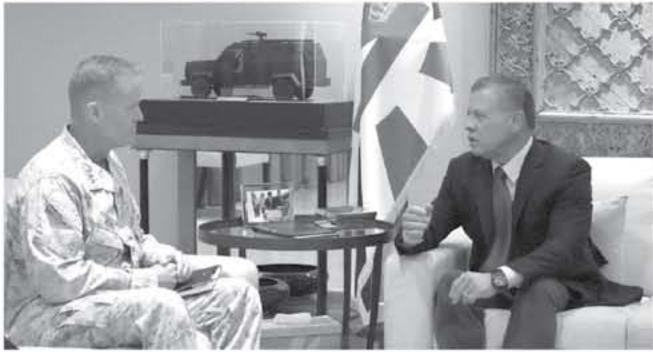
الأبواب - عمان

استقبل الملك عبدالله الثاني، أمس، قائد قوات المشاة البحرية في القيادة المركزية الأميركية الفريق كارل ماندي، في اجتماع تم خلاله استعراض العلاقات المتنامية بين الأردن والولايات المتحدة في المجالات العسكرية. وتناول اللقاء الذي حضره رئيس هيئة الأركان المشتركة الفريق الركن محمود عبد الحليم قريسيحات، الجهود الإقليمية والدولية في الحروب على الإرهاب، ضمن استراتيجية شمولية.