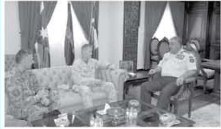
الأبواب - عمان

وبحث الفريق الركن فريحات مع الضيف آخر التطورات على الساحتين الإقليمية والدولية وأوجه التعاون والتنسيق في عدد من القضايا التي تخص القوات المسلحة في البلدين الصديقين. حضر اللقاء المصحف الدفاعي الأميركي في عمان.