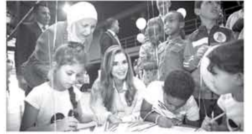
الأبطال - عمان

تم ابتكار هذه الفعالية استناداً للحملة الوطنية الشاملة متعددة القطاعات والتي تنفذ على مدى ثلاث سنوات، لخفض نسبة العنف الجسدي الواقع على كافة الأطفال في المملكة بنسبة 50% بحلول عام 2021 بالتعاون مع كافة الوزارات والهيئات الحكومية وخاصة المعنية لتناول هذه القضية بشمولية، وذلك بهدف الحد من هذه الظاهرة والعنف الواقع على الأطفال في المنزل أو في المدارس أو الحي ومن قبل أي شخص مهما كانت العلاقة التي تربطه بالطفل. ووفقاً لدراسات سابقة، يتعرض الطفل الأردني إلى العنف ومن مصادر مختلفة سواء من الوالدين أو المعلمين أو مقدمي الرعاية، حيث أن 9 من كل 10 أطفال يتعرضون لتوابع من أنواع العنف وقد يكون لهذا العنف آثار قصيرة أو طويلة المدى عليه وعلى مستقبله وعلى المجتمع الذي يعيش فيه. ويركز المهرجان على إشراك الأطفال وأفراد الأسرة ومقدمي الرعاية في إيجاد