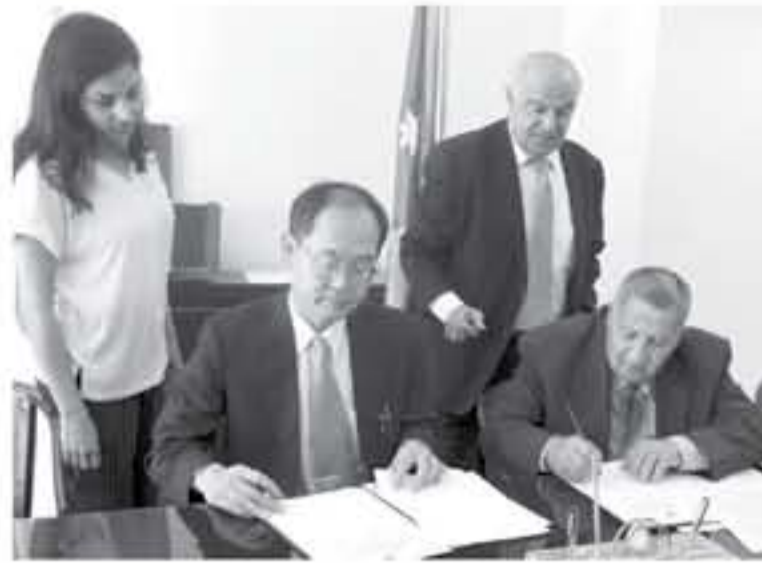
في برامجهما للتعاون الإنساني، مشيراً إلى أن المنحة تأتي للأردن ضمن إطار برنامج منح مشاريع الأمن الإنساني على المستوى الشعبي، وقدمت الحكومة اليابانية منذ ١٩٩٢ قرابة عشرة ملايين دولار لـ ١٢٢

وأكد ياناغي أن اليابان تولي اهتماماً دائماً للأشخاص الأشد حاجة اجتماعياً