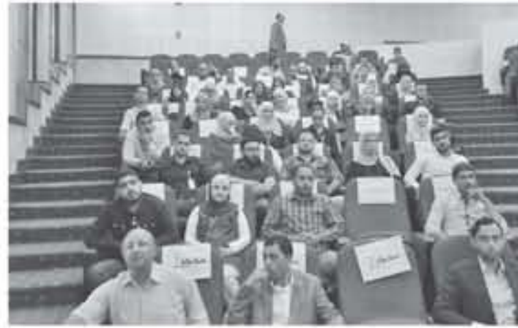
تحديدا مستمرا في إيصال الخدمة الامثل للمواطنين والعمل بروح الفريق الواحد على انجاز الاعمال الموكلة لكل موظف. وأكد الشريدة على أهمية العمل بأمانة

ومن الجدير بالذكر أن مديرية الموارد البشرية قسم شؤون الموظفين نظمت هذا الحفل واتخذت الإجراءات اللازمة لإداء القسم القانوني. //