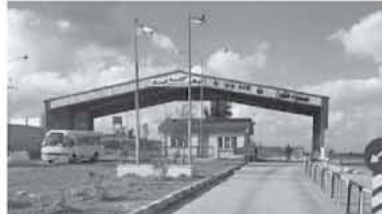
الحدود الأردنية - السورية (جابر)

سياسة الاردن تقوم على حدود مفتوحة مع جميع الاقضاء ولكنه لا يعمل على ملفات كثيرة لتخفيف العبء على هذه الخطوة منها ملف اللاجئين واعداد الاصغار وغير ذلك من ملفات عديدة . يشار الى ان اللجان الفنية يقوم عملها على إمكانية إعادة فتح الحدود الأردنية السورية ويحت المعوقات التي تقف دون ذلك ويستثمر اجتماعات اللجنة لوضع لصور كامل للاجراءات المرتبطة بإعادة فتح المعابر خلال الفترة المقبلة ليعلم ان يعلن عن موعد الاجتماع المقبل . وفي حزيران/ يونيو الماضي بدأ الجيش العربي السوري عملية عسكرية في الجنوب أدت إلى تحرير من الجماعات المسلحة ، وعند ذلك الحين بدأت تدعو جهات شعبية أردنية إلى إعادة فتح المعبر ، لما له من دور في تحريرك عجلة الاقتصاد الأردني . وعن الجدير بالذكر ان معبر نصيب - جابر الحدودي انق في شهر نيسان من العام 2016 بعد سيطرة الجماعات المسلحة على المعبر .//