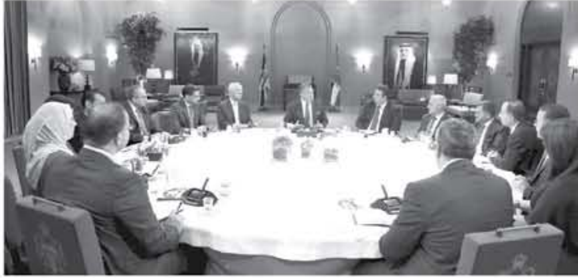
الأبواب - عمان