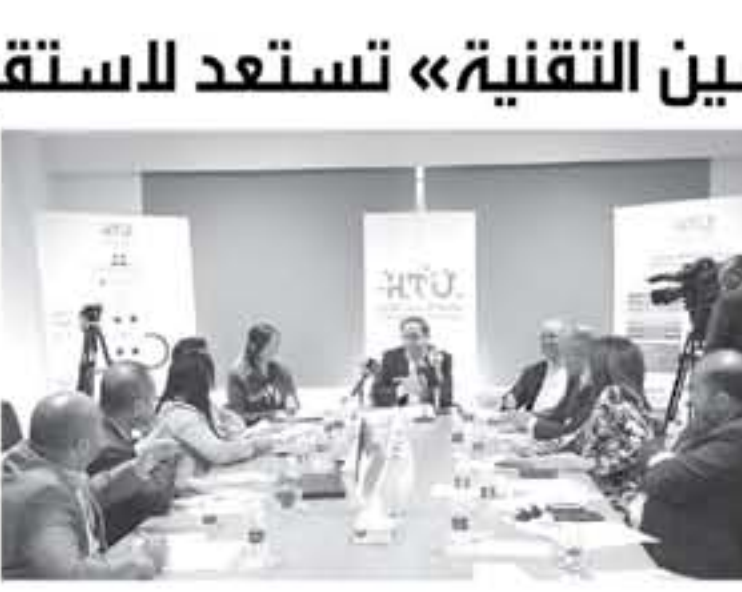
الأبواب - جاتة خضر - عمان

الأول من نظيتها مع بداية العام الدراسي 2018/2019، ويخضع الطلاب خلال التحاقهم بجامعة الحسين التقنية لدراسة مساقات مكثفة في اللغة الإنجليزية، يقوم بتدريسها كادر تدريسي متخصص لغته الأم الإنجليزية كما يخضع لبرامج تدريب عملي مكثف تشكل ما نسبته 70% من مكونات الخطة الدراسية والتي تم تصميمها وفق معايير أكاديمية عالمية وبالتعاون مع جامعات مرموقة من بريطانيا وفرنسا، وقد حرصت الجامعة على أن تتميز خططها بالثورة والتكنولوجيا وقابلية التطوير لتتوافق مع متطلبات سوق العمل المتغيرة عاماً بعد عام نظراً للتغيرات العلمية المتسارعة وخاصة في مجال العلوم الهندسية والبرمجيات.