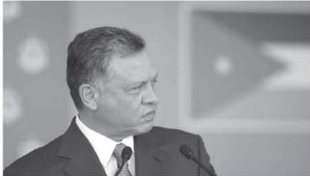
اتفاقية السلام بين إسرائيل والأردن، وعبّر هاياي عن التزامه بتحقيق السلام بين إسرائيل والدول العربية على أساس حل الدولتين بصفتها السبيل الأمثل لتحقيق تعزيز الاستقرار في المنطقة.