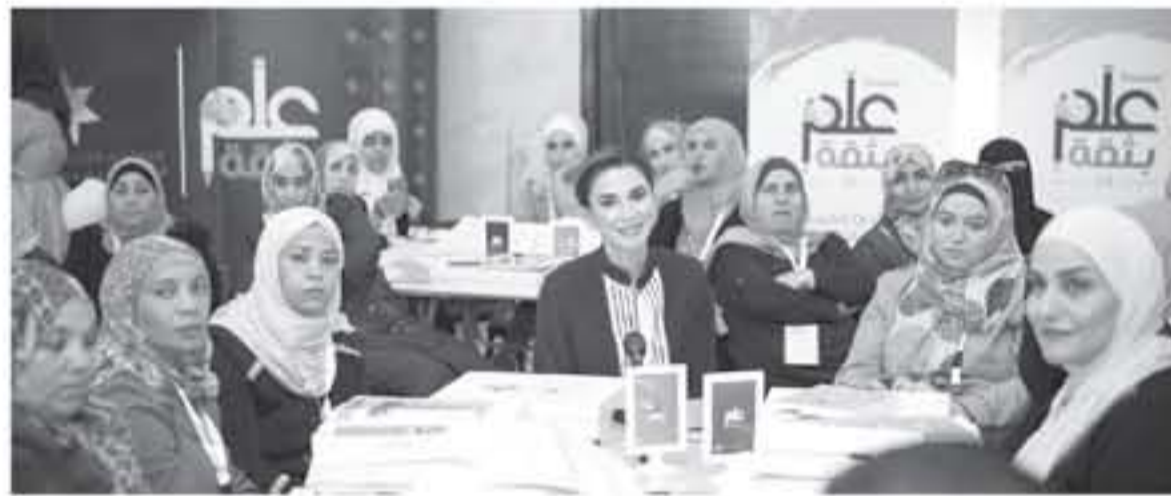
الملكة رانيا العبدالله، أمس، في مدرسة الملك عبدالله الثاني للتشيز في محافظة الكرك، عدد من معلمين محافظات الجنوب للتدبير من برامج أكاديمية الملكة رانيا لتدريب المعلمين.