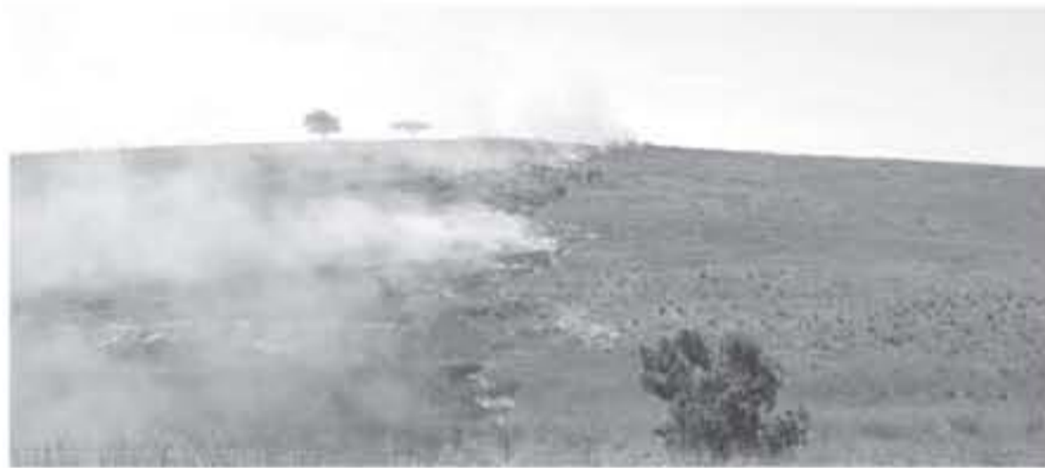
الإسرائيلية بأن الحرائق أتت على 3٢ ألف دونم من الأحرش والمناطق الزراعية والطبيعية في غلاف غزة، بما يوازي ١٤ في المائة من مجمل المحميات الطبيعية التابعة للاحتلال. وفتحت محاولات جيش الاحتلال الإسرائيلي في التعامل مع هذه الظواهر التي باتت تشكل تهديداً حقيقياً للمحاصيل.

قال الجنرال احتياط "يسرائيل زيف" لوفع ريشث كان العبري أمس الاثنين، إن الوضع في غزة على حافة الهاوية، وليس بعيداً عن الانهيار وأضاف زيف، "يجب أن نفلو الحقيقة، الجيش الإسرائيلي لا يمكنه الانتصار في حرب البالونات والإطارات". وقال خلال حديثه عن ضرورة الحديث مع "حماس"، "لا أعلم ما إذا كان هناك نصح للتوصل إلى اتفاق سلام، لكنني مقتنع أنه من الصواب بدء الحديث". ويستمر الشبان الفلسطينيين من إطلاق طائرات ورقية وبالونات حارقة، باتجاه المستوطنات الحادية لغزة منذ بداية "مسيرات العودة" التي انطلقت في ٣٠ آذار/ مارس الماضي، كشكل من أشكال المقاومة إلى جانب الحجارة والزجاجات الحارقة. وقدرت "سطة الطبيعة والحدائق