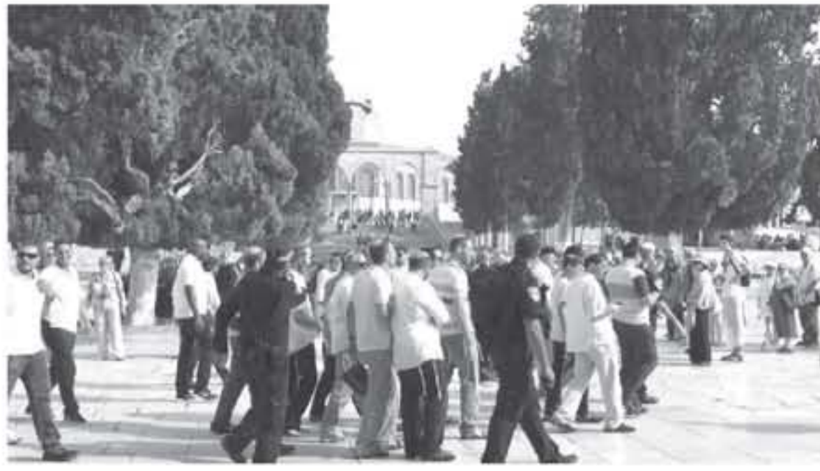
منذ فترة طويلة، يتعرض المسجد الأقصى يوميًا (عدا الجمعة والسبت) لسلسلة التهاجمات والتهجمات من قبل المستوطنين والجماعات اليهودية المتطرفة وعلى فترات صباحية ومساءلية.