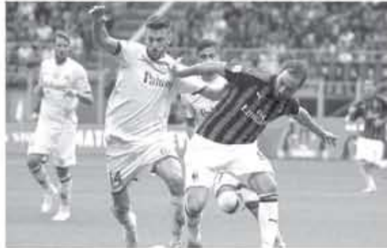
ميلان - وكالات

ويثير السان باولو بضربة رائعة.. نابولي يهني ضارق الـ ٦ نقاط مع الـ ١٠٠٠. وتابعت، "ميلانو تسخن بالفعل.. إنتر وميلان يفوزان بتأدية لكل من إيكاردى وهيجواين، بعد فترة التوقف المول، إنه المديرين". وختمت، "ساري يرتقي في صدارة البريميرليج مع جوارديولا و"كلوب" و"هشونت صحيفة "الو سبورتنج"، وروالدو على الهجوم.. وليس السوزراء البرتغالي يقول، كريستيانو برن، وأضاف، "مف سري.. هنا كيف يستعد محامو رونالدو لتكثيف الاتهامات من الولايات المتحدة"، وتابعت، "في الوقت نفسه، خطة بوفونوس للمستقبل.. بلاتيس في باريس، والهدف هو رايبوت". وأردفت الصحيفة، "أوناس، إيسيتو، ونابوتي العطيم.. هزموا ساسولو في المرتبة الثانية خلف بوفونوس، ويبرزون جودتهم". وأضافت، "أشيلوني يجري ٨ تغييرات على تشكيلة يوم الأربعاء.. أوناس يفتتح التسجيل ثم بعض الاعاناء، لكن لورينزو إيسيتو يدخل للمباراة