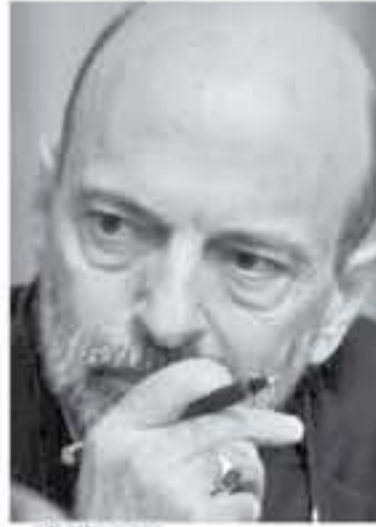
د. عمر الرزاز

لم يتم التأكد بعد ، ان كان الرئيس عمر الرزاز سيستمع الى فصالح نيابية من نواب العيار الثقيل حول تأجيل تعديله الحكومي المتوقع نهاية هذا الاسبوع او مطلع الاسبوع القادم على ابعد تقدير ، الى ما بعد تمرير قانون ضريبية الدخل ويعد موازنة الدولة للعام 2019 ، بعد نصيحة أكثر من نائب وحضرة سياسية رفيعة ، وأن تأجيل التعديل سيكون أكثر فائدة وأكثر حصة سياسية لاستيعاب تداعيات الموازنة وقانون الضريبة ، حيث من المتوقع ان تشهد الشوارع حراكات شعبية واحتجاجات حزبية ونقابية بعد تمرير القانون ، ويحتسب ان يكون التعديل بمثابة استرضاء شعبي او امتصاص لاي حركة احتجاجية . الفصالح السياسية اعتمدت على ان التعديل بمثابة طوق النجاة للحكومة الدكتور الرزاز التي شابها عوار كثير في التشكيل الاول حسب رأي كثيرين صدمتهم تشكيلة الرزاز التي اعتمدت على اسما عابرة للحكومات الثلاث الاخيرة والتي حطمت كلها بهجوم شعبي كاسح ، فيما يرى كثيرين ان الرزاز لم يتوقف درس الموار الرابع جيدا وان التعديل سيكون رسالته