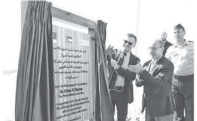
بغداد - أريد

ينتج عنه من توفير فرص عمل الأمر الذي يؤكد أننا متبلون في هذا الموقع على تحويل التحديات البيئية والصحية التي فرضتها للطاقة وأشار إلى أن هذه الخلية مع الخلية السائلة التي سيتم دعمها من الحكومة الكندية من خلال الاتحاد الأوروبي تشكل حلقة مهمة في طريق الانجاز، وتوقع من كفاءة مكب في استقبال الغازات الصلبة والارثا في إطار الاستراتيجية الوطنية لإدارة النفايات الصلبة المعدة حتى عام ٢٠٢٤، والمندومة من الاتحاد الأوروبي والدول الصديقة الناحية والمنظمات الدولية. ولفت إلى أن معظم الدراسات الجرت ضمن هذه الاستراتيجية لتعمير وتطوير مواقع مثل ذلك، وتخلص عدد الكتيبات من ٢١ إلى ٩ مكبات فينك، تحكي شموخ مكب الاكيدر بالتركيز على مشروعات التوسعة والتحديث من جهة التوسع في إنشاء المحطات التحويلية من جهة أخرى، وصولاً لتحويل واقع إدارة النفايات الصلبة واستغلالها على النحو الأمثل وفق أفضل الطرق الفنية والتكنولوجية العالمية. وتووه المهصري إلى أنه سيستمر في تحسين واقع مكب الحصينات واستغلاله بإنتاج الاسمدة