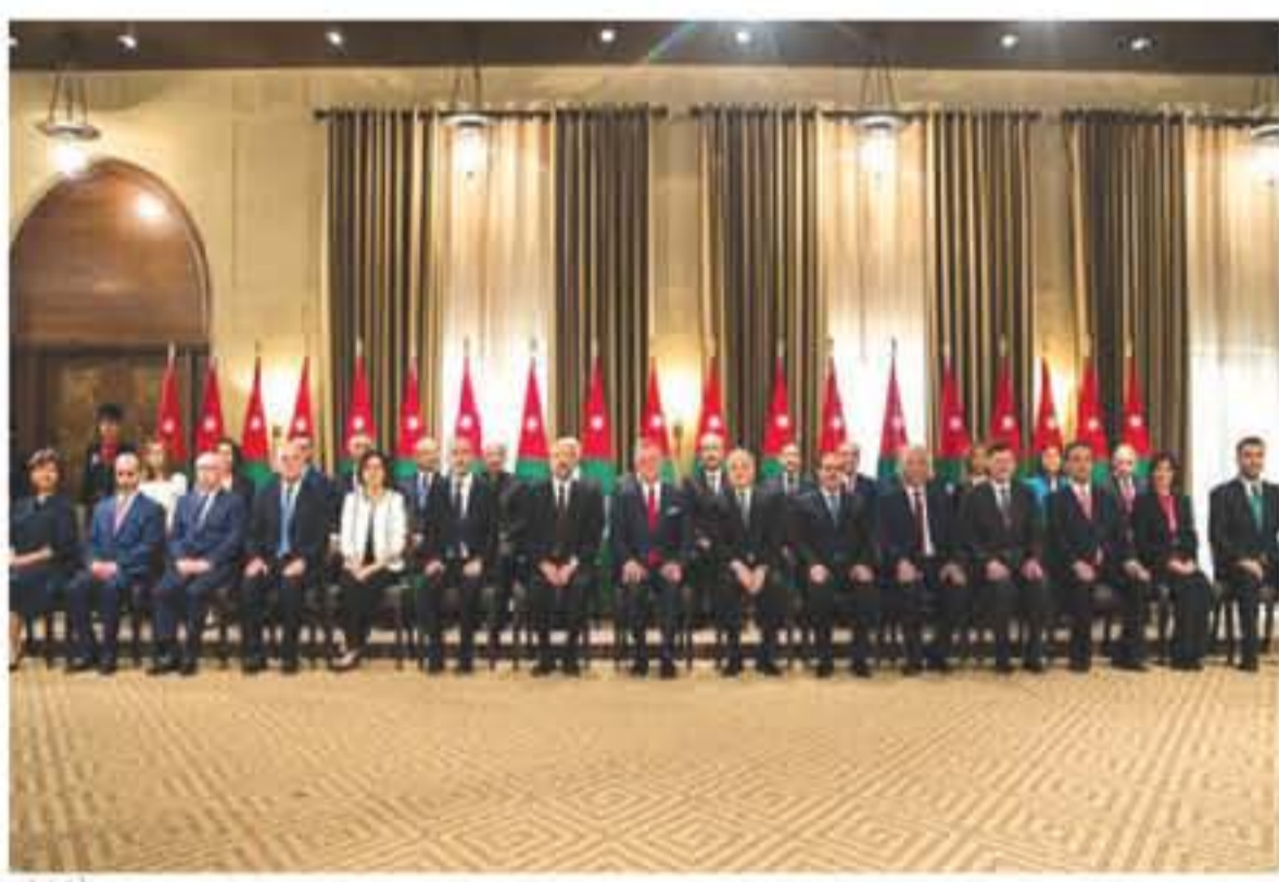
رسمية كان يرأسها الدكتور هاني المظني. وكانت حكومة الرزاز قد تشكلت في حزيران الماضي بعد استقالة حكومة هاني المظني، على خلفية الاعتصامات والإضراب الشعبية بعد بدء الحكومة إجراءات تحرير قانون الضريبة.

الأنباط - عمان عممت "الأنباط" أن رئيس الوزراء الدكتور عمر الرزاز طلب من الوزراء تقديم استقالاتهم تمهيدا لإجراء أول تعديل على حكومته والتوقع أن يجريه اليوم الخميس. جاء ذلك خلال جلسة مجلس الوزراء الذي ترأسها الرزاز يوم أمس. وتوقعت المصادر أن ينجح الرزاز إلى إجراء تعديل على الحكومة من سبع إلى ثمان حقائب وزارية، بالإضافة إلى منح بعض الوزراء التنشيطية في طبيعة عملها، وذلك من أجل ترشيح الطاقم الوزاري. وكان الرزاز قد وعد النواب أثناء مناقشات الثقة ببيان الحكومة بإعادة تقييم عمل الوزراء بعد انقضاء فترة الثقة يوم على تشكيل الحكومة، وهي الفترة التي انتهت الأسبوع الماضي. وحظي الرزاز بحسب استطلاعات الرأي على ثقة شعبية عالية في بداية التكليف الملكي له بتشكيل الحكومة غير أن الثقة بالرزاز تناقصت بعد تشكيل الحكومة التي واجهت اعتراضا واسعا نيابيا وشعبيا وذلك بسبب عودة خمسة عشر وزيرا من الحكومة السابقة التي