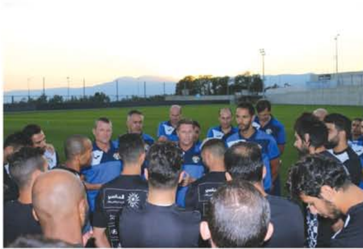
عنا قبل العودة الى العاصمة عمان فجر الاربعاء القادم.