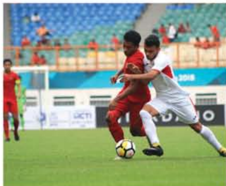
مهمون بالنتيجة بقدر الأباء خاصة في الشوطين الثاني.