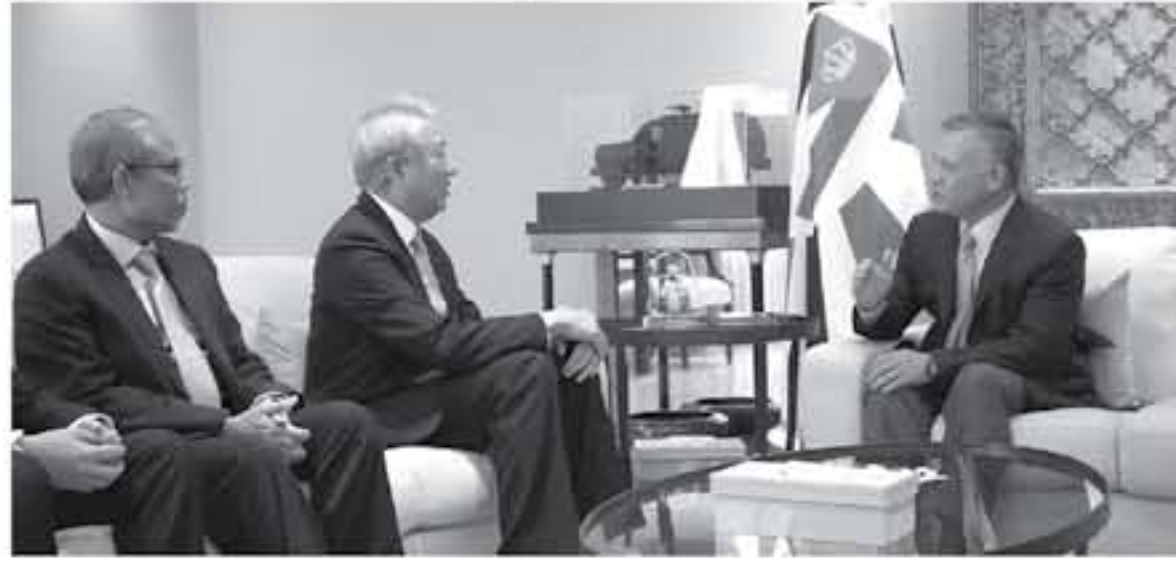
الأمن والاستقرار في الشرق الأوسط، بقيادة جلالة الملك، من أجل تحقيق مدير مكتب جلالتة، ومدير الخباياث العامة، والوفد المرافق لنائب رئيس الوزراء السنغافوري.

استقبل الملك عبدالله الثاني، أمس، نائب رئيس الوزراء السنغافوري لتسليم دعوة سنغافورية لحضور المؤتمر الدولي «مجتتمعات متهاسكة» الذي تستضيفه سنغافورة في شهر تموز من العام ٢٠١٩.