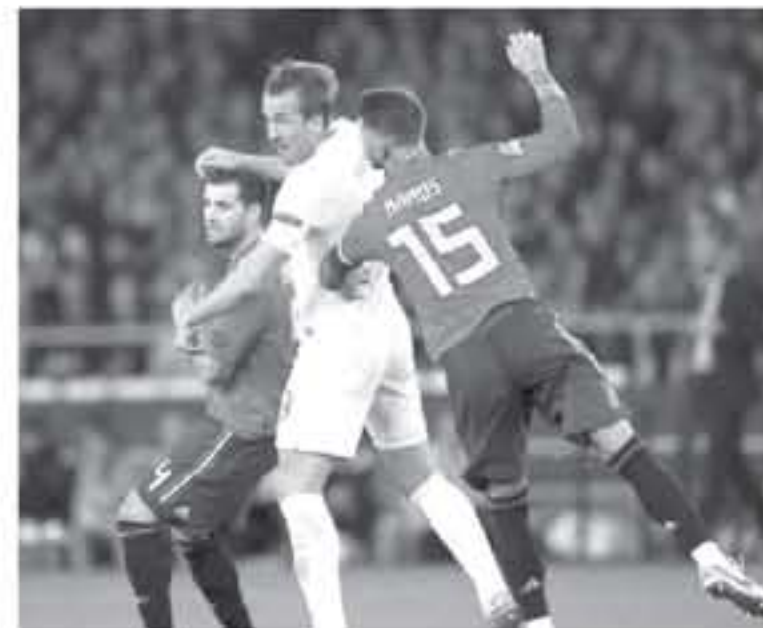
سيرجيو راموس، مدافع إسبانيا، الهدف الثاني لبلاده في الوقت بدل الضائع، لكنه

تعرض للاشتدادات من وسائل الإعلام، وكتب خوان كارلوس نيباز في صحيفة