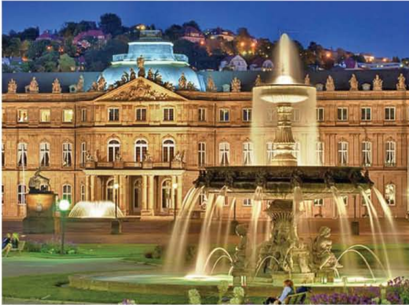
من العروض والاحتفالات