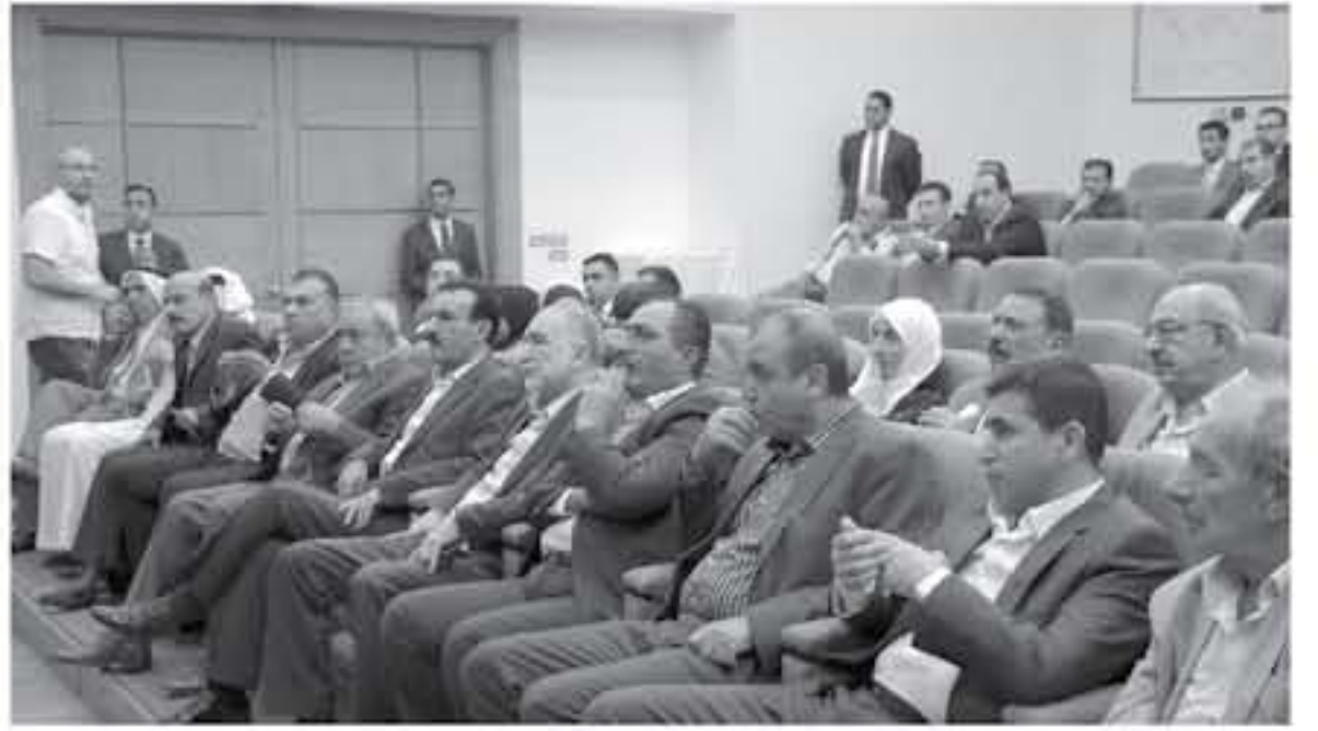
الأنباط - وليد حسني

يعقد مجلس النواب صباح اليوم أول جلساته خارج قبة مجلس الأمة بسبب أعمال التجهيز التي يباشر المجلس بتنفيذها داخل القبة والتي ستستمر شهرين وفقاً لخطبة التحدية الممتدة. ويجتمع المجلس اليوم في ثاني جلساته