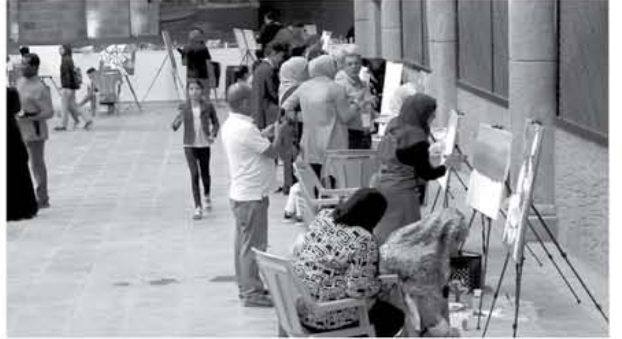
الانباط - العقبة - خليل الغرابية

خلال إقامة معرض فني يضم عددا معبزا من اللوحات وتثبيت جداريات فنية داخل نادي الأمير راشد. وقال كريشان ان الملتقى يعمل على إشراء التشكيليات والحركات الفنية التشكيلية، من خلال حضور العديد من التيارات الفنية المختلفة ما يساهم في الإرتقاء بمستوى الفن التشكيلي العربي بشكل عام من خلال تبادل الأفكار وتراكم الخبرات الفنية بين فناني البلدين. وأكد أن الهدف من إقامة المعرض الفني والجداريات الفنية التشكيلية