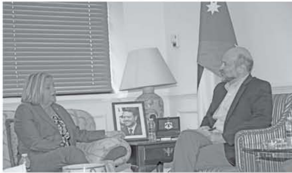
الدعم يسهم في تعزيز جهود الحكومة في التعامل مع التحديات الاقتصادية. وعرض رئيس الوزراء للتحديات الاقتصادية التي تواجه المملكة، لافتاً إلى أن الظروف الإقليمية واستقبال اللاجئين السوريين قادم من الأوضاع

وأعرب الرزاز عن تقديره للدعم المستمر الذي يتلقاه الأردن من الولايات المتحدة الأميركية، لافتاً إلى أن هذا