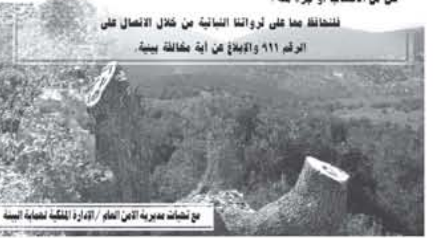
مع تضافات مديرية الأمن العام / الإدارة العامة لحماية البيئة

أخي المواطن ..... اخطي المواطنه إن صنع أي مادة حرجية أو حيازتها أو تخزينها أو تصنيعها أو نقلها دون ترخيص يعرضك لعقوبة الحبس لمدة ثلاثة اشهر وغرامة مالية مقدارها ( ١٠٠ ) دينار عن كل طن من الاشكاب أو جزء منه .