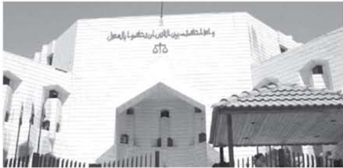
قصر العمل (أرشيفية)

فجر أحد المواطنين الأردنيين وهو المشتكى أكبر قضية تزوير في تاريخ البنوك الأردنية تعود إلى عام ١٩٨٦ قضية التزوير التي كان يملكها أحد البنوك المحلية العربية في الأردن حيث وضع الأول يده على عثرات وهي عبارة عن اراض تقع في منطقة الجيزة تعود إلى والد المشتكى دون وجه حق. ولكن تفاصيل القضية كما رواها المشتكى، اللانسيطة، عندما قام والده بتاريخ ١٩٨٦/١٢/١٢ بمقابلة أحد اصحابه بمبلغ ٢٤٠ دينار شامل الضمانات والوقود والرسوم حيث كان لا يرى أحداً له أية بضمان عثرات وهي عبارة عن ٥٠ هكتاراً ارض في منطقة الجيزة.