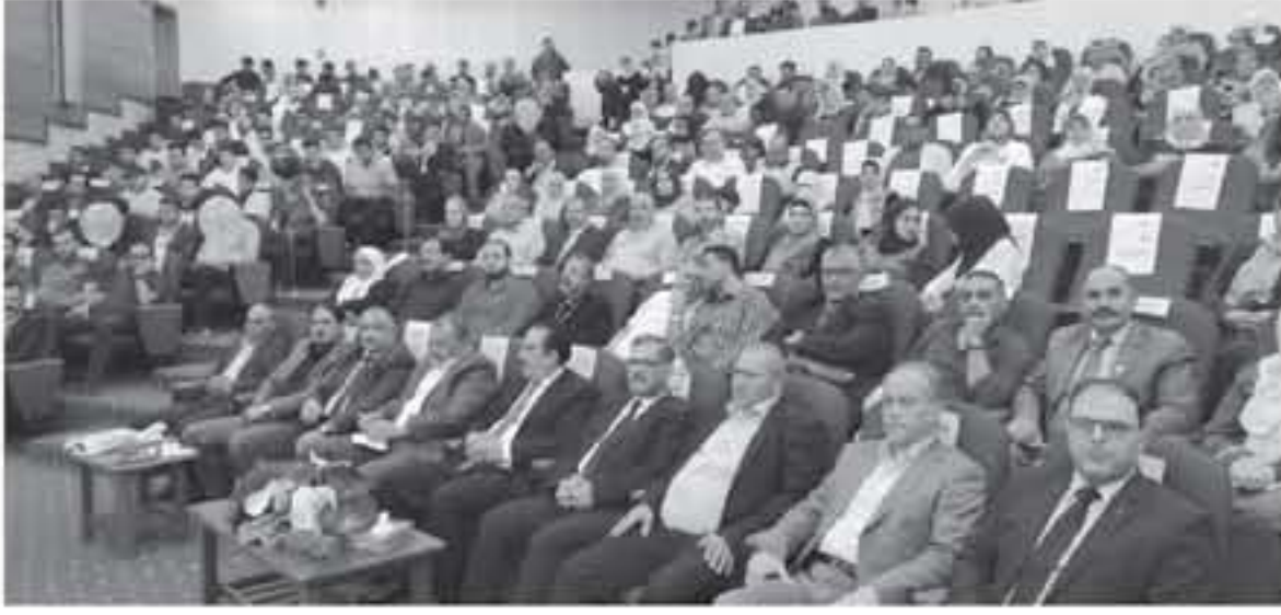
الانباط - العقبة - خليل الغرابية

الجهل واللام والياعم فستضاء الدروب وتمعر ممتنا دور النقابة بتكريم عدد من الطلبة الاوائل صناع المستقبل في المحافظة لتحفيزهم على مواصلة النجاح في المرحلة الجامعية. وعمر مدير التربية السابق المتقاعد الدكتور خالد ذبيبات خلال كلمة له باسم المعلمين المتقاعدين عن فخره واعتزازه بالثقافة وما يقدمونه من دعم للمعلم مؤكدا ان المعلم هو حجر الأساس في بناء المجتمعات. وفي نهاية الاحتفال قدم راعي الحفل الهدايا على المتقاعدين من المعلمين والمعلمات وابناء العاملين في التربية والتعليم ممن اجتازوا امتحان شهادة الثانوية العامة بمعدلات عالية /.../