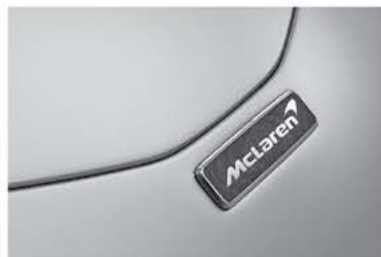
برلين - وكالات

لـ سيارة ماكلارين Speedtail الجديدة القادمة ٢٩١ كم/س (٢٢٣ ميل/س).