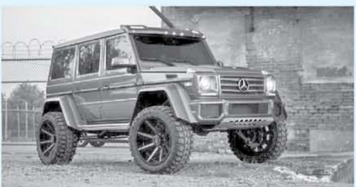
اتلانتا - وكالات

الدوران، يتصل بـ فير اوتوماتيك من ٦ سرعات. وتتصارع هذه النسخة من طراز مرسيدس جي كلاس - Mercedes G Class من ١٠٠ كم/س في ٧.٤ ثانية. قبل أن تصل إلى سرعتها القصوى التي تبلغ ٢١٠ كم/س بما أن هذه السيارة مرتفعة عن الأرض فقد تشكلت سرعات أعلى من ذلك خطراً قد يؤدي إلى انقلابها لا غير الله.