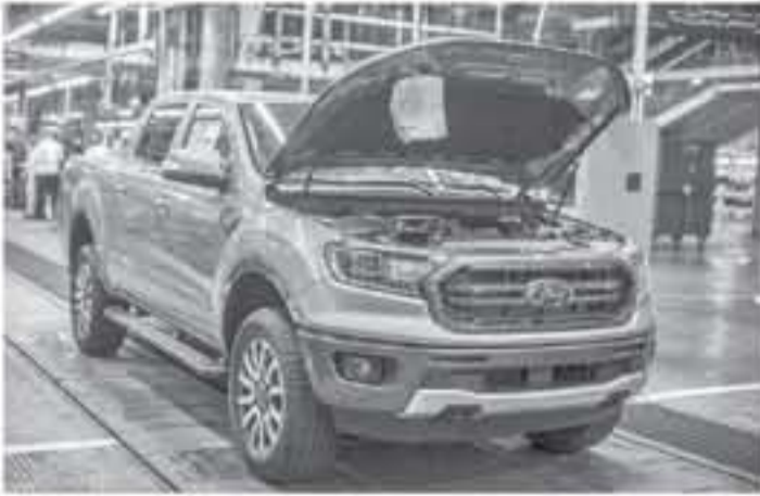
ميشيغان - وكالات

الأمريكية فورد رينجر ٢٠١٩ على محركه اليكويوست ٤ سلندر سعة ٢.٣ لتر مع تيربوتشارج بولد فورد ٣١٠ حصان و ٤٧٥ نيوتن.متر من عزم الدوران. مستعان من شيفلتها سيارة العضلات فورد موستنج ٢٠١٨. يتصل هذا المحرك بـ فير اوتوماتيك من ١٠ سرعات. وتعمل مركبة البيك اب هيماسيا بنظام دفع خلفي للمحركات ودفع رباعي اختياري للمحركات.