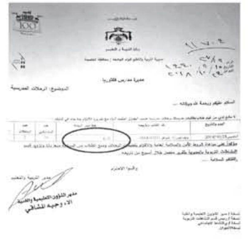
معلمة فكتوريا للتربية والتعليم

ارتكبت مدرسة فكتوريا الخاصة خلال الرحلة المدرسية لطلبتها للبحر الميت يوم اول أمس الخميس عدة من المخالفات، على ما اظهرته وثائق وزارة التربية والتعليم وكذلك المدرسة. وتضمنت المخالفات تغيير مسار الرحلة الصرح بها من وزارة التربية والتعليم من منطقة الأزرق إلى البحر الميت، وإشراك طلبة من صفوف الرابع والسادس في حين أن مواظفة وزارة التربية والتعليم كانت محصورة بطلبة صفوف السابع والثامن والتاسع. كما تضمنت المخالفات كذلك الذهاب إلى أماكن السياحة، ما شكل مخالفة لتعليمات الرحلات المدرسية، والتي تمنع الذهاب إلى هذه الأماكن وضرورة مراعاة وشروط الأمن والسلامة العامة والإلتزام بتعليمات الرحلات ومنع الطلبة من السباحة والابتعاد عن المناطق الخطرة.