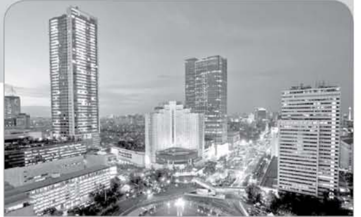
رصد جملة خنفر

الكثير من الخيارات المناسبة للجميع وإن كان يغب عليها التكلفة المرتفعة بشكل عام، وهذا ليس مستغرباً خاصة وأنها من أجمل وأرقى الفنادق والمنتجعات في إندونيسيا وأسيا، إنها مثالية لرحلات شهر العسل والأزواج أكثر منها للعائلات، حيث لا تقدم الكثير من الأنشطة الممتعة للأطفال باستثناء السياحة.