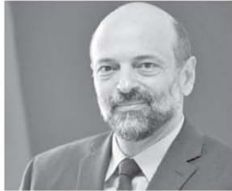
العلنية، بالإضافة إلى وضع أسس واضحة ومعدلة لسياحة المغامرات. وأوصى إلى اللجنة بتقديم تقرير مفصل وشامل حول أوضاع الجسور

كما وجه رئيس الوزراء اللجنة إلى مراجعة أسس وشروط ومعايير الرحلات المدرسية، وتقديم التوصيات والمقترحات لتحديثها وتحسينها بما يضمن سلامة