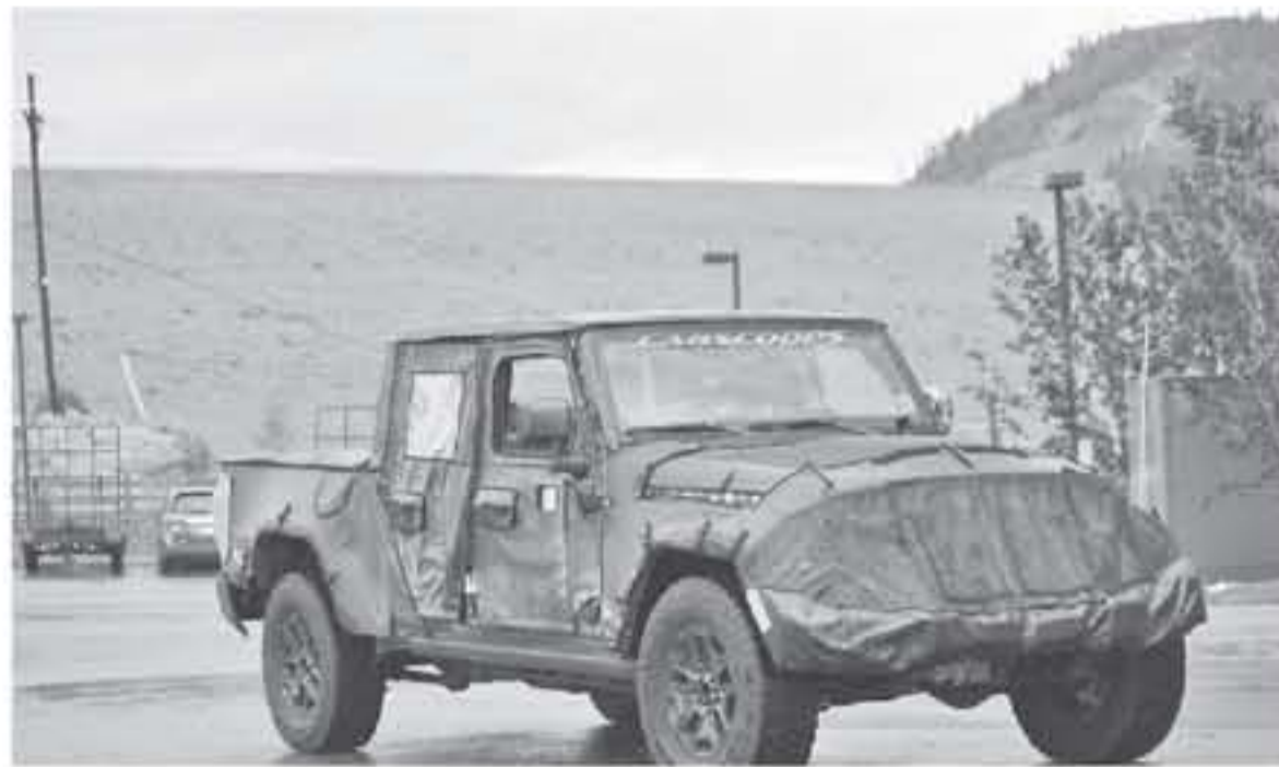
لوس انجلوس - وكالات

حالا تتوفر لفريفتنا معلومات رسمية عن بيك اب جيب سكرامبلر ٢٠١٩ القادم الذي سينافس كلاً من جى ام سي كانيون، و فورد رينجر، و تويوتا تاكوما، و شيفروليه كولورادو ZR٢، و نيسان فورتيفر، و هولدا ريدج لاين، سنزودكم بها على الفور إن شاء الله على موقعنا.