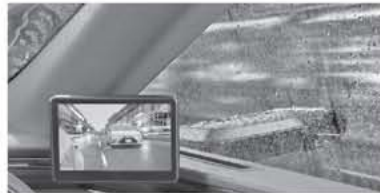
طوكيو - وكالات

علم وزاد عرضها ٤٥ ملم مقارنة مع الجيل الماضي، مما انعكس على مساحة المقصورة الداخلية لهذه السيارة.