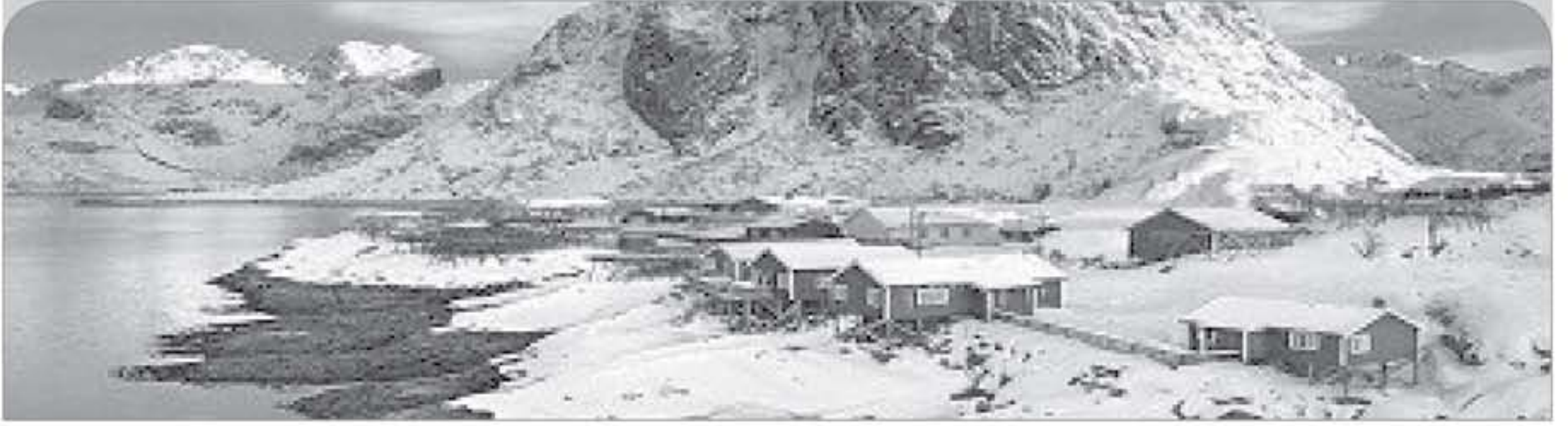
الأنباط - رصد جملة كنفر

بدأ فصل الخريف بالتلاشي تقريباً وبدأت درجات الحرارة بالانخفاض وذلك لا يعني أبداً أن عليك البقاء في منزلك وعدم الخروج ووضع حطمت السفر بأكملها جانبا للبقاء دافئاً والابتعاد عن البرد لأن في هذا الوقت من السنة خصيصاً تصبح الكثير من المدن الأوروبية أكثر جاذبية وتستحق الزيارة حقا دوناً عن أي فصل آخر وذلك إذا كنت تحب حطمت لجمال لطيفة فيجب ان تكون السياحة في أوروبا هي وجهتك القادمة هذا الشتاء فابتعد عن المدن الكبرى و ألق نظرة على هذه المدن الأوروبية الحسن الأقل شهرة.