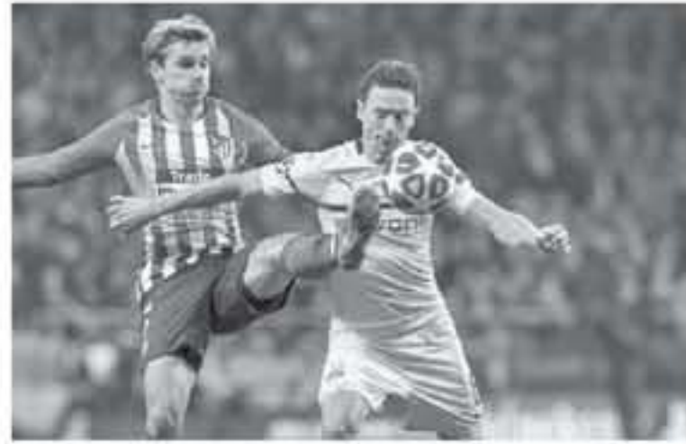
برلين - وكالات

خسر في الجولة الماضية برعاية نظيفة على ملعب سيجنال إيدونا بارك، وأضاف جيريمان في تصريحات عقب اللقاء، كان من الضروري الفوز، لأننا نلعبنا ضربة قاسية هناك وكانت لدينا رغبة لتواجدهم من جديد، وحول حظوظ أنتليكو مدريد في التأهل كمتصدر للمجموعة الأولى، وهو أمر لا يعتمد على الأتالي، لأن بوروسيا يتفوق بفارق الأهداف في الهجمات المباشرة، وأضاف جيريمان كل شيء يمكن أن يحدث، واقع كل شيء وارد في كرة القدم، سواء التأهل للدور التالي أو الخروج من البطولة، يجب الاستمرار في العمل كما نعمل