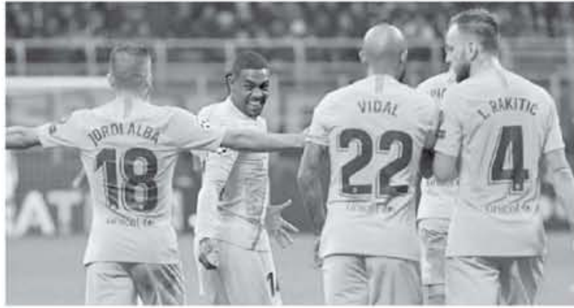
عواصم - وكالات

الموقف نابوي، يحتاج إلى الانتصار على ريد سائر الصربي ليفربول للعبور للدور التالي، ورفشها يكون رصيده ١٢ نقطة باريس سان جيرمان يملك ٥ نقاط، ويتقدمه ميرانثين ضد ليفربول وريد سائر، وحال حقق الانتصار في المباراة سيضمن التأهل برصيد ١١ نقطة وريد سائر يتواجد في المركز الأخير برصيد ٤ نقاط، وأمامه ميرانثين ضد باريس سان جيرمان ودانوبو، وإذا انتصر في كلا المباراتين سيضمن بطاقة العوور ١٠ نقاط.