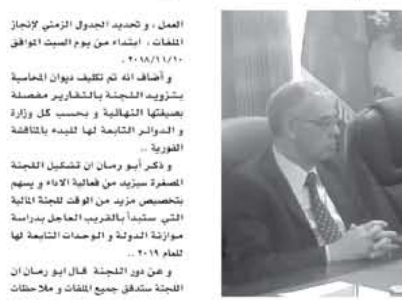
اللجنة المهفزة باشرت بزيارتها الأولى الى ديوان المحاسبة يوم الأربعاء واجتماع تمهيدي وتم وضع آلية وخطة سير العمل ، وتحديد الجدول الزمني لإنجاز الملفات ، ابتداء من يوم السبت الموافق ٢٠١٨/١١/١٠