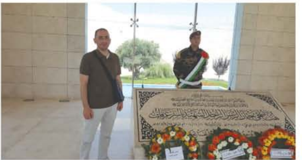
جدارية فنية لابرز القيادات الفلسطينية وضريح الرئيس بالقرب من المتحف في رام الله