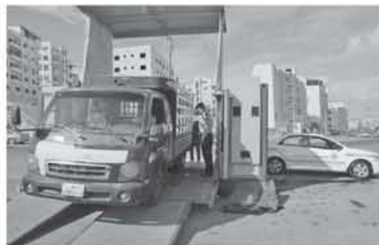
الفحص المتنقلة بشكل دوري في مختلف المحافظات بدءاً من العاصمة.

والتحرك مع التركيز على صلاحية المركبات المصومة التي تعد الأكثر استخداماً من قبل المواطنين، حيث سيتم تغيير موقع محطة