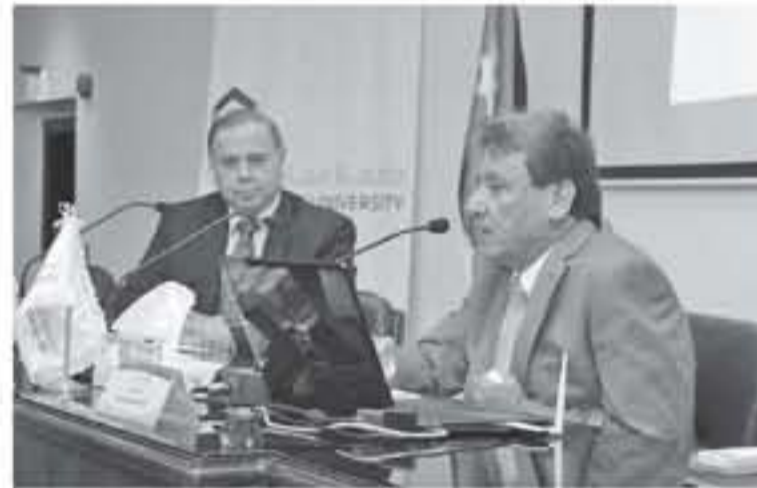
محترفين للحفاظ على حقوق اللاجئين ومواجهة أي محاولة لتصفية القضية الفلسطينية.

وأوضح المعين عزازية في الحاضرة التي حضرها رئيس الجامعة الدكتور ماهر سليم وعمداء الكليات وأعضاء هيئة التدريس والإداريين وطلبة الجامعة، الموقف الأردني من حق العودة وعمل الأونسرو التي لا يزيد حجم خدماتها عن ٢٠ باقلاً، موجهها لللاجئين والباقي يتولى الأردن، إن الأرض ولاية وكافة الحوت الدولية وفق قرار إنشائها، وتقديم الدعم في الحفاظ الدولية لاستمرار عملها. من جهته، قال الدكتور ماهر سليم خلال الحاضرة إن قضية اللاجئين وحق العودة من القضايا الشائكة، مؤكداً أنه لا يضع حق كحل العودة مطلقاً أن الفلسطينيين متمسكون به ولا يتنازلون عنه، وتحلل الحاضرة لغاش لتناول أشكال التحديات التي تواجه القضية الفلسطينية والخيارات لمواجهة الأزمات.