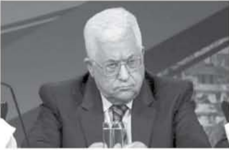
تحفيظ رواتب موظفي السلطة بتسوية 25% وإحالة أكثر من 30 ألف موظف والأدوية وتمويل الكهرباء.

حركة حماس في قطاع غزة، والاحتلال الإسرائيلي، والسلطات المتحددة الأمريكية، وأن الأوان لتتقيد بها.. وقال عباس بافتتاح الجلسة المسائية للمجلس المركزي المتعدد رام الله مؤخرًا، وسط مقاطعة شالية الضال والرفض شعبي واسع إنه "سبق واتخذنا القرارات في مجالنا السابقة فيما يتعلق بأميركا والاحتلال وحركة حماس وأن الأوان لتتقيد بها، لأنه لم يتركوا للصح مطرًا.. ويخرض عباس للعالم الثاني على التوالي عقوبات بحق قطاع غزة أبرزها