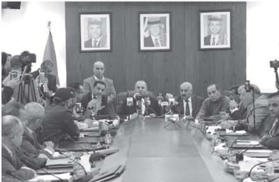
الأبناط - عمان

أقرت لجنة الاقتصاد والاستثمار النيابية امس اقرار الافراد بـ ١٠ آلاف دينار سنويا في العام المقبل، لتصبح ٩ آلاف دينار اعتبارا من عام ٢٠٢٠، فيما يعفى ٢٠ ألف دينار من الدخل السنوي للأسرة للعام المقبل ٢٠١٩، ويصبح المبلغ ١٨ ألف دينار اعتبارا من العام ٢٠٢٠.