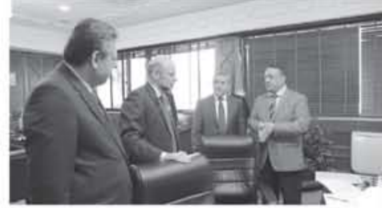
عدد المخالفات التي تم التعامل معها، وأثنية العمل التابعة لتوصيتها، مؤكداً أن كل مخالفة يتم دراستها على حدة، والحالا التوصية المناسبة بشأنها، بعد اطلاع رئيس

الأنباط - عمان أطلع رئيس الوزراء الدكتور عمر الرزاز أمس، على آخر مستجدات عمل الفريق المتكف بمراجعة المخالفات الواردة لتقرير ديوان المحاسبة. ووافق رئيس الوزراء على توصيات جديدة للفريق، لتضمن إحالة 30 مخالفة جديدة مرتبطة بعدد من بلديات المملكة إلى هيئة النزاهة ومكافحة الفساد، بناء على توصية الفريق. كما أوعز رئيس الوزراء على الفور، باسترداد مبالغ مائتة جديدة تم إنفاقها دون وجه حق في عدد من البلديات. وقدم أمين عام رئاسة الوزراء سامي الداود إيجازاً لرئيس الوزراء حول