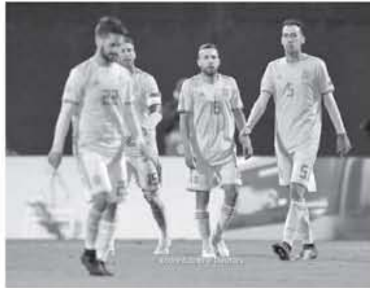
غزيريد - وكالات

سقطت الصحف الإسبانية، الصادرة يوم أمس الطوه على خسارة ألتانادور أمام كرواتيا، أمس الاول، بنتيجة ٢-٠، في إطار دوري الأمم الأوروبية، وخرجت صعبسيفة مباركاً ببعضشوان السقوط، وأضافت "ليس بوسعنا سوى الدعاء قبل مباراة الأحد المقبل بين كرواتيا وإنجلترا.. وتابعت "أحلام إسبانيا تبعدت بعد الكوارث الدفاعية وأخطأه ديغيد دي خيا، وراموس يُعاني الفريق مُصاباً، وسلطت الصحيفة، الضوء على تصريح لويس إنريكي مدرب إسبانيا، حيث قال "نحن في مرحلة الشمو، من أجل الدفع بلاعبين جدد، وخرجت صحيفة موندو ديورتيو بعنوان "قدم واحدة خارج نصف نهائي دوري الأمم، وأضافت "المنتخب يتلقى