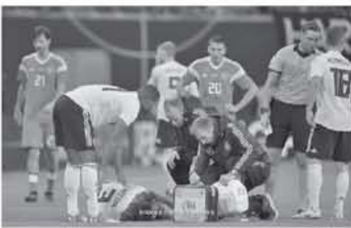
ميونخ - وكالات

ذلك، شهدت المباراة خروج جوناس هيكتور، مدافع المانشافت، متأثراً بإصابة في المرفق، وأكد الحساب الرسمي لمنتخب ألمانيا عبر موقع التواصل الاجتماعي تويتر، أن الإصابة ليست خطيرة، مون السكتسيف سن طبيعتها، ويشارك مدافع كولن، الذي يشهد في دوري الدرجة الثانية، في التشكيلة الأساسية لألمانيا، ليشترك في خروج ألمانيا من المباراة بتهلكة نظيفة.