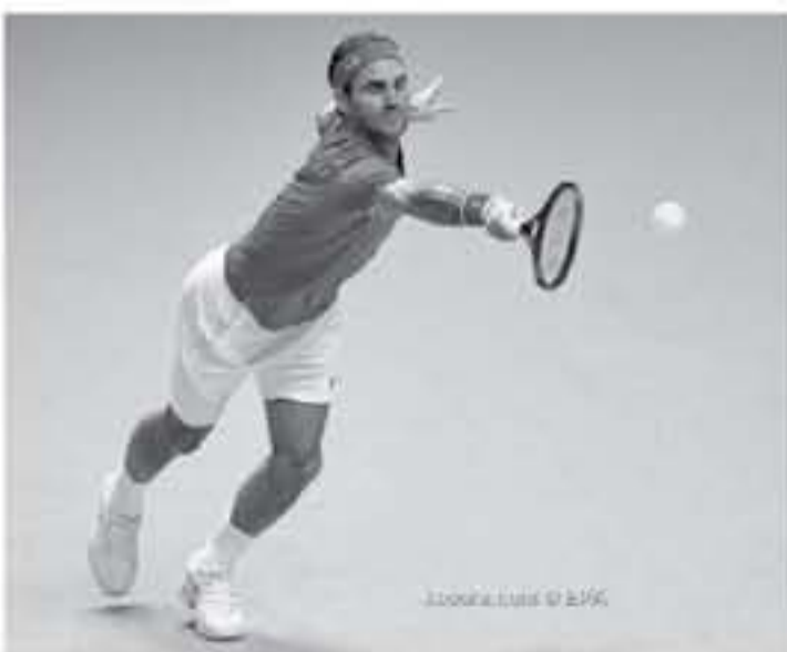
لندن - وكالات

أن يمثل له حافزاً كبيراً، وأضاف، "أنا سعيد بمنح نفسي الفرصة للمنافسة على اللقب، وسعيد أيضاً برفع المستوى الخاص بي وأمل أن أوصل على نفس النهج بكل تأكيد أنا سعيد للغاية بالوضع الذي أتواجد عليه حالياً، ومنذ ٤ أيام تقريباً، خسرت فيدرر في البطولة الختامية بمجموعتين دون رد للمرة الأولى في مسيرته الاحترافية، وبالتالي كان لزاماً عليه تقديم مستوى استثنائي لتتأهل إلى نصف النهائي، وتابع فيدرر، "أعتقد أنه بعيداً عن لغة الأرقام، هذه بطولة كبيرة للغاية لكل اللاعبين، بالطبع يمكن أن تحدث عن نفسي فقط، وأنا أحب كثيراً أن أكون جزءاً من البطولة الختامية، وأنا ما أذكر جزءاً من طفاقي على مدار الموسم لتألق في تلك البطولة.."