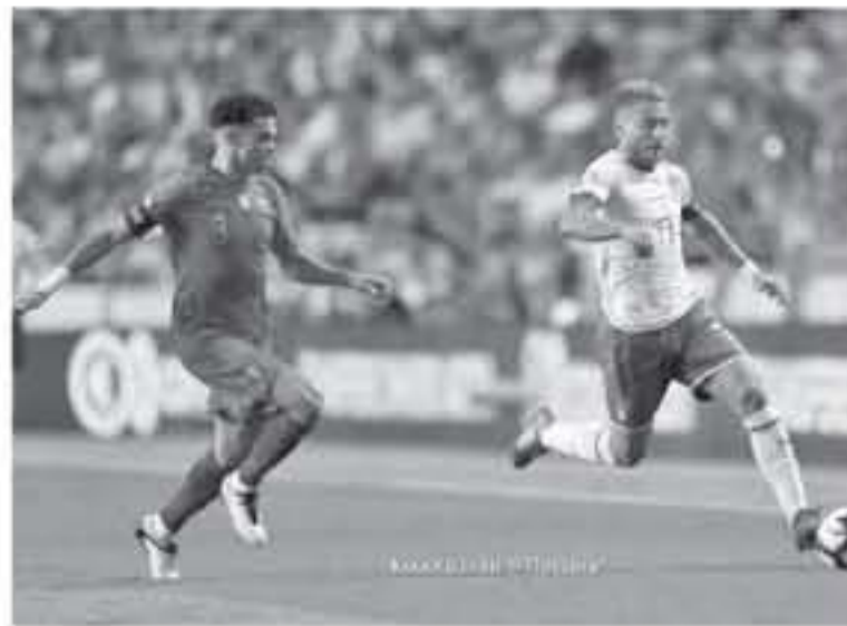
روما - وكالات

ليس لدى المنتخب الإيطالي الأول لكرة القدم ما يحسره وهو الأمر الذي يمكن أن يصبح نقطة قوة له عندما يستضيف المنتخب البرتغالي، مساء اليوم في ميلانو، حيث يبحث عن صدارة مؤقتة على الأقل للمجموعة الثالثة بالمستوى الأول لبطولة دوري أمم أوروبا، ويرجح ألا يتمكن المنتخب الإيطالي من الحلول في صدارة المجموعة، وبالتالي لن يتمكن من الصعود للدور قبل النهائي الذي يقام في جزيرتي القليل، لا سيما وأنه يحتل المركز الثاني بفارق نقطتين خلف المنتخب البرتغالي، يمثل أوروبا، الذي يتصدر المجموعة حالياً برصيد ٦ نقاط ولديه مباراة إضافية سيلعبها على أرضه أمام منتخب بولندا، ومع ذلك يبدو المنتخب الإيطالي الفائز بكأس العالم ٤ مرات، متأكدًا من البقاء في المستوى الأول بعد التقلب على المنتخب البولندي بنتيجة ١-٠، الشهر الماضي، ويتوقع روساريو مانشيني مدرب المنتخب الإيطالي أن يحتفظ معلم سان سيرو، الذي يتسع إلى ٨٠ ألف مقعد، بالمجموع في هذه المباراة، ويضيف مانشيني، "لريد أن نستمر في نفس الطريق الذي بدأناه أمام أوكرانيا وبولندا، نحاول