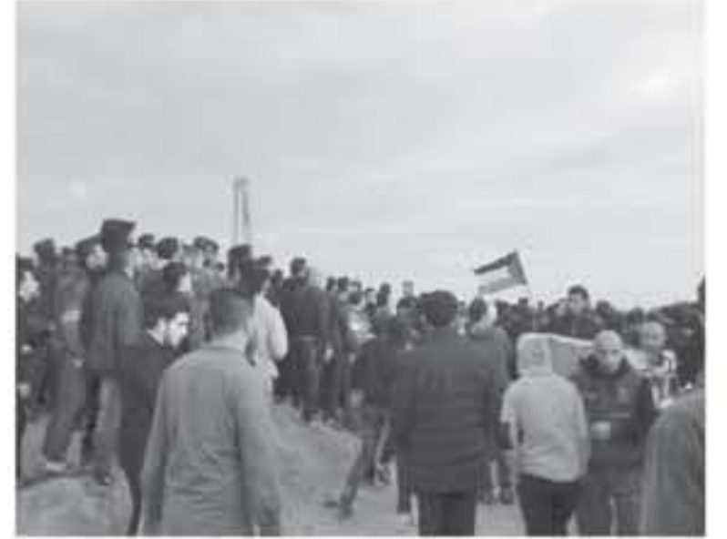
غزة - وكالات

وأhead مراسلتنا في مخيم العودة شرق مدينة غزة بأن جنود الاحتلال المتمركزين قرب السياح الأمني أطلقوا الرصاص الحي وقنابل الغاز المسيل للدموع صوب جموع المتظاهرين السلميين، ما أدى لإصابة 40 شخصاً بالرصاص الحي وإصابة آخرين بالإغماء والاختناق جراء استنشاقهم الغاز. وعند الساعة الثانية ظهرًا بدأت مئات المتظاهرين السلميين يتوافدون إلى