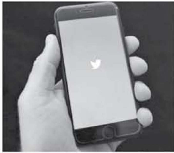
التركيز على عدد أرقام المتابعين، إنما المحتوى والحدائق ذات الغزى التي يديرها

قال جاك دورسي، مبتكر موقع تويتتر والتدبير التنفيذي للتعليق، إن وجود الكثير من المتابعين ليس الهدف الأساسي للشركة من خدمة تويتتر ولم يكن أمرًا ذا بال في الماضي أو اليوم. وتحدث الملياردير المولود عام 1976 في مؤتمر بنيندو، إن قياس الأمور بعدد المتابعين للحساب ليس بالأمر السليم أو الفكرة السليمة. وأشار إلى أنه مع بدايات إنشاء تويتتر في عام 2006، لم يكن التفكير منصبًا على آثار ذلك الشيء في المستقبل. وقال إنه "في البداية عند تأسيس الموقع وضعت عدد المتابعين بخط واضح في مدخل الصفحة، وبالتالي فإن التعيين تقع على الرقم، ويفكر أغلب الناس بضاعته باعتباره أهم شيء". وأضاف موضوعًا: "ربما كان ذلك التقدير صعبًا قبل 12 عامًا لكن الأمر ليس كذلك اليوم". وقال دورسي: "أعتقد أنه يجب عدم