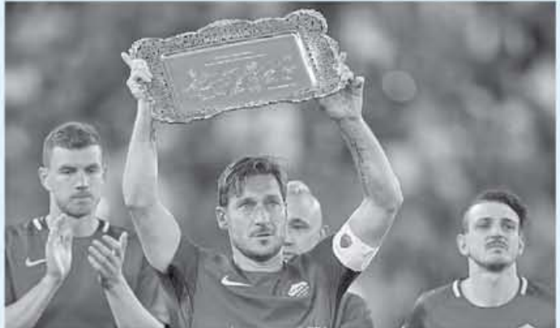
روما - وكالات

أعلن نادي روما الإيطالي، أنه سيقيم بتكريم أسطورة الفريق، فرانكيسكو توتي، في المباراة المقبلة لثلاثاء أمام ريال مدريد الإسباني، ويستضيف روما، نظيره ريال مدريد، ٢٧ تشرين ثان الجاري، على ملعب الأوليبيكو، في إطار الجولة الخامسة من دور المجموعات بدوري أبطال أوروبا.. وقال نادي روما، عبر موقعه الرسمي على الإنترنت إنه سيقيم بتكريم توتي، قبل انطلاق مباراة الفريق أمام ريال مدريد، وأكد النادي، أن حفل سيقد على أرضية ملعب الأوليبيكو، قبل ساعة من انطلاق مواجهة ريال مدريد، علماً بأن توتي سيحصل على قميص خاص مصمم لهذه المناسبة، ويحتل نادي روما، المركز الثاني في مجموعته بالثلاثاء بواقع برصيد ٩ نقاط، بفارق الأهداف عن المتصدر ريال مدريد.