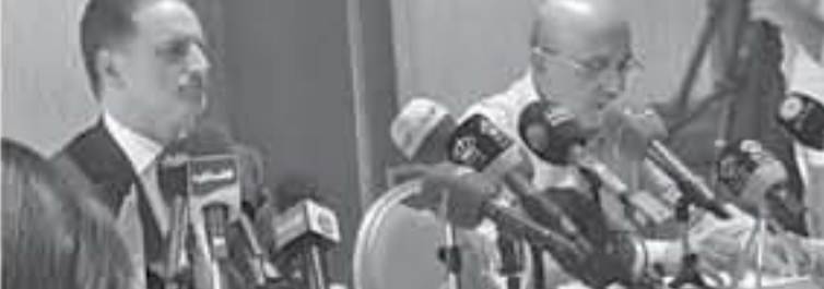
الأنباط - عمان - علاه علان