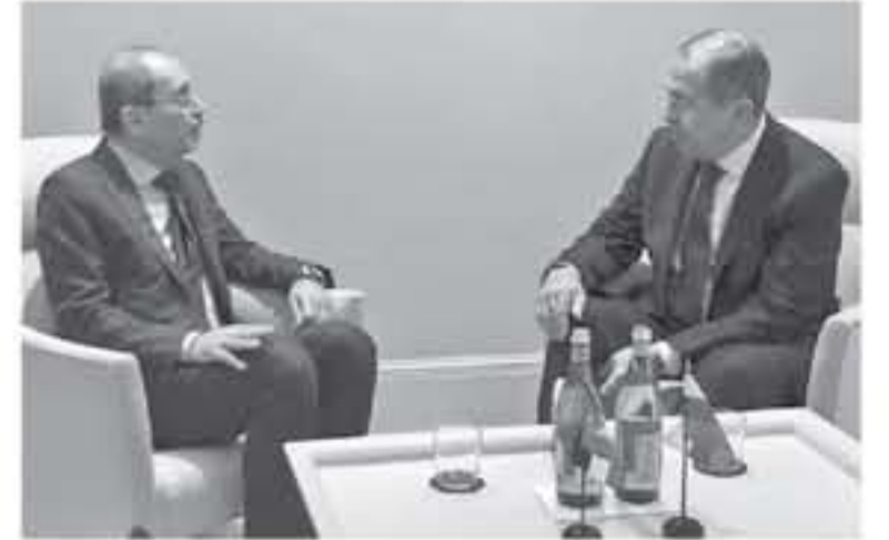
روما - بترأ

الركبان للتناحين السوريين حيث أكد الصفدي ضرورة تأمين عودة قاطني الخيم الطوعية إلى الأماكن التي لجأوا منها بعد أن تحررت من سيطرة العصابات الداعشية. ويذكر أن الأردن وروسيا والولايات المتحدة متخرون في محادثات ثلاثية تستهدف حل أزمة الركبان وأن الأردن أكد دوماً أن الركبان هو تجمع مواطنين سوريين على أرض سورية وبالتالي يجب التعامل مع أزمتهم في سياق سوري أصمى وأن الحل الوحيد الناجع للقضية هو عودة قاطنيها إلى بلدانهم. وكانت الملكة صحت بدخول المساعدات من أرضها إلى التجمع حين كان إيصال المساعدات من الداخل السوري غير متاح لأسباب أمنية ويصير الأردن على اإخال المساعدات من الداخل السوري في ضوء توفر إمكانية ذلك الآن ويستمر الأردن بتوفير العلاج لمن تثبت حاجته له من قاطني الخيم على أرضيه. وكان الصفدي أكد في جلسة في منتدى