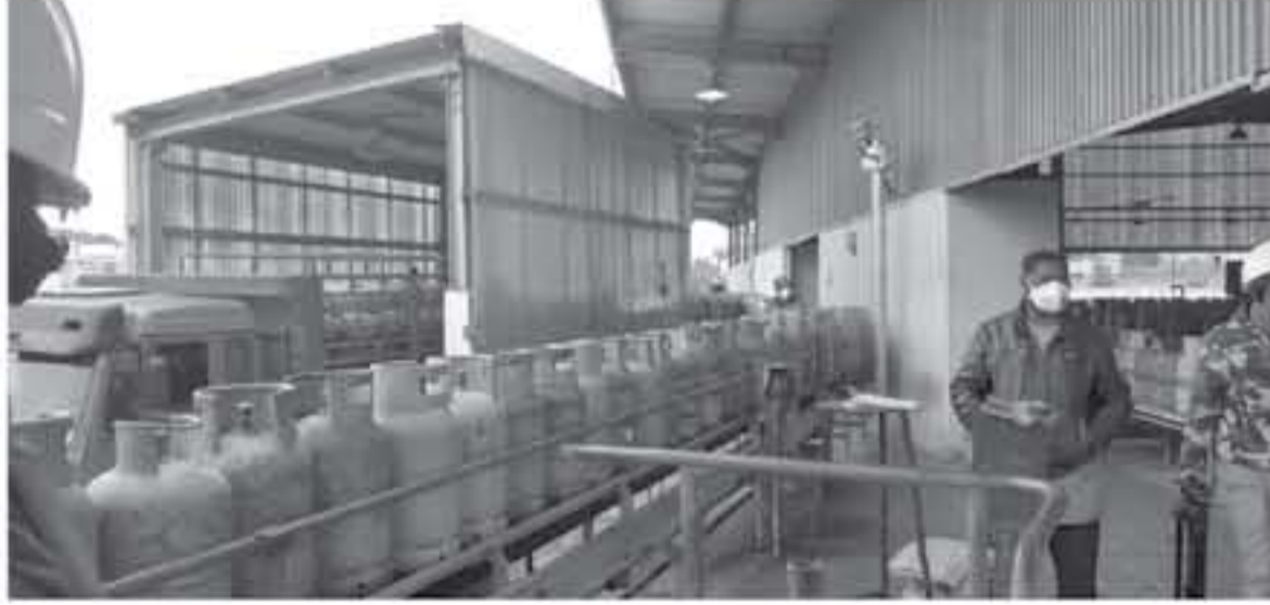
الأنباط - الزرقاء - علاء علان

الشركة قادرة على توريد نحو ٢٠٠ الف أسطوانة يوميا