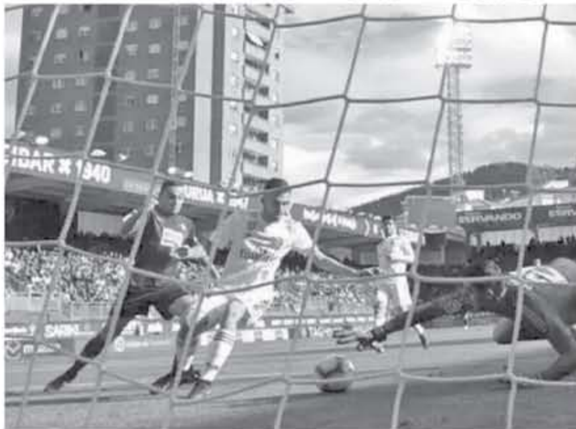
مدريد - وكالات

حقق إيبار فوزا كبيرا على ضيفه ريال مدريد بنتيجة (3-0) في المباراة التي أقيمت على ملعب إيبورا، ضمن منافسات الجولة 13 من الليجا. تقدم جونزالو إسكالانتس بالهدف الأول لإيبار في الدقيقة 16، ثم أضاف سيرجس إيريتشس الهدف الثاني بالدقيقة 52، ثم أختتم كيكس جارسيا أهداف المباراة بالدقيقة 54. وتلقت النتيجة بارتعاض كبير من الفريق الإسباني إلى النقطة 18 في المركز السابع، بينما يتجمد رصيد ريال مدريد عند النقطة 20 في المركز السادس. أتت انطلاقه المباراة على نحو سريع من الجانبين، فمع الدقيقة الثالثة أضع كيكس جارسيا فرصة للفئاتي وصلت لكورتوا بسهولة، ليرد عليها جاريت بيل بتسديدة أكثر من رائعة في الدقيقة 5 سكنت شبكات أصحاب الأرض ولكن أعلن الحكم عن وقوعه في حسيده التسلل.