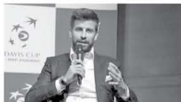
الصلة السابق مايلك جوردان، وأوضح ما قلته هو أن عمره الآن يجعله

لدى مدافع برشلونة جيرارد بيكيه، أن يكون قد عقب على العمر المتقدم للاعب التنس السويسري روجر فيدرر (37 عاما)، مشيرا إلى أن الأمر يتعلق ب"سوء تفاهيم، وبج مقابلة ستصدرها المجلة الأسبوعية التي تصدرها صحيفة (كيبك) الفرنسية، قال بيكيه "هناك سوء تفاهيم، ويمكن التحقق من حسابي على تويتر، فيدرر بالنسبة لي واحد من الثلاثي الذين أعظمهم مثلا أعلى لي، إلى جانب الأريستيني كيونيل ميسي ولاعب كرة