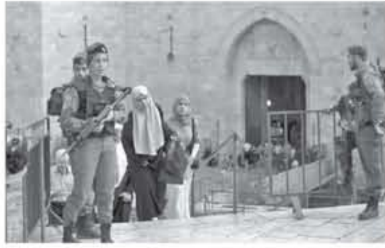
وان كانت هائلة وتصرف المستوطنين، وحسب القرب الوطني، فإن هذا القرار يأتي لتهيئة لبناء حي استيطاني مكون من 8 مبان، في كل منها 12 طابقاً في أكبر عملية اقتلاع وتهجير تشهدها المدينة المقدسة منذ النكبة.

وكانت المحكمة العليا قد رفضت الالتماس المقدم من أهالي حي عجن الهوي في بلدة سلوان وسحمت لجمعية "عظيرت كونهيم" الاستيطانية ومنحتها العقضاء القانوني اللازم، بالاستمرار في طرد 700 فلسطيني، بزعم أن منازلهم بنيت على أرض امتلكها يهود قبل نكبة الشعب الفلسطيني.