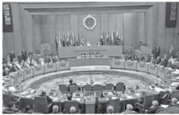
التي هي عاصمة دولة فلسطين، وهي رمز وجود وبقاء الشعب الفلسطيني. وشدد على أن الحل الوحيد أمام المجتمع الدولي المعاصر والتقدم هو التفعيل والتطبيق

أدانت جامعة الدول العربية، بشدة قرار سلطات الاحتلال الإسرائيلي بحق عضو اللجنة التنفيذية لمنظمة التحرير، وزير شؤون القدس عثمان الحسيني، ومحافظ القدس عدنان عبيد، بمنع حركتهما، وحرمانهما من الحق في السفر، وحق التواصل مع عدد من الشخصيات الفلسطينية.