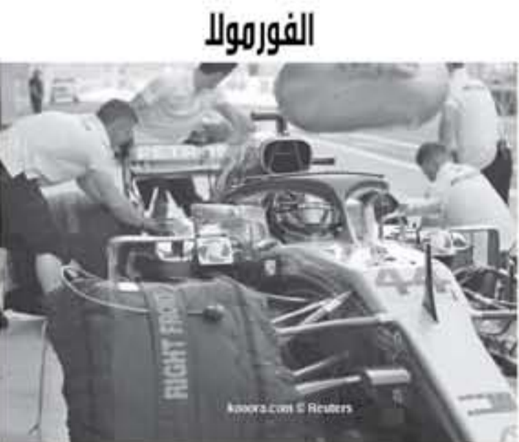
أبو ظبي - وكالات

ثانية، متفوقا على كيمي رايبوتون، وسيستيان فيتيل، سائق فيراري. كان هاميلتون، حسم لقب بطولة العام عبر سباق المكسيك، لكنه قد يحقق رقما قياسيا شخصيا في حالة الفوز بسباق أيبوتنسي، حيث سيكون الفوز السابع له خلال موسم واحد، ويتطلع رايبوتون إلى إنهاء الموسم في المركز الثالث بالتتابع العام لفئة السائقين، خلف هاميلتون وفيتيل، لكنه يواجه ضغوطا من جانب فالتيري بوتاس سائق مرسيدس وماكس فيرستابن سائق ريد بول.