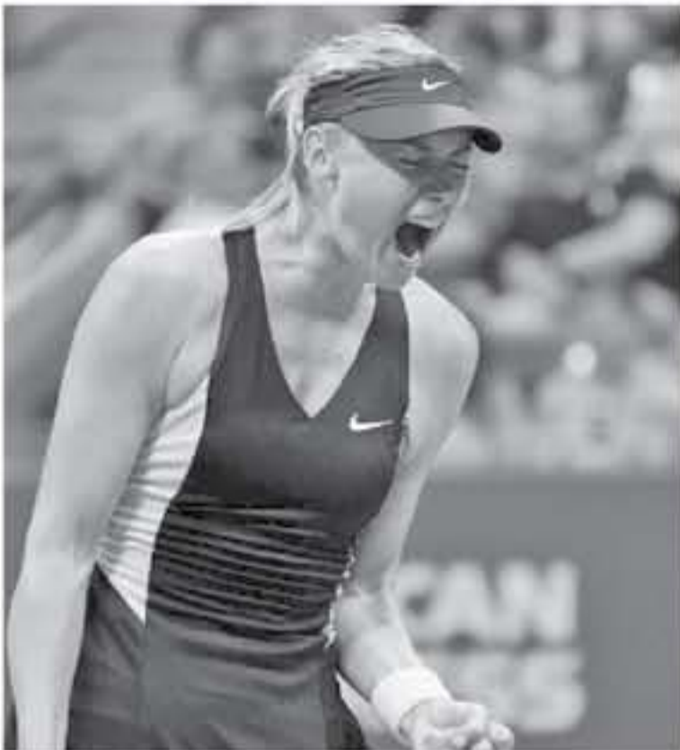
روسيا - وكالات

التعاضد من بعض المشاكل البدنية. وتعد هذه هي المرة الثانية على التوالي التي تشارك فيها شارابوفا ببطولة شينجن، حيث خسرت هذا العام نصف النهائي أمام التشيكية كاتيرينا سنيياكوفا بطلقة عام 2017. ولم تشارك هاليبي، حاملة اللقب، وبطلقة المباراة أيضا في عام 2018. في النسخة المقبلة سبب مواصلة تعافيا من الإصابة في الظهر ويتواجد إلى جانب شارابوفا، في البطولة العام المقبل، اللاتفية إيلينا أوستابينكو، إلى جانب كل من أرينا سابليكا، وكارولين جارسيا.