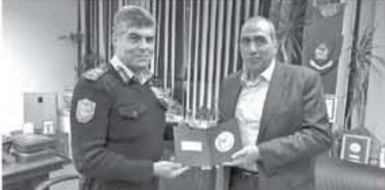
الأنباط - رام الله

بتقديم الدعم وكل ما يحتاجه الأخوة في مديرية الأمن العام الفلسطينية من خدمات في مختلف المجالات الشرطية خاصة في تأهيل وتدريب كوادرهم على أحدث العلوم الشرطية. من جهته أكد اللواء حازم عطا الله ان زيارته وفد من مديرية الأمن العام بالمملكة الأردنية الهاشمية برئاسة اللواء الحمود وعدد من كبار الضباط، يرمز القواسم المشتركة في العمل الشرطي وتبادل الخبرات الشرطية، بين الجانبين. مشيداً بما قدمه الأمن العام الأردني في وفد الأمن العام الفلسطيني بالتدريب المتخصص على مدار سنوات.