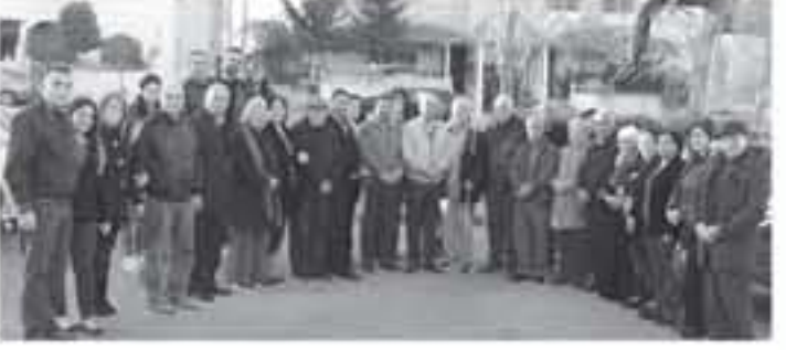
الانباظ - عمان