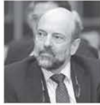
الانباظ - عمان - عمر كلاب