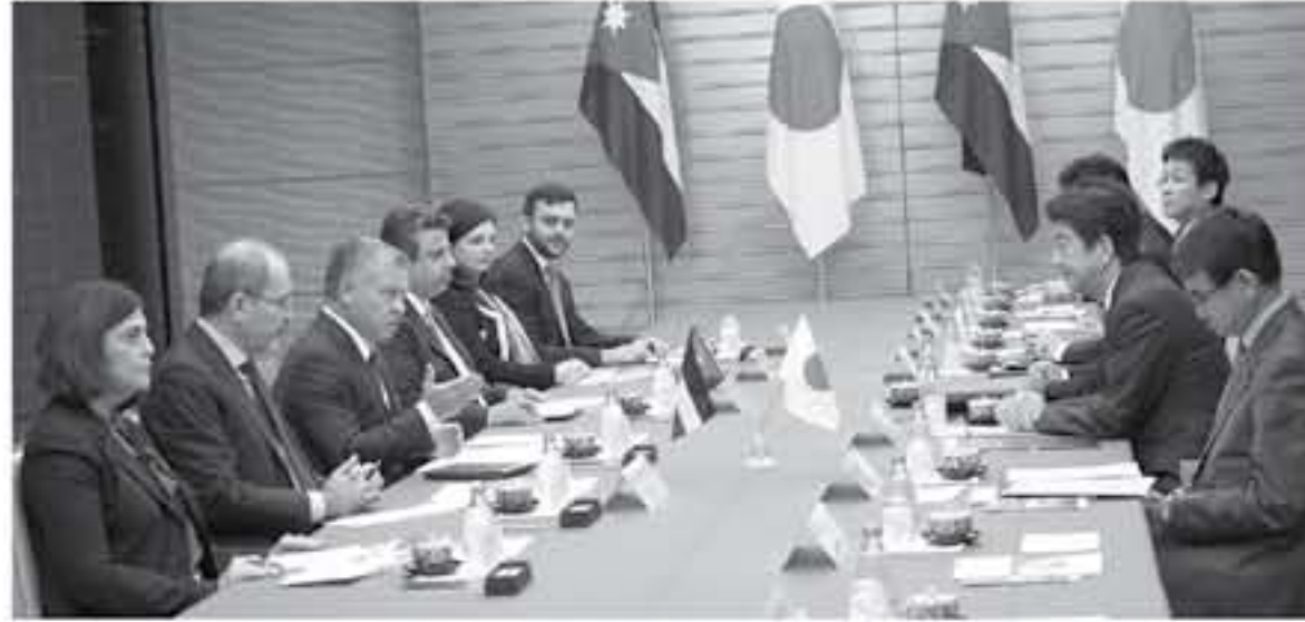
طوكيو - بتر

شينزو آبي: الأردن شريك استراتيجي مهم لا غنى عنه