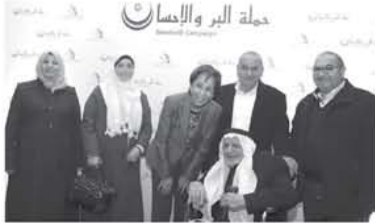
معلميا يشكل ١٨٩٦ شخص في جميع أنحاء المملكة، وكلفة قدرت بنحو مليون و ٥٠٠ ألف دينار.