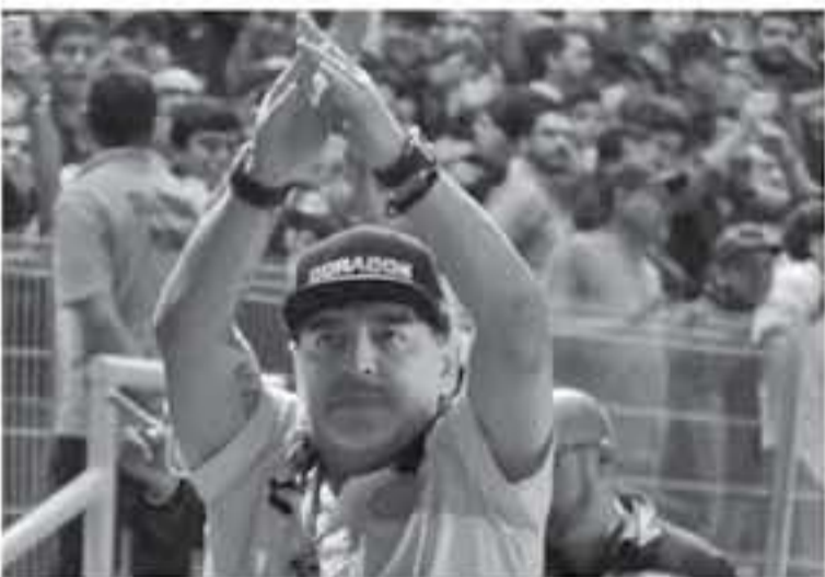
المكسيك - وكالات

وكان مارادونا، الذي اضطر متابعة المباراة من المقصورة نتيجة لعقوبة فرضت عليه، قد تصرف بصورة غاضبة مع جماهير أصحاب الأرض، ويظهر مقطع فيديو الأسطورة الأرجنتيني بينما يوجه ضربات نحو مجموعة من المشجعين، الذين مسخروا منه عقب خسارة النهائي. يذكر أن مارادونا طرد يوم الخميس، في مباراة الذهاب بعدما سب حكم المباراة ومدرب سان لويس، ألفونسو سوسا. يشار إلى أن مارادونا خضع لتدريب منذ ٣ أسابيع من قبل لجنة الحكام.