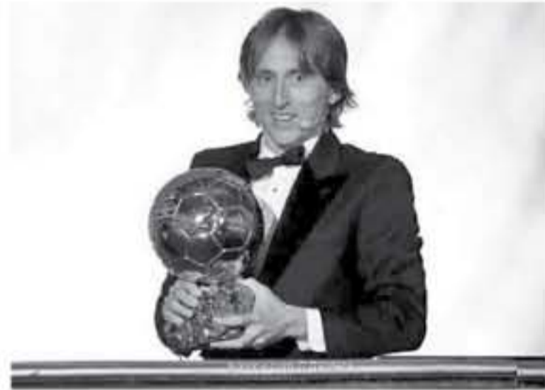
رمان، وكان لديهما موسم كبير وقازا بكأس العالم، وأنا متأكد أنهما سيظهران بشكل أفضل في المستقبل، خاصة كيان مبابي الذي يمتلك موهبة كبيرة، وينتظره مستقبل عظيم. وواصل، "التتويج بالكرة الذهبية

اجرت، فرنسا فوتبول، الفرنسية منافسة خاصة مع الكرواتي لوكا مودريتش، التوج بجائزة الكرة الذهبية التي منحها المجلة، مساء أمس الأول في حفل أقيم بالعاصمة الفرنسية باريس. وكان السؤال الأول الموجه لودريتش، عن مكان وضع الكرة الذهبية، حيث أجاب، "في الثباتي الأولى من المحتمل أن تبقى بجانب سريري، بعد ذلك سوف أهد لها مكاناً جميلاً.. وأضاف، "لو خيرت بين الكرة الذهبية وكأس العالم سأختار كأس العالم بالتأكيد، الجوائز الجماعية هي الأكثر أهمية وأنا سوف أفضله، لكن لسوء الحظ لا أستطيع أن أعود للتحقق والتتويج بالونديال، الكرة الذهبية كأس كبيرة بالنسبة لي، لكنني سأختار الفوز بلبق البطولة.. وتابع، "جريزمان ومبابي لاعبان