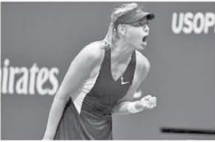
روسيا - وكالات

كس تكسب الشقة من جديد.. وأوضح المدرب الروسي، في تصريحات نقلها موقع Tennis360، شارابوفا فقدت الثقة منذ عودتها من الإيقاف، إذ انسحبت من العديد من البطولات لكنها تملك الهوية وبالتالي يمكنها اللعب في أعلى المستويات والتغلب على أي لاعبة، يذكر أن شارابوفا أنهت موسمها هذا العام مبكراً بعد توديعها اليكز لبطولة أمريكا المفتوحة.