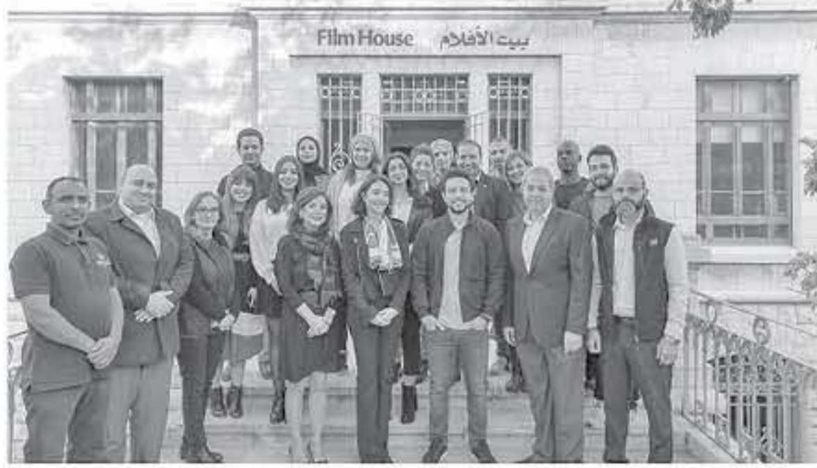
الأبطال - عمان

اطلع نائب الملك، سمو الأمير الحسين بن عبدالله الثاني، ولي العهد، خلال زيارته أمس إلى الهيئة الملكية الأردنية للأفلام، على أبرز النشاطات والخدمات التي تقدمها الهيئة في الفنون السينمائية والتلفزيونية.