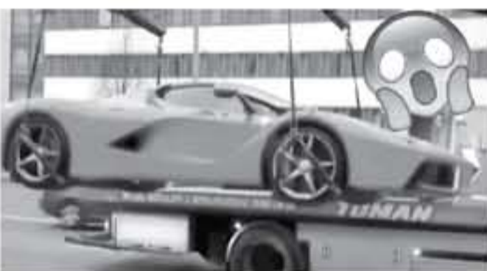
فيينا - وكالات

السيارة الخارقة تمتلك هيكلاً خارجياً مصنوعاً من الكربون فايبر وهي حساسة جداً بالنسبة لهده العاملة القاسية. برجع فريقنا أن هذه السيارة الأسطورية كانت مركونة بشكل غير قانوني على الطرق العامة في فيينا 111 ولكن لا يوجد شيء مؤكد، وكما تعلمون أعزائنا المتابعين يوجد في العالم فقط 500 نسخة كوبيه من سيارات فيراري لا فيراري، وهي تعتبر طراز بديلة عن السيارة الأسطورية فيراري اشزو، كما أنها أول سيارة فيراري هايبر في العالم، وتنافس لا فيراري كلاً من ماكلارين P1، و بورش 918 سبايدر.