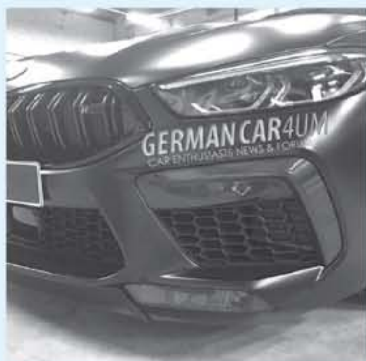
ميونخ - وكالات

حصلنا قبل أيام على صور مسربة لـ سيارة بي ام دبليو ام 8 كومبيتشن - Competition BMW M8 2020 القادمة، تظهر ملامح هذه النسخة عالية الأداء من طراز بي ام دبليو الفئة الثامنة بدون أي تمويهات.