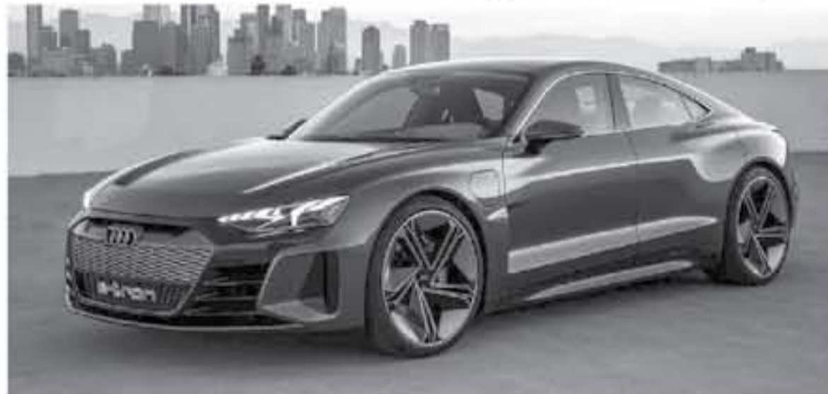
نيويورك - وكالات

عاشق أفلام الأبطال الخارقين يعلمون أنه سيتم عرض فيلم Avengers 4 في 3 مايو من عام 2019 القادم إن شاء الله، وبما أننا موقع متخصص في عالم السيارات سنلهمكم أن أحدث سيارات اودي ستشارك في بطولة فيلم Avengers 4.