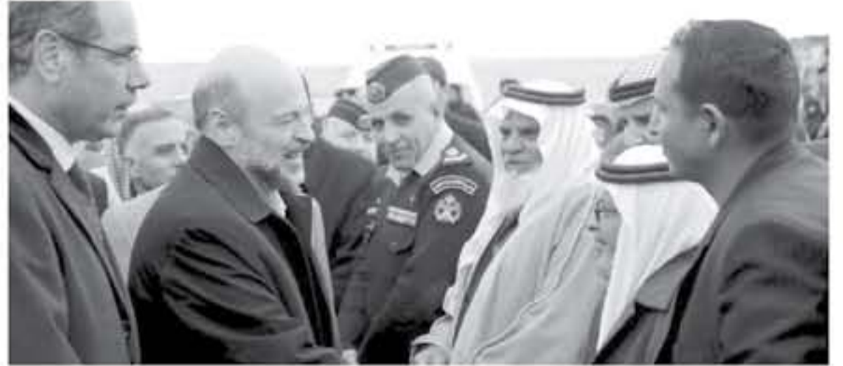
الأنباط - الطفيلة

التي تسهم في تحقيق التنمية وتوفير فرص العمل لشباب وفتيات المحافظة. ولفت إلى أن الحكومة وعقب استماعها لآراء مطالب واحتياجات المحافظة التي عرضها محافظ الطفيلة ورئيس مجلس المحافظة أمام مجلس الوزراء. اتخذت قرارات فورية لحل المعوقات والتحديات التي تواجه المحافظة.