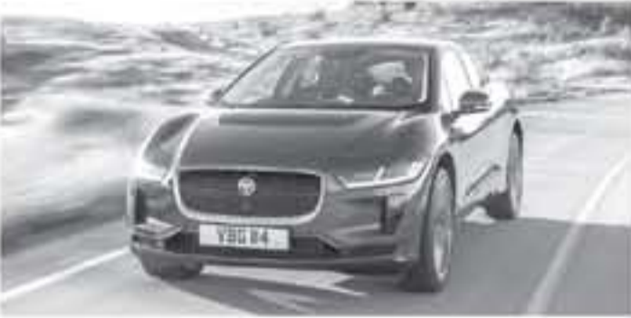
الأنباط - دبي

أي استخدام، ولطالما أولت "جاكوار" جُل اهتمامها لتأمين السلامة في سياراتها، وقد تكلل ذلك اليوم بمنح سيارتها الكهربائية الأولى متعددة الاستخدامات تصنيف الخمس نجوم.