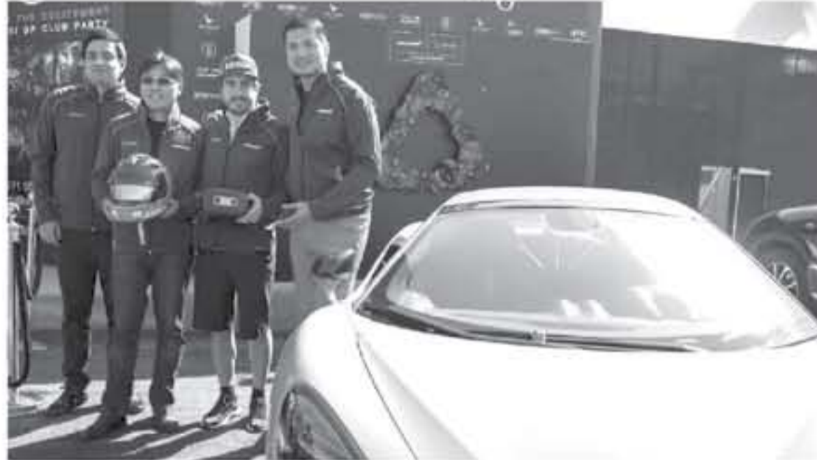
برلين - وكالات

أعلنت HTC VIVE و ماكلارين رسمياً اليوم عن إطلاق إصدار خاص من خوذة HTC VIVE تحمل علامة ماكلارين - McLaren بتلك أول منتج مشترك يطلعه الطرفان منذ الشراكة التي أعلنتها عنها في شهر مايو من العام الجاري، ويقدم لشاق سباقات السيارات تجربة لا تضاهي في عالم الواقع الافتراضي. وتجمع الخوذة الجديدة بين الدقة الفائقة التي تتمتع بها Vive Pro، ونظام الصوتيات عالي النقاء، وكفاءة العمل لتوفر بذلك تجربة استثنائية للواقع الافتراضي لجمهورها في شتى أرجاء العالم.