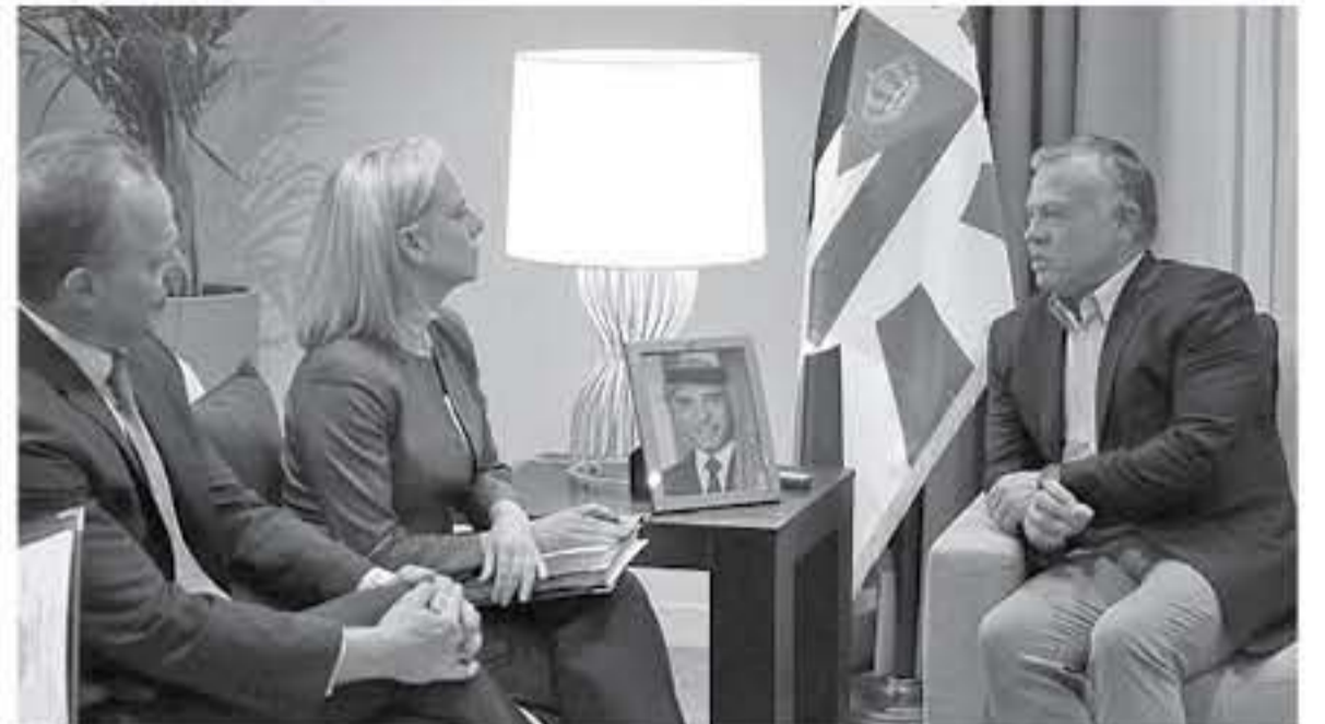
الأتباط - العقبة