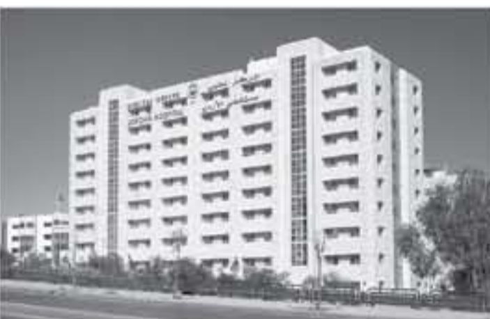
الأخبار - عمان

في إعاقه وصول سيارات الاسعاف التي تظف المرضى لقسم الاسعاف والطوارئ، مؤكدة أن بعض الحالات الطارئة والحرجة تم تشمكين من الوصول إلى قسم الطوارئ في المستشفى مساء أمس الجمعة بسبب إغلاق الشارع من قبل المعتصمين. وأكد البيان احترام وتشدير إدارة مستشفى الاردن لحق التعبير لكل مواطن، وبما يصون حوقه وكرامته، غير أنها ناشدت المعتصمين مراعاة خصوصية هذا المكان الحيوي وكف الأذى عنه.