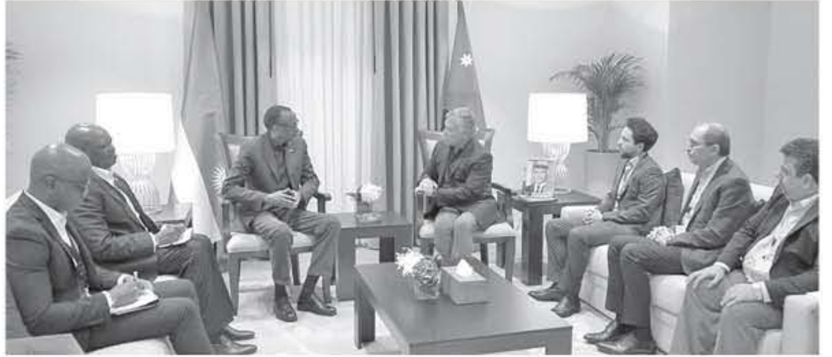
الأنباط - العقبة

التقى الملك عبدالله الثاني، بحضور سمو الأمير الحسين بن عبدالله الثاني، ولي العهد، على هامش اجتماعات العقبة أمس، مع رئيس رواتنا بول كاغامي، الذي يزور الأردن لأول مرة، وجرى خلال اللقاء بحث آفاق التعاون