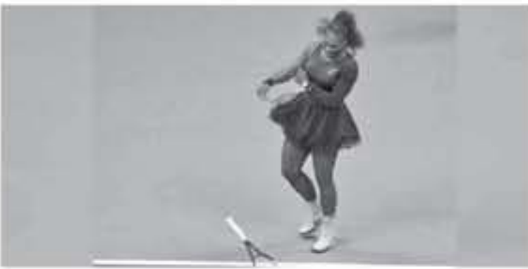
أمريكا - وكالات

وأضافت النجمة الأمريكية، هناك الكثير من اللاعبين الذين يعانون من الضغط الكبير، ومن الصعب أن أذهب إليهم وأقول لهم لا تحطموا المضارب، خاصة أنني فلت ذلك كثيرا، ولكن كسي يكون أمينة، هذه ليست الطريقة الأفضل لإخراج فضيحة، وتابعت سيرينا، «أعتقد أنه كلما تقدمت في العمر، كلما تعلمت طرق أخرى للتعبير عن غضبك بدلا من تحطيم المضرب، حيث نلعت على حوض المباريات الصعبة ولكن خبرات من الهزائم التي تعرض لها.