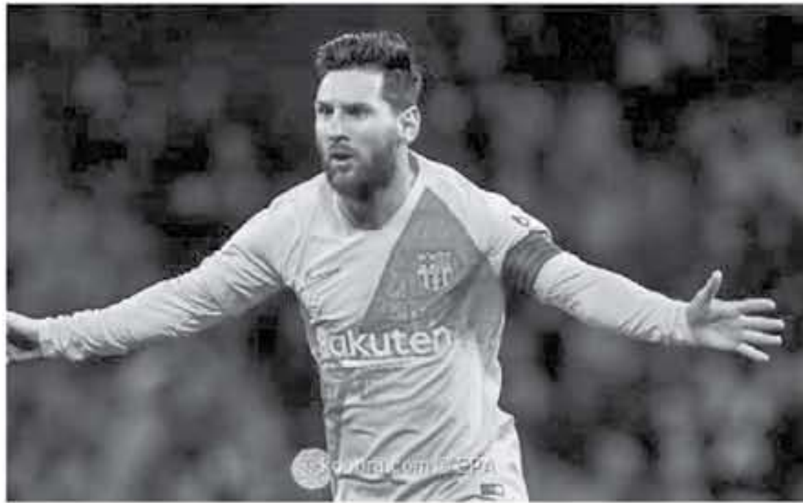
برشلونة - وكالات

قال ليونيل ميسي، نجم برشلونة، إنه كان محظوظا بتصحيحه لهدفين من كرتين شائتين، في شبك إسبانيول، خلال الانتصار (٤-٠)، أمس الاول لحساب الجولة العاشرة من الليجا، وحول المباراة، قال ميسي، في تصريحات نقلتها صحيفة «موندو ديبورتيفو»، الكتالونية، «حاولنا السيطرة على اللقاء منذ البداية، أمام فريق قوي، يشهد أداءه دائما مع مدرب متميز، وأضاف، «كان لدينا الكثير من الجدارة في تحجيم المنافس، لقد سجلنا هدفا مبكرا أبق بهم الضيق، وتم تسمح لهم باللعب بأريحية، وأزهد، «أحاول مواصلة التطور، اليوم كنت محظوظا بتصحيح هدفين، من خلال الكرات الشائشة، وعما إذا كان قد فكر في إمكانية تسجيل هاتريك، غير الكرات الثابتة، قال النجم الأرجنتيني، «لم أفكر في ذلك، هدفنا هو استمرار حصد النقاط، والابتعاد بالصدارة عن إشبيلية وأتلتيكو مدريد، وشأن زميلنا عثمان ديمبلي، أجاب ميسي، «لقد قدم مباراة كبيرة، وسجل هدفا، نحن سعداء بذلك، الفريق بحاجة له وللجميع، في هذا الموسم الطويل». وأكد ميسي أن احتلاله المركز الخامس في ترتيب الكرة الذهبية لم يشكك حافزا بالنسبة له من أجل التطور بأداء رائع خلال فوز البيلجورانا على غريمه إسبانيول في دوري كتالونيا ولعب ميسي الفائز بالكرة الذهبية كأفضل لاعب في العالم خمس مرات عن منصة التتويج