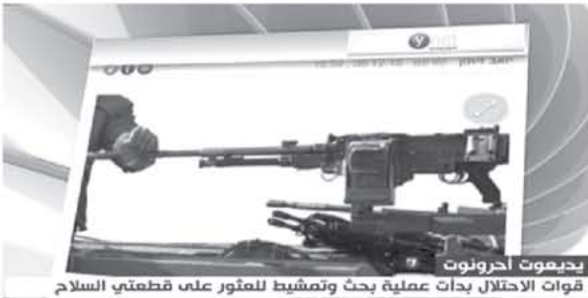
يديموت أحرنونوت قوات الاحتلال بدأت عملية بحث وتمشيط للمثور على قطعتي السلاح

بالدخول إلى فلسطين المحتلة وأخذ السلاحين من أعلى الأليات في رسالة شديدة اللهجة والوضوح لإسرائيل، وبج تمعد لاهانة جيش الاحتلال. وقال المتحدث باسم جيش الاحتلال إن ثلاثة برلمانين ملايين مدنية يعتقد أنهم من حزب الله حاولوا استغلال الضباب الكثيف عند الحدود اللبنانية للاقترب من أجهزة استعمار إسرائيلية والتشويش عليها.