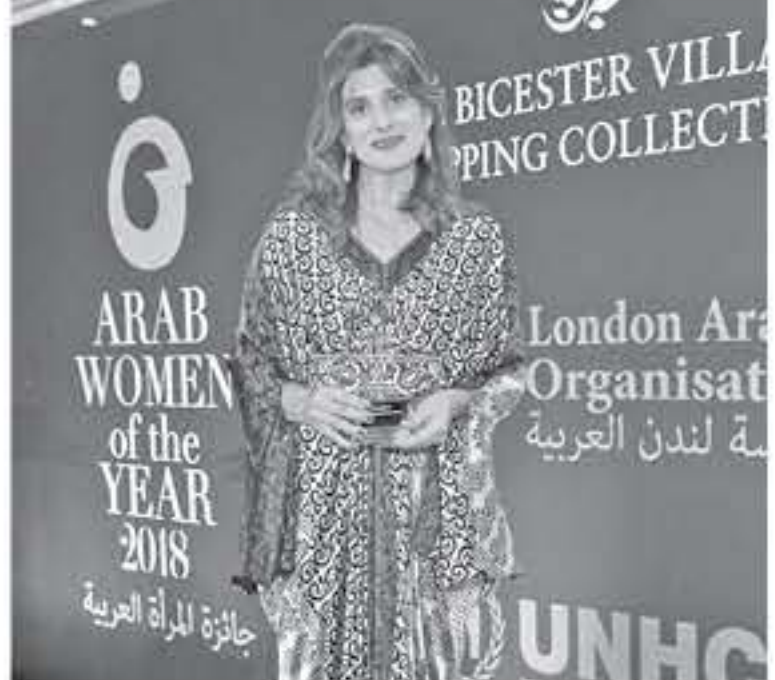
بترا - لندن

تقديرها لمخطومي هذه الفعالية على جهودهم التي بذلوها في تسليط الضوء على إنجازات المرأة العربية وتكريمها وتذكير صانعي القرارات بأن التنمية المستدامة لن تتحقق دون المشاركة الفعالة من المرأة التي تشكل نصف المجتمع. وقالت سموها "أشعر بالفخر لحصولي على هذه الجائزة الرموزة من بين السيدات العربيات البارزات. وأتلقى بكل تواضع هذا التكريم نيابة عن جميع مرضى السرطان، ونيابة عن كل سيدة عربية عملت بجهد وعزيمة وتميزت في كل مجال لتسقي الطريق أمام جميع بناتنا في المستقبل". يشار إلى أن سمو الأميرة دينا مرعد كانت ضلقت منصب المدير العام والرئيس التنفيذي لإسسة الحسين للسرطان على مدار خمسة عشر عاماً، كما توتت سموها منصب الرئيس الفخري للبرنامج الأردني للسرطان الثاني من عام 2016 إلى عام 2016.