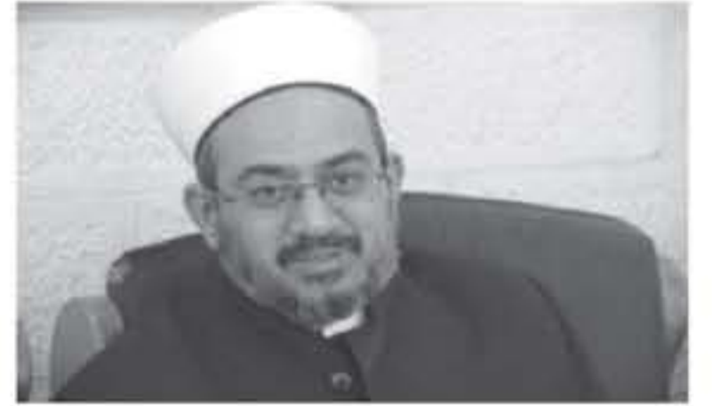
الأبواب - العقبة - طلال الكباريتي

التقويم الصادر عن الوزارة. وشددت على ضرورة إقامة الصلاة حسب الوقت المحدد لانتظار بعد الأذان وتكون الإقامة من خلال مكبرات الصوت الداخلية للمسجد فقط. وكان رئيس الوزراء الدكتور الرزاز قد ألقى هذا القرار فور تعميمه. لعدم مروه بمجلس الوزراء. بالإضافة إلى أن هذا التعميم أثار غضب عدد كبير من رواد مواقع التواصل الاجتماعي في المملكة. وأضاف المصدر المسؤول في مديرية أوقاف العقبة " طلب عدم ذكر اسمه " أن المديرية استلمت خلال السنوات الماضية نفس التعميم من الوزارة بعدم استخدام مكبرات الصوت الخارجية في الإقامة. ويرر المصدر هذا التعميم استقبال