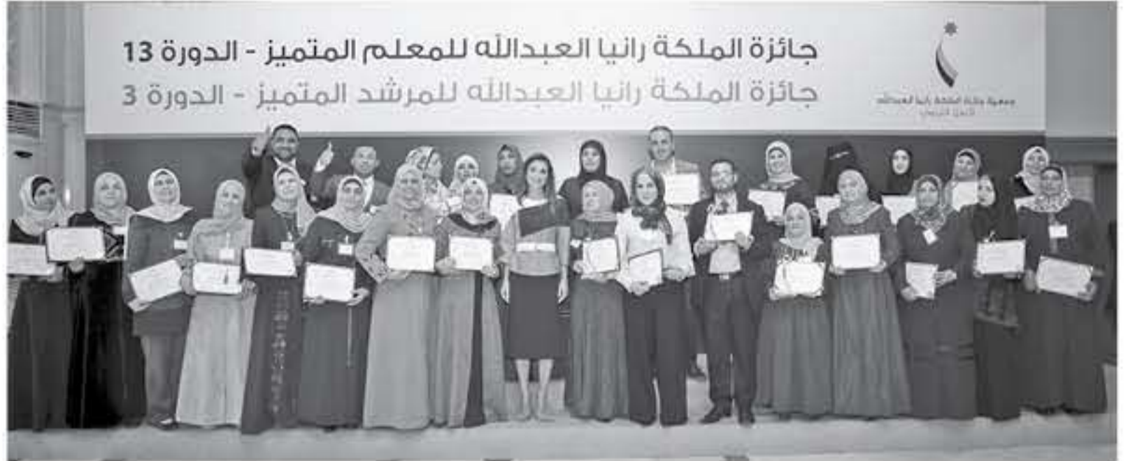
جائزة الملكة رانيا العبدالله للمعلم المتميز - الدورة 13 جائزة الملكة رانيا العبدالله للمرشد المتميز - الدورة 3