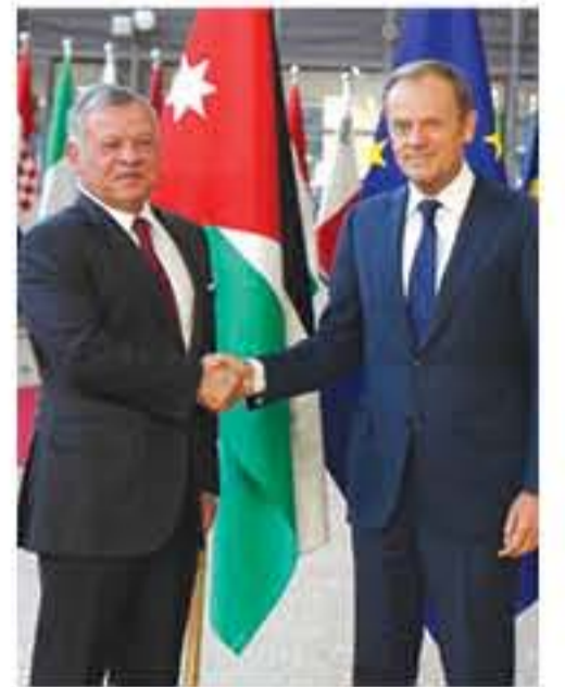
بترا - بروكسل