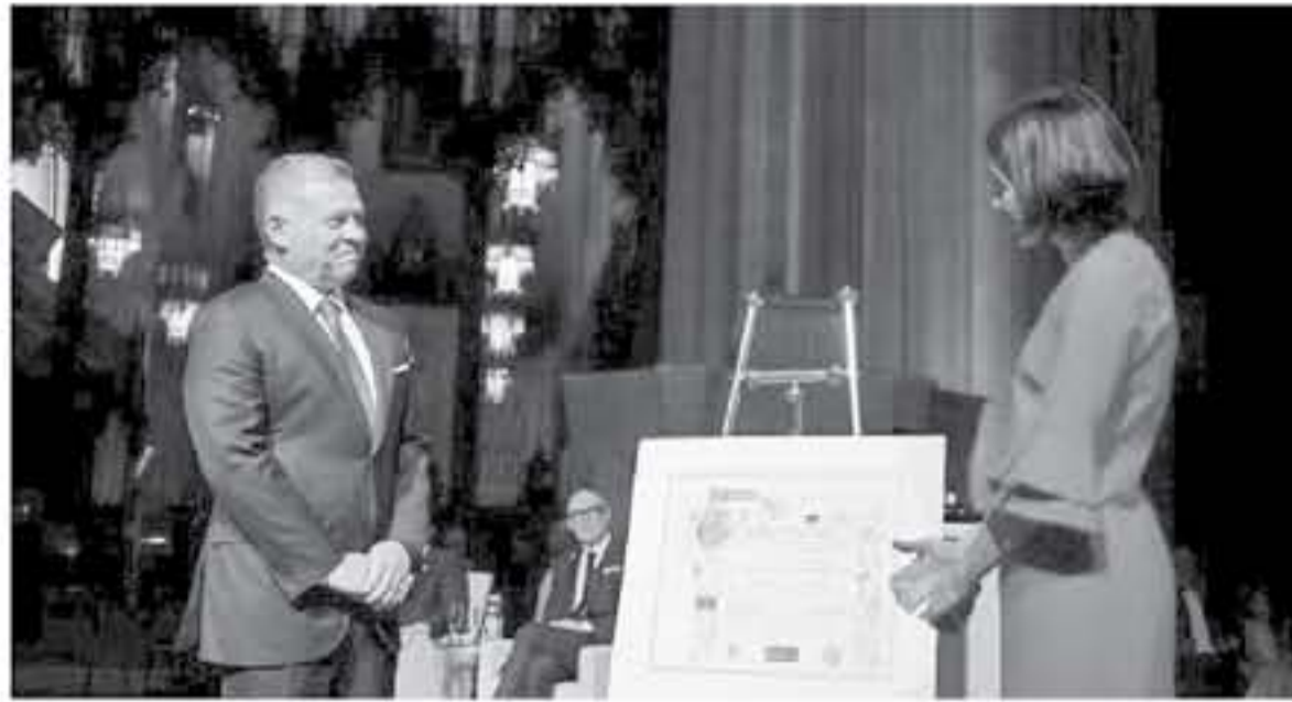
جلالته يستلم جائزة تمبلتون ارضيية،

أكد علماء أن جائزة تمبلتون التي تسلمها جلالة الملك عبد الله الثاني الشهر الماضي تشكل محطة مضيئة وفارقة في تاريخ مسيرة جلالته في تحقيق الوفاق بين الأديان ورعاية المقدسات الإسلامية والمسيحية في القدس الشريف وحماية الحريات الدينية. وأشاروا خلال ندوة نظمها كلية الشريعة في الجامعة الأردنية أمس الأربعاء، بعنوان (رسالة التسامح والوفاق) بمناسبة منح جلالته هذه الجائزة العظيمة، أن جلالته عمل على ترسيخ نهج فكر الاعتدال والوسطية وثمة دور بارز وفاعل في نشر قيم التسامح والوفاق القومية وعالميا، وقال رئيس الجامعة الدكتور عبد الكريم النضاه في كلمة افتتح بها أعمال الندوة "إن لهذه الجائزة عمان إنسانية نبيلة جسدها جلالته في جهوده الحثيثة والتفاعلية لتحقيق الوفاق بين الأديان وحماية المقدسات الإسلامية والمسيحية في القدس وحرس جلالته الكفاح على حماية الحريات الدينية، فكان نموذجاً عالمياً يُشار إليه بالبنان، فكانت "تمبلتون" العالمية ترجمة صادقة وحية استلهمها جلالته الملك مجدداً لما قدمه من أفكار ومبادئ وتوجهات واهتمام". وأضاف أن كل ما يبذلته جلالته من جهود تكامل اقتصادي أردني عراقي شامل باعتبار كل بلد عملاً للأحرار. كما شهد الجانبان على أهمية أن تكون العلاقات الاقتصادية بين البلدين علاقات تكاملية أكثر منها تنافسية خدمة لمصالح البلدين الجارين والشعبين الشقيقين، لتفيداً لتوجهات القيادة السياسية في البلدين، مؤكداً أن هناك فرصة كبيرة من أجل تحقيق التكامل الاقتصادي المنشود.