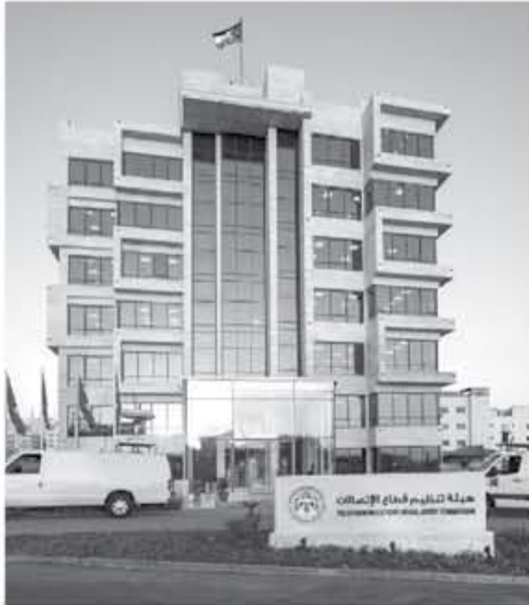
شبكة الاتصالات المحلية الأسرع الذي يمكن مباشرة على وتعزيز دور المملكة على المستوى الإقليمي في تصدير وتعبير السمعات الرقمية.

أكدت هيئة تنظيم قطاع الاتصالات أن شركتي الاتصالات الجديدتين التي تعزم الهيئة ترخيصهما عام 2019، لن تقدم خدمات الاتصالات المتنقلة، وجاء في بيان توضيحي نشرته الهيئة أمس، أنه توضيحا لما تناوله مؤخراً وسائل الإعلام المختلفة وعلى لسان رئيس الهيئة حول توجه الهيئة لترخيص شركتي الاتصالات جديدتين في العام 2019، فإن الهيئة تؤكد بأن الشركتان التي تم الإشارة إليها لن تقدم خدمات الاتصالات المتنقلة، حيث تتيح إحدى المرخص قيام الشركة بشركتي كوابل الألياف الضوئية، بينما تتيح الرخصة الثانية لتقديم خدمات الربط الأمان والانترنت بسمعات عالية وخيارات متعددة، وأكد رئيس مجلس مفوضي الهيئة الدكتور المهندس غازي الجيبور، أن الهيئة تكلف طلياً للحصول على رخصة اتصالات فردية تركيب كوابل الألياف الضوئية، ستكون الشركة من تقديم خدمات الاتصالات العامة باستخدام الموارد النادرة وستتمركز مكانة المملكة في دعم وتزويد خدمات نقل سعات الانترنت عن طريق كوابل الألياف الضوئية للدول المجاورة، مما يسهم في تطوير قدرات