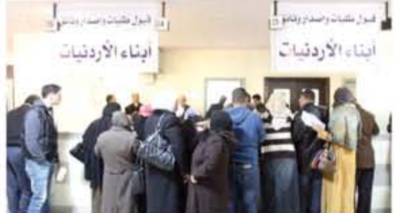
وثن "حق"، في بيانه الحوار المياء الذي تم خلال هذا العام مع كل من وزارة العمل ولجنة العمل والتنمية الاجتماعية

دعا تحالف "حق"، في بيان اليوم السبت، الى تعديل المادة ١٢ من قانون العمل لوقت لعام ٢٠١٠، بحيث يتم إعفاء أبناء الأردنيات من شرط الحصول على تصريح العمل. وأضاف البيان: "تعمل الآن وفي هذه المرحلة حيث يعرض العاملون على السلطة التشريعية مجلسها النواب والاعيان أن يتنصروا لحقوق المرأة والأخذ بالتفحرات التي تقدمنا بها". ودعا التحالف، في بيانه، إلى إضافة فقرة "ه" للمادة ١٢ بالنص التالي "لا تطبق أحكام الفقرات أ، ب، ج، د، هـ على العمال غير الأردنيين من أبناء الأردنيات".