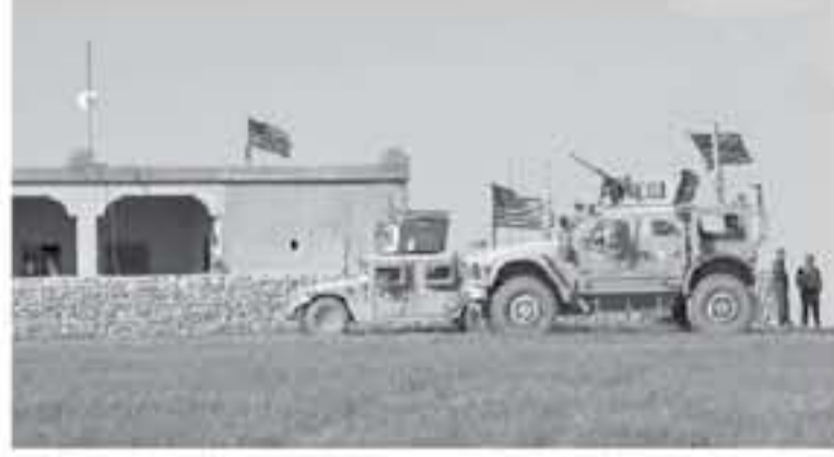
القدس المحتلة - وكالات

بأن رئيس الحكومة بنيامين نتنياهو يتمتع بدرجة تأثير كبيرة على ترامب. وأضاف أنه بعدما تبين أن تراهب أقدم على خطوة الانسحاب دون الالتفات إلى إسرائيل ومصالحها، فإن هذا التطور سيسبب معاناة إسرائيل.