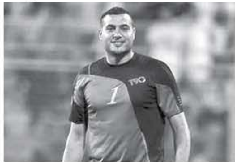
الإمارات - وكالات

من التطور السريع للمنتخب فلسطين خلال السنوات الأخيرة، مساعد عبد اللطيف البهاري منتخب بلاده في الفوز بلقب كأس التحدي الآسيوي عام ٢٠١٤، ليأهل إلى النهائيات القارية لأول مرة في تاريخه من خلال نسخة أستراليا بعد ذلك بعام. وسجل المهاجم المخضرم ضربة الجزاء التي هاز بها منتخب فلسطين بلعب كأس بانجاباندو الذهبية في بنجلاديش في أكتوبر الماضي، ويطلع بعد ذلك إلى مساعدة المنتخب القرب آسيوي للحصول على أول نقطة له في نهائيات كأس آسيا.