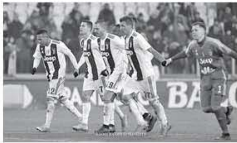
روما - وكالات

يسجل وينبأ في البكاء ولاسيو يفوز ١-٣ على كالياري ويصعد للمركز الرابع. وتابعت ريال مدريد على قمة العالم ومودريتش يحتفل.. الكرواتي افتتح النتيجة الساحقة (١-٠) في النهائي ضد العين الإماراتي.. وختمت "البيتي وساري" يا لها من صدمة.. جوارديولا وتبلسي يستعان في عمر نارهما، لنا ليفرول يتعد.. ويونايك يحقق الفوز في غياب مورينو.. أما صحيفة "توتو سيورت، فعنوت: "يوفنتوس بطل الشتاء" لا يُعجز، وروما ينحني لأبطال إيطاليا.. رأسية مانديوكيتش حاسمة وVAR يلفي هدفًا متأخرًا لدوجلاس كوستا.. وأضافت: "لثولتي وأبيولي يهيجان الفراق مع اليوغي عند ٨ نقاط.. وتابعت "سيالتي وجاتوزو.. أزمات في أعين الميلاد.. إنتر يتعامل مع كينيفو وميلان يخسر من فيورنتينا.