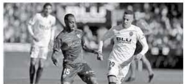
مدرّيد - وكالات

الرابعة من الوقت المحتسب بدلًا من الضائع. ورفع فالنسيا رصيده إلى ٢٢ نقطة في المركز الثامن، وتوقف رصيد هويسكا عند ٨ نقاط في المركز العشرين والأخير. يذكر أن هذا الفوز هو الرابع لفالنسيا في الدوري هذا الموسم، مقابل الخسارة في ٣ مباريات، والتعادل في ١٠، فيما تعد هذه الخسارة هي الحادية عشر لهويسكا، مقابل الفوز في مباراة، والتعادل في ٤.