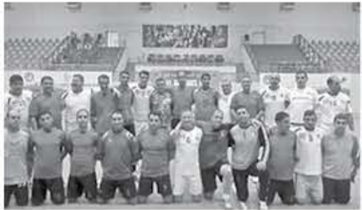
الاتحاد - عمان

يتم خلاله إصدار مواعيد البطولات العسكرية خلال العام المقبل، بحيث يأتي هذا البرنامج بالتنسيق مع البطولات الأخرى التي تنظمها الاتحاد الرياضية في مختلف الألعاب. ويحرص الاتحاد الرياضي العسكري على إقامة بطولاته بحيث لا تتعارض مع بطولات الاتحادات الأخرى، خدمة للرياضة الأردنية، لا سيما وأن عددًا كبيرًا من نجوم المنتخبات الوطنية والأندية في مختلف الألعاب هم من كوادر القوات المسلحة المنظمة لفترهم العسكرية.