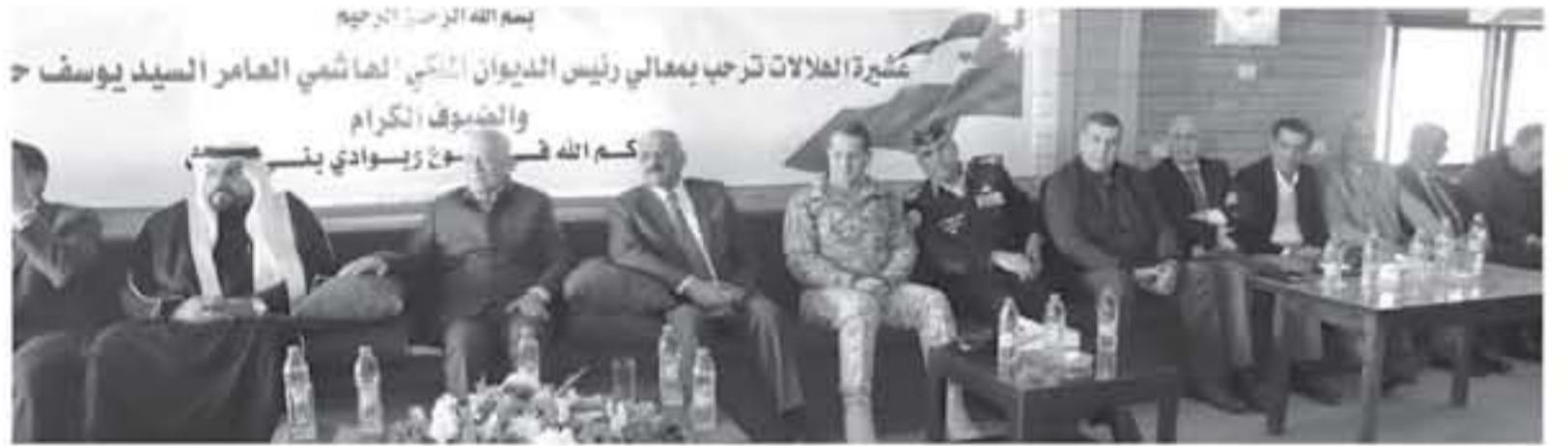
الأنباط - الطفيلة

أشاد الإيجابية على مستوى الخدمات المقدمة للمواطنين. فضلاً عن معالجة الأزماعات المرورية الخائفة، والمشكلات التنظيمية الأخرى التي كان يعاني منها وسط المدينة سابقاً. وأشار العيسوي إلى أن المبادرات الملكية نصب بمجملها لتحقيق هدف واحد وغاية سامية يسعى إليها جلالة الملك، تمثل في تحسين مستوى حياة المواطن وتطوير سيل العيش الكريم له، من خلال تحسين الظروف الاقتصادية والتنموية لمختلف محافظات ومناطق المملكة، وتطوير مستوى خدمات البشر المتمثلة فيها. لافتاً إلى حرص جلالة على لمس احتياجات المواطنين والوقوف على همومهم خلال زيارته لمختلف محافظات ومناطق المملكة وفدائه المستمرة معهم في مختلف المناطق، فضلاً عن توجيهاته المستمرة للتواصل مع المواطنين والالتقاء بهم والاستماع لطلباتهم ولتبيتها حسب الإمكانيات المتاحة.