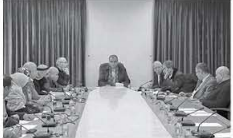
الجانب الفني. وأوضح عبيدات أن اللجنة ونتيجة لقاء الودي الذي جمع كتيب المهندسين

ورئيس فرع النقابة من جهة والنائب الرياطي بحضور أعضاء اللجنة تم التوافق على إصدار بيان توضيحي من قبل اللجنة حول القضية وتلاوته تحت قبة البرلمان حول ما جاء على لسان النائب الرياطي تحت قبة البرلمان بعد اثارته للقضية المتعلقة بمنشاء العقبة الجديد.