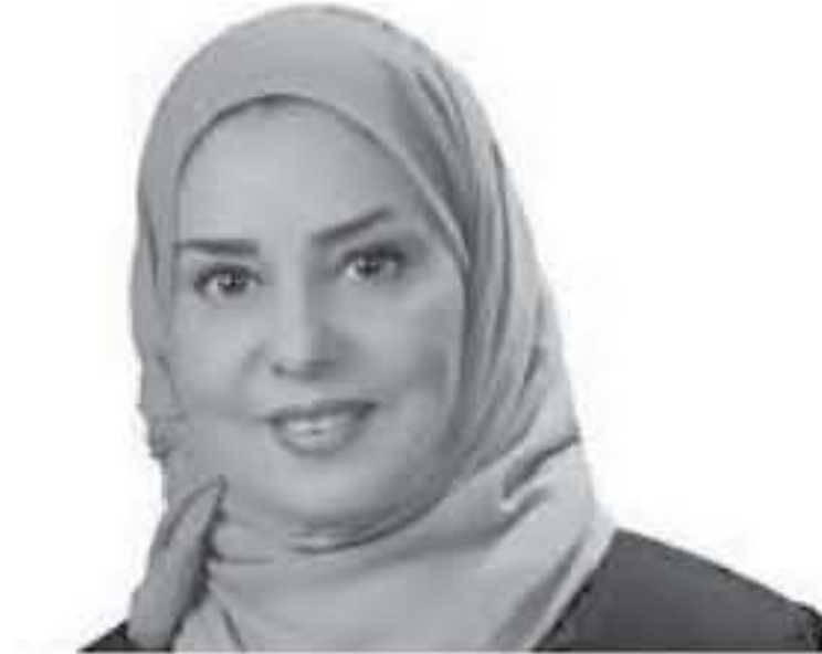
بترا - الحناجة

السياسة والاقتصادية والاجتماعية. وأشارت إلى الدور الهام والحيوي الذي يلعبه الأردن عربياً وإقليمياً ودولياً على مختلف الصعد، مرحبة بكل أوجه تعزيز التعاون البرلماني مع مجلس النواب الأردني.