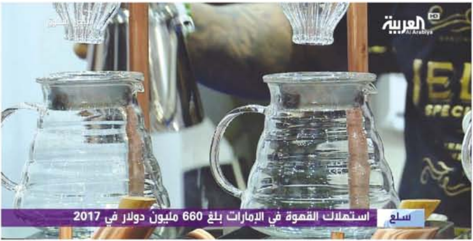
سابع استهلاك القهوة في الإمارات بلغ 660 مليون دولار في 2017