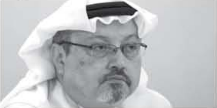
الرياض - وكالات

الملكة باسنتيول في الثاني من أكتوبر تشرين الأول. جاءت الدعوة خلال جلسة بالحمكة الجزائية بالرياض هي الأولى في قضية خاشقجي التي أضرت كثيرا بسعة الملكة وأدت لتدهور علاقتها مع دول عربية.