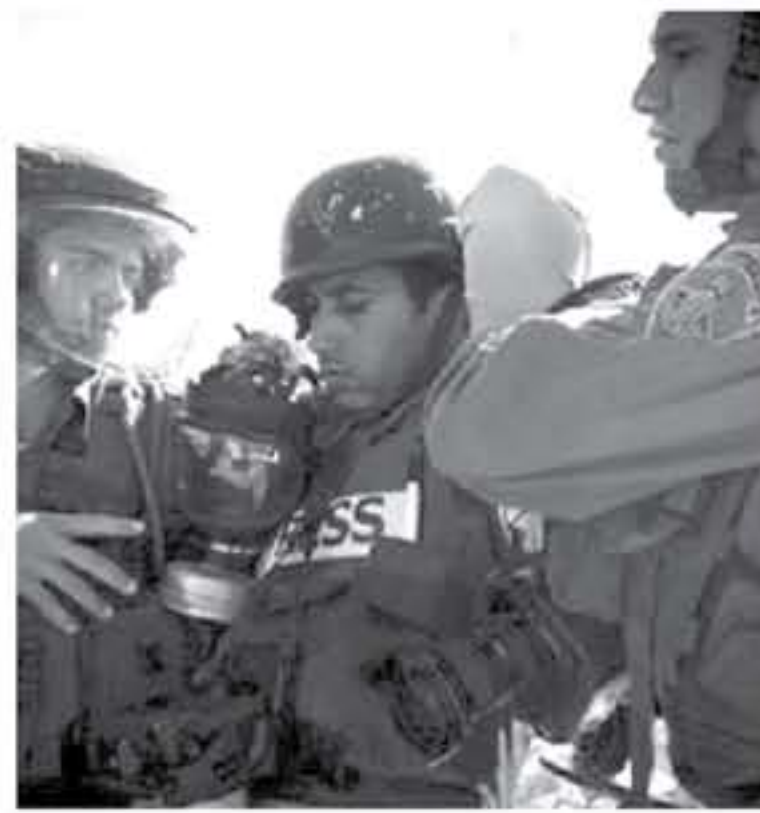
رام الله - الأنايب

استشهد صحفيان فلسطينيان على يد قوات الاحتلال الإسرائيلي، وبلغت الانتهاكات الإسرائيلية بحق الصحفيين في الأرض الفلسطينية المحتلة 43 انتهاكا خلال العام الماضي. وقالت وكالة الأنايب والمعلومات الفلسطينية "فدا"، في تقريرها السنوي التاسع عن الانتهاكات الإسرائيلية للصحفيين، إن قوات الاحتلال ما زالت تواصل ملاحقتها واستهدافها للصحفيين عبر إطلاق الرصاص الحي، والمعدني، وإطلاق الفايبل المسيلة للدموع والاعداء عليهم بالظنر والاعتقال الماتكر أو بتفديتهم للمحاكمات ضمن سياساتها المنهجية والمخططة والهادفة لمصادرة الحقيقة وتكميم الأقواء للتعقبة على جرائم اليومية بحق أبناء الشعب الفلسطيني. ودعت "فدا"، المؤسسات الحقوقية والاتحادات والنشابات الصحفية العربية والدولية، إلى وقف جادة من قبل لوقف هذه الجرائم والانتهاكات باستهداف وقتل الصحفيين والنسورين الفلسطينيين.