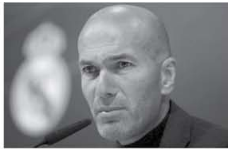
إلى أنه قريب من تدريب مارسيليا خلفاً للمدرب الفرنسي رودي جارسييا. هذا ويرتبط زين الدين زيدان بعلاقة خاصة مع مارسيليا، حيث رأى الأسطورة

الفرنسية النور في هذه المدينة، كما تعلم زيدان فيها أجدبيات كرة القدم، ليبدأ بعدها الرحال إلى وجهات أخرى داخل فرنسا وخارجها، ويضع اسمه كواحد من أحسن اللاعبين في العالم. في المقابل، يعاني مارسيليا هذا الموسم من تدرب واضح في المستوى، إذ يحتل الفريق المرتبة السادسة في جدول ترتيب الدوري الفرنسي برصيد 27 نقطة، ويتبعه من المنتصر باريس سان جيرمان بـ 20 نقطة كاملة، ويخطط للتعاقد مع زيدان للعودة إلى الواجهة بالموسم القادم. جدير بالذكر أن زيدان الدين زيدان (٤٦ عاماً)، يلتزم الصمت حيال وجهته التدريسية المقبلة، إذ يريد الاعتماد حالياً على ضغوط عالم كرة القدم، وقضاء أكبر وقت ممكن مع عائلته.