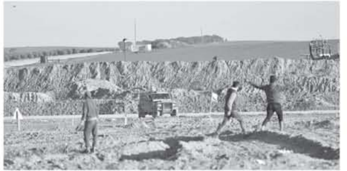
غزة