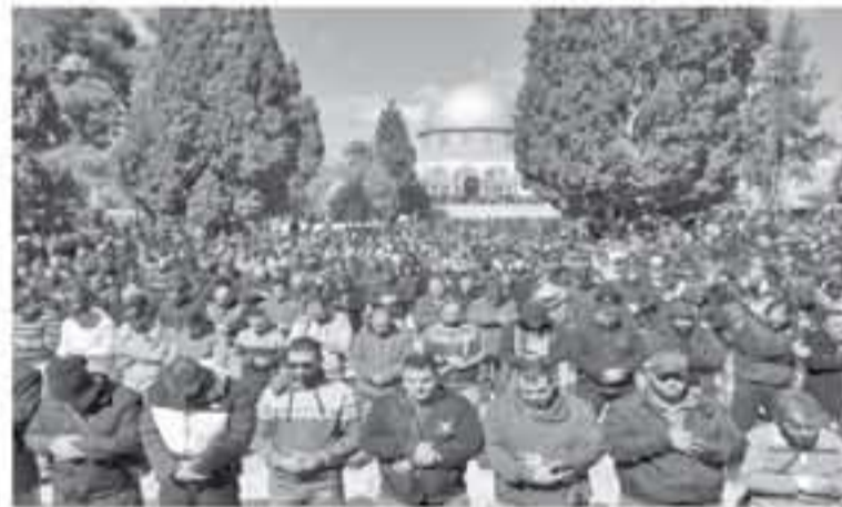
القدس المحتلة - وكالات

أدى ما يزيد عن 40 ألف مهمل صلاة الجمعة في المسجد الأقصى المبارك بمدينة القدس المحتلة، وذلك على الرغم من القيود والعراقيل الشديدة التي فرضها الاحتلال الإسرائيلي للتحيلولة دون وصول الفلسطينيين للمسجد الأقصى لأداء صلاة الجمعة كما جرت العادة. وشهدت بوابات البلدة القديمة والمسجد الأقصى تواجداً عسكرياً مكثفاً لقوات الاحتلال، التي قامت بإيقاف عشرات الشبان والتدقيق في هوياتهم قبل دخول المسجد.