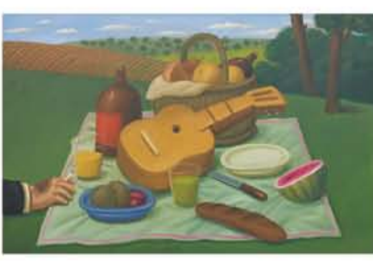
الأنباط - وكالات

يستضيف كاستوت غاليري دبي في سالة عرضه الواقعة في منطقة الفون، معرضاً ضخماً للفن «الطبيعة الصامتة» يضم لوحات زيتية ورسوماً مائية للفنان العالمي الكولومبي الشهير فرناندو بوتيرو لستمر حتى 10 فبراير الجاري. وأوضح بيان صادر عن كاستوت غاليري دبي أنه تم ابتداء الأعمال الفنية التي يتم عرضها للمرة الأولى ونموذ مجموعة هذا الفنان المبدع بين العامين 1980 وحتى مطلع العام الحالي. إذ جسد من خلال 30 عملاً "الطبيعة الصامتة" بخاصة الزهور والفاكهة والأشياء والألات الموسيقية والمشاهد الراقعة للمحطاة اليومية. وبين أن لوحة "الطبيعة الصامتة" عن آلة المترودين التي رسمها بوتيرو شكلت نقطة تحول في مسيرته الفنية، إذ من خلال تغيير حجم النقود المركزية