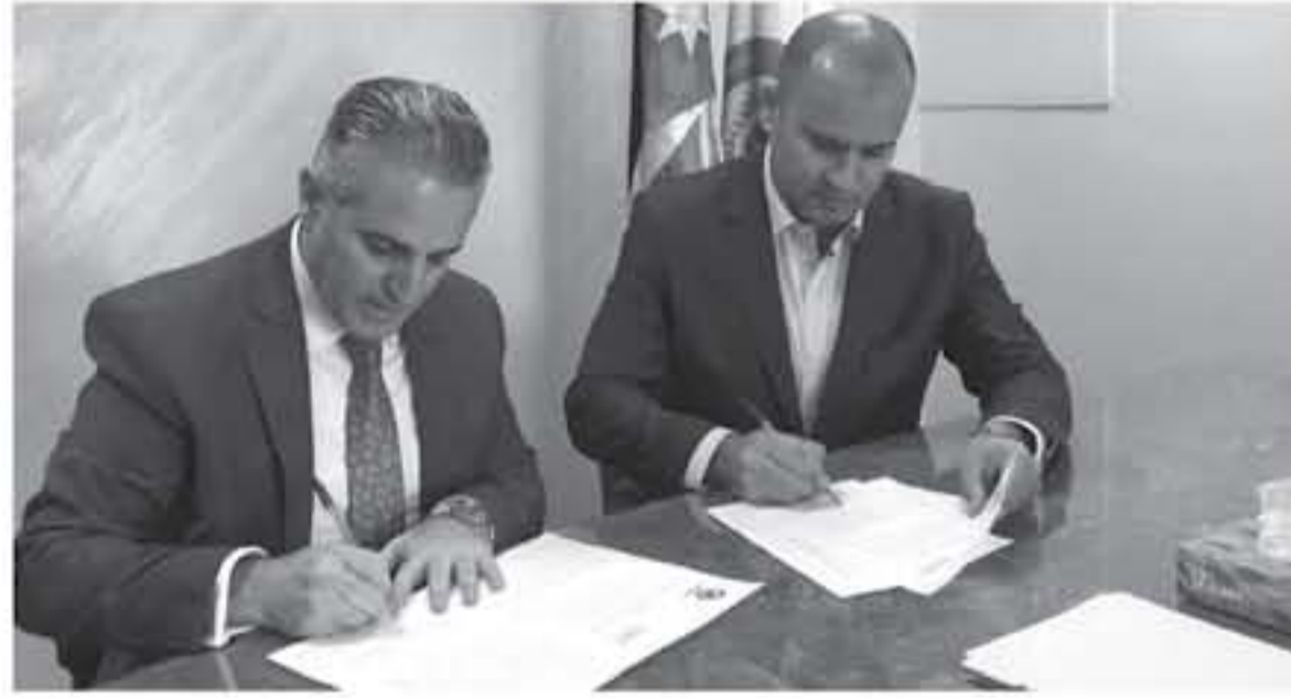
ويذكر ان الاتحاد العربي للمعارض والمؤتمرات الدولية هو أحد الانجاعات العربية التوعوية المتخصصة العاملة في نطاق مجلس الوحدة الاقتصادية العربية وتأسس عام 1996 ويتخذ من القاهرة مقراً له.