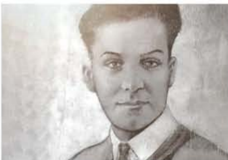
الأنباط - وكالات

أبو القاسم الشابي ،أكنه عبقريته كما يأكل السيف فمدد، هكذا قال عنه الراحل الحسن الثاني عاهل المغرب السابق فقد تولى الشابي وهو في الخامسة والعشرين من عمره في التاسع من أكتوبر 1934، إثر مرض في القلب لم يمهله طويلاً. وبالرغم من وفاته وهو في ريعان شبابه، إلا أن اسمه بقي حياً وشعره لا زال راسخاً في ذاكرة التونسيين والعرب جميعاً. ترك الشابي بعد وفاته أرمة شابة هي ابنة عمه ،شبهه، التي سخرت كل حياتها لشخصية ابنها تربية صالحة، إلى أن توفاه الله.