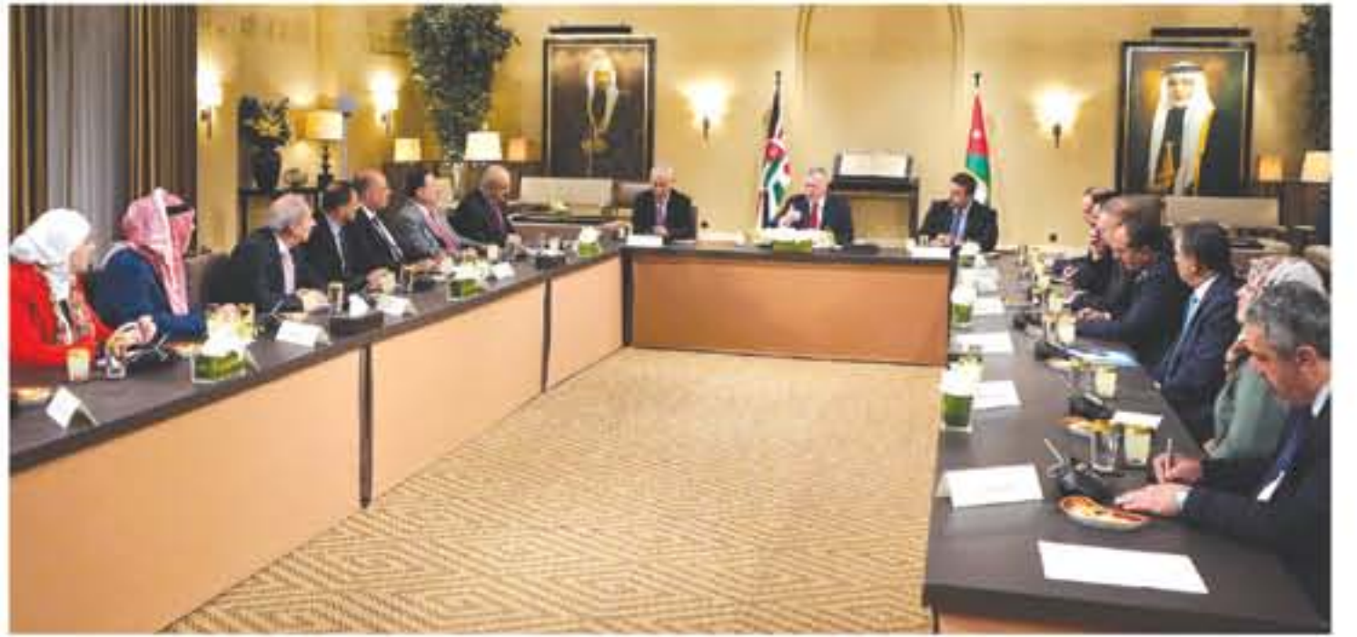
عمان - بتر

أكد جلالة الملك عبدالله الثاني ضرورة التوضيح للمواطن الأردني الأولويات والبرامج التي يسير بها الأردن نحو مستقبل سياسي واقتصادي واجتماعي. جاء ذلك خلال لقاء جلالة الملك في قصر الحسينية أمس الأربعاء مع رئيس وأعضاء كتلة مبادرة النيابية، الذي تم خلاله استعراض آليات تطوير العمل البرلماني