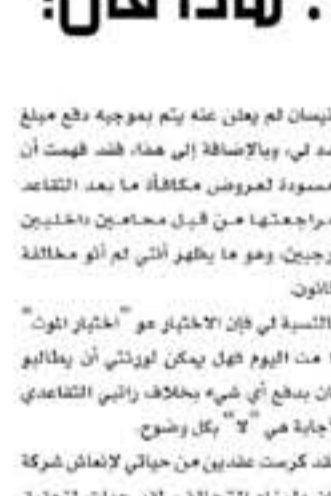
طوكيو - وكالات

قضية كارلوس غسن - الرئيس السابق لشركة نيسان - تتخذ الصيغة اليابانية في أنحاء العالم، وبأخر تطور على قضية كارلوس غسن، مثل غسن أمام المحكمة يوم الثلاثاء للمرة الأولى منذ حادثه احتجاز الساعده في اليابان شهر نوفمبر من العام الماضي. ورد كارلوس غسن على الاتهامات الموجهة له بالتهريب الضريبية بأن الاتهامات غير صحيحة وأنه محتجز ظلماً، وفيما كان عالم السيارات مغموماً واليابان يهتف بـ "غسن" باعتباره الرجل الذي أُنقذ شركة نيسان من الإفلاس إلا أن غسن تم اقياده إلى المحكمة والتفويض في يديه وبحول جديدة خسرت كما يرى رجل الأعمال الشهير أحد أكثر من السابق ما يشير إلى ظروف اعتقاله السيئة وعند سؤال محامي الدفاع عن قضية كارلوس غسن (موتوهارو أوسمورا) حول إمكانية إطلاق سراح موكبه بكفالة، أجاب المحامي الياباني بأنه في مثل هذه القضايا فلا تقبل الكفالة إلا بعد الجلسة الأولى، والتي لن تعقد قبل ٦ اشهر من الآن.