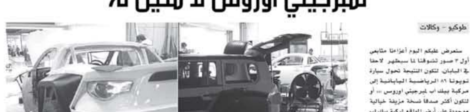
طوكيو - وكالات

تعرض عليك اليوم أزعاما متابعي أول ٣ صور تشوفنا كما سيظهر لاحقا في اليابان. تتكون النتيجة تحول سيارة تويوتا ٨٦ الرياضية اليابانية إلى مركبة بيك اب لهبرجيني اوريوس ، او لتكون أكثر صفاً نسخة مزيفة خيالية موجودة على أرض الواقع مركبة بيك اب لهبرجيني اوريوس.