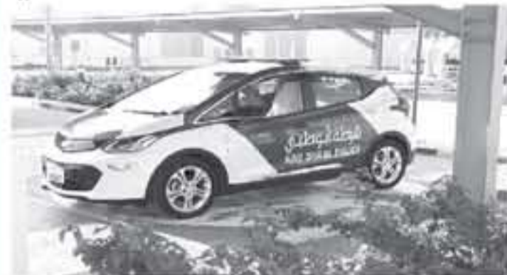
أبوظبي - أنباط

أعلنت شرطة أبوظبي عبر حسابها على تويتر عن انضمام سيارة صديقة لبيئة هي شفروليه بولت الكهربائية إلى أسطول دورياتها ونشرت صورة للسيارة الجديدة.