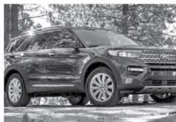
نيويورك - وكالات

بعد طول تشويق وانتظار ظهرت سيارة فورد اكسبلورر 2020 الجديدة كليا على الانترنت قبل أيام من موعد إطلاقها الرسمي الذي سيكون ضمن فعاليات معرض ديترويت للسيارات 2019 في الولايات المتحدة الأمريكية حيث سلطت الضوء على الإصدارات التي سيبدأها هذا المحدث العالمي إن شاء الله في البداية ستحدث عن شكل فورد اكسبلورر 2020، لتصميم أجدد سيارات فورد 2020 محافظ على هوية مستمدة من الجيل السابق ولكنها حصلت على تيك أممي جديد جمومي التصميم تحيط به مصابيح أمامية بتصميم عصري نحيل، وحصلت اكسبلورر 2020 على فتحات تهوية جديدة كبيرة، وصادمين أمامي وخلفي جديدين، ومصابيح خلفية جديدة.