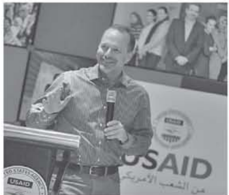
الأنياب - عمان

اتفق عليها بلدينا منذ عام تقريباً. وقد تعهدت مذكرة التفاهم بتقديم ١,٣٧٥ مليار دولار سنوياً من المساعدات الخارجية الثنائية من ٢٠١٨ إلى ٢٠٢٢ - أي ما مجموعه ٦,٣٧٥ مليار دولار. وأشار القائم بالأعمال إلى أن الكونغرس الأميركي في عام ٢٠١٨ زاد من المساعدات المتعهد بها إلى ١,٥٥٥ مليار دولار. ويشمل هذا التمويل ١,٥٠٨ مليار دولار في المساعدات الاقتصادية وكذلك دعم بقيمة ٤٢٥ مليون دولار لقطوات المسلحة الأردنية.