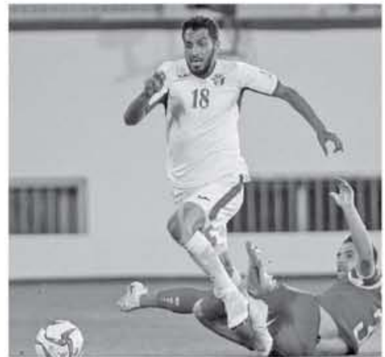
أبو ظبي - وقد اتحاد الإعلام الرياضي