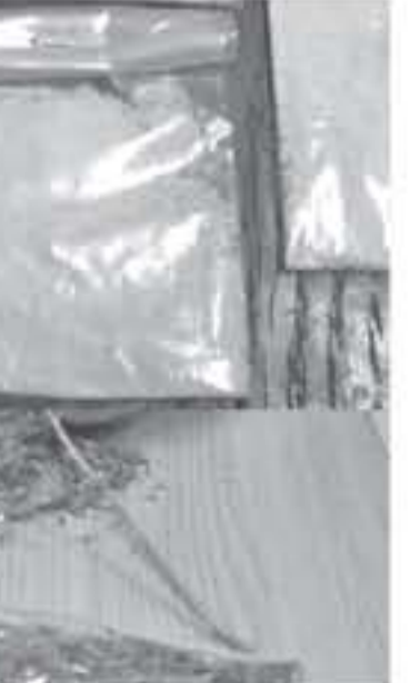
الأنياب - عمان

تمكن العاملون في إدارة مكافحة المخدرات منذ بداية عام ٢٠١٩ من ضبط ٨٠ شخصاً من مروجي وحائزي ومتعاطي المواد المخدرة، وبحوزتهم كميات مختلفة من المواد المخدرة، فيما كان أحدهم بحوزته مجموعة من أوراق اللقذ الأردنية المزيفة.