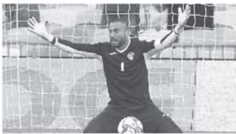
كل جهداً تلك ععدة التعادل مع قياتم حيث بالمباريات السابقة لم تحقق الفوز ولم تعرض لخسارة بعد أن يسيطر التعادل على

تلبية أمام هيتام واستطاعته الوصول إلى أوار متقدمة دون تلقي أهداف ليصل إلى رقم قياسي جديد في حياته الكروية، معتبراً أن شفيق يعتبر من أفضل حراس الشرطة بالسنوات الأخيرة ويعتبر صمام أمان لقبية نجوم المنتخب. يذكر أن منتخب الشمام أثنى الدور الأول بصدارة مجموعته برصيد ٧ نقاط بعد أن حقق الفوز على أستراليا بهدف تظليله وسوريا بهدفين مقابل لا شيء واختتم الدور الأول بتعادل شفيق أمام منتخب فلسطين، بالمقابل تأهل هيتام بالمرز الثالث بعد أن تلقى خسارتين من العراق ٢-١ وإيران ٢-١، وحقق الفوز الوحيد على اليمن ١-٠ ليتأهل بالمرز الثالث برصيد ٣ نقاط.