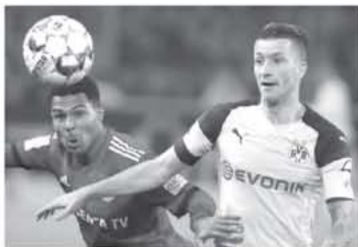
برلين - وكالات

لحديث عن تصرفه قريبه لجردو لترينج البوندسليجا، بفرق ٣ نقاط عن البايرن، الوصيف والتي ستزيد إلى ٦ نقاط حال الفوز على لايبزيج، اليوم السبت في الجولة ١٨، وعن ذلك قال: "الأمور كلها تعتمد علينا وفي أبدينا، علينا فقط أن نتعامل مع المباريات كما فعلنا في الدور الأول، بعدها ستكون كافة الاحتمالات واردة". واختتم: "أشعر في دورشوند بأثني داخل بيتي، ولا يتقصني شيء هنا، وهذا ما يجعلني فخوراً وسعيداً وممتناً للنادي، وحلمي تحقيق شيء ما في النادي الذي نشأت به".