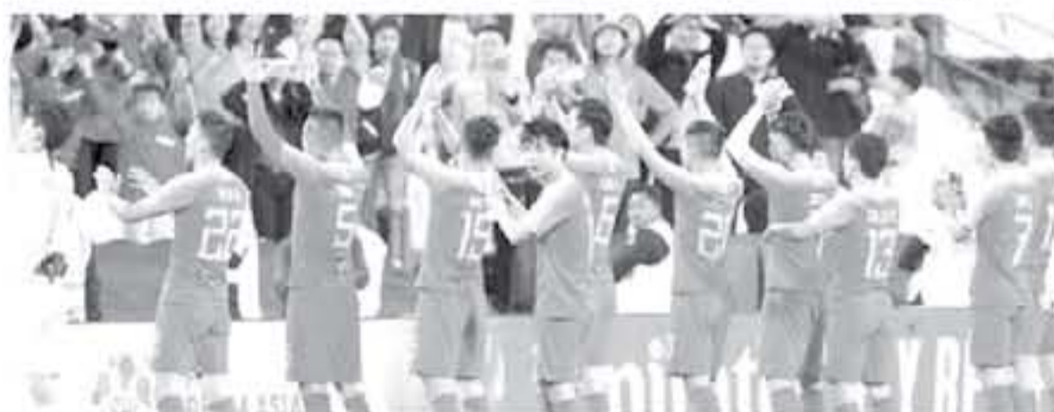
ابوظبي - وكالات

الصين ٢-١، بينما أثنى أول لقاء رسمي يفوز الصين ٤-١، في دورة الألعاب الآسيوية عام ١٩٧٨ وأقيمت في بانكوك، أما أول التصاريح في مبارياته الأولى على فيرغيزستان ٢-١، وهما وفاز ٣-٠ على الفلبين، وخسر أمام كوريا الجنوبية ٢-٠، والتقى المنتخب الصيني والتايلاندي قبل هذا اللقاء ٢٨ مرة من قبل، فازت الصين ١٨ مرة، بينما تلوقت تايلاند ٥ مرات، وتعادلا ٥ مرات، وجمع أول لقاء بين المنتخبين عام ١٩٧١، وأثنى لصالح