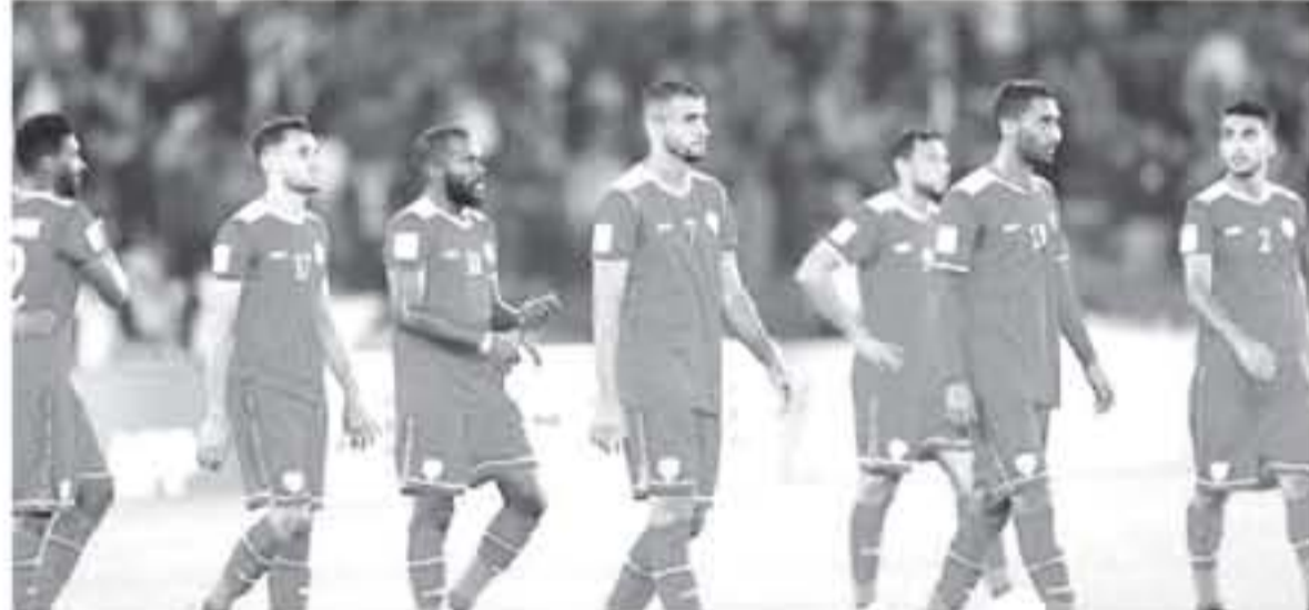
ابوظبي - وكالات

أعلى تصنيف في المنتخبات الآسيوية، بخاصية على اليمن ثم بدمين على هيتام دون عطاء يذكر، وتحتل باستمرار في كيبور بوجوه السرب البرتغالي كارلوس كيروس منذ عام ٢٠١١، وقدمت مستويات رائعة في كأس العالم الأخيرة في روسيا، ونقل موقع الاتحاد الآسيوي عن كيروس قوله "كأس آسيا بالنسبة لمنتخب إيران هد بدأت الآن، وعلينا أن نستعد بشكل جيد لمباريات الأدوار الإقصائية"، وتابع "أعتقد أن المرحلة المقبلة مهمة