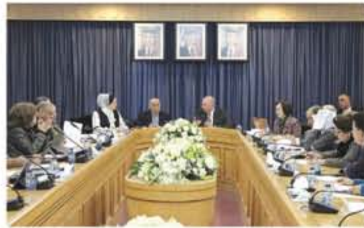
حضور رئيس مجلس النواب المهندس عاطف الطراونة جالبا من الاجتماع. وأشار الطراونة إلى أن توجيه جلالته الملك بإصدار قانون العفو العام جاء كرسالة لتسمح وفرصة لتصويب مسار المحظوظين. التفاصيل من ٤٠