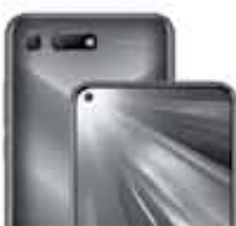
HONOR View20 48MP 3D Camera | HiResE

هواتف الشركة الرائدة ولكن بتكلفة أقل بكثير. وشكلت وكالة "رويترز" عن ألبت زوسرمان، وهي محللة في شركة أبحاث السوق "غارنر" قولها: "إنهم يحاولون حقاً بناء العلامة التجارية في أوروبا". وأضافت أن "هواوي" بدأت كإحدى أرخص عن الهواتف الذكية الأكثر تكلفة في هواوي، لكن الشركة بدأت الآن في زيادة أسعار علامتها "هواوي" التجارية تدريجياً. يُشار إلى أن أوروبا أصبحت ثاني أكبر سوق لشركة هواوي، مما يجعلها منطقة رئيسية تزيد من التوسع الدولي، حيث تحاول الشركة أيضاً تعزيز وجودها في الولايات المتحدة.