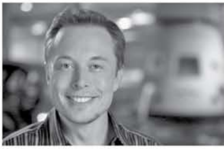
تاريخياً وعلى الرغم من التقارير التي أكدت زيادة إنتاجها ومبيعاتها من سيارتها الرئيسية Model 3، إلا أن قرار الإدارة الأمريكية

نيويورك - وكالات أعلن إيلون ماسك، الرئيس التنفيذي ومؤسس شركة صناعة السيارات الكهربائية الأمريكية -تيسلا، أنه سيتم تسريح 3000 من موظفيها أي ما يزيد عن 30% من شخص. يأتي ذلك في محاولة من ماسك لتخفيض تكاليف إنتاج السيارات من أجل زيادة الأرباح وقال محذراً "إن الطريق أمامنا صعب للغاية" لكي نحقق أهدافنا من إنتاج السيارات الكهربائية مبنية على 2025. في بداية تعاملات نهاية الاسبوع الماضي بعد إعلانها تحقيق أرباح خلال الربع الأخير من العام الماضي نقل عن ذلك التي حدثتها في الربع الثالث كما كتفت وكالة بلومبيرج أن "تيسلا" تخضع لضغوط من أجل الحد من نفقاتها بعد أن تجاوزت ما قال عنه "ماسك" بأنه العام "الأشد صعوبة" في