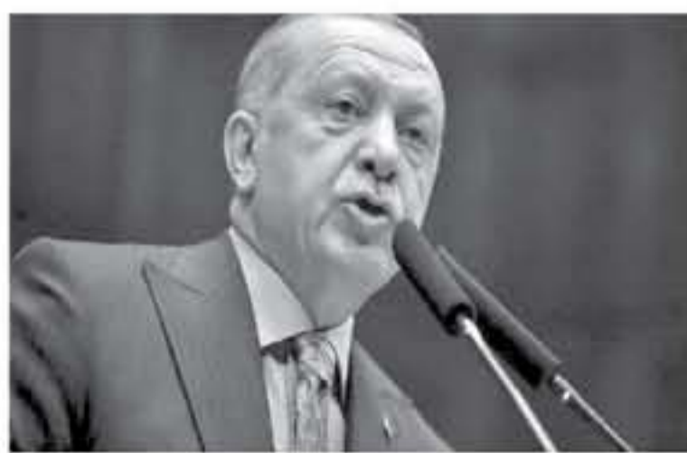
هذا وقتل الرئيس التركي في إقطاع الرئيس الروسي فلاديمير بوتين، بدعم إنشاء المنطقة أمنة شمال سوريا. وشهد أردوغان، على ضرورة طرح "التفاهة أئمة" البرمة بين تركيا وسوريا السورية ومعتلي الأكراد، مشيراً أيضاً إلى أن الحساب القوات الأميركية من سوريا سيكون خطوة إيجابية.

توقع الرئيس التركي، رجب طيب أردوغان، أمس الجمعة، إنشاء منطقة أمنة في شمال سوريا في غضون بضعة أشهر وقال أردوغان إن تركيا هي القوة الوحيدة التي تستطيع إقامة منطقة أمنة، مشيراً إلى أن إقامة المجتمع الدولي للمنطقة أمنة أمر غير وارد. وتابع "الاتفاق 1998 مع سوريا (الاتفاق أئمة) يسمح لتركيا بدخول أراضيها عندما تواجه تهديدات، وأكد أردوغان أن تركيا يجب أن تكون لها السيطرة على الأرض وليست مستعدة لاهتزازات أخرى.