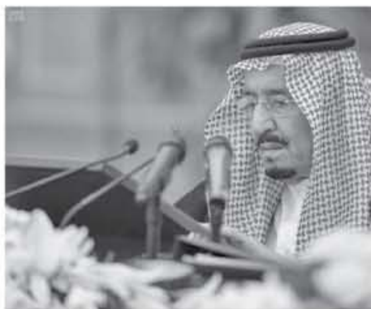
الاجتماعية مع السودان، وزيادة التبادل التجاري، وكشف عن خطة عمل واضحة وزيارة لاحقة لرجال أعمال سعوديين للسودان في هذا الصدد.

بعث خادم الحرمين الشريفين الملك سلمان بن عبد العزيز آل سعود، وفداً وزارياً سعودياً إلى السودان، تضامناً معه في مواجهة التحديات الاقتصادية الراهنة. واستقبل الرئيس عمر حسن البشير، رئيس جمهورية السودان، في بيت الضيافة، الوفد الوزاري السعودي الذي يضم كلاً من وزير التجارة والاستثمار الدكتور ماجد بن عبد الله القصبي، ووزير النقل الدكتور نبيل بن محمد العامودي، ووزير الدولة لشؤون الدول الإفريقية أحمد بن عبد العزيز هذان. وأكد وزير التجارة والاستثمار الدكتور ماجد بن عبد الله القصبي في تصريح صحافي، أن زيارة الوفد للسودان جاءت بتوجيه من خادم الحرمين الشريفين لتعزيز العلاقات